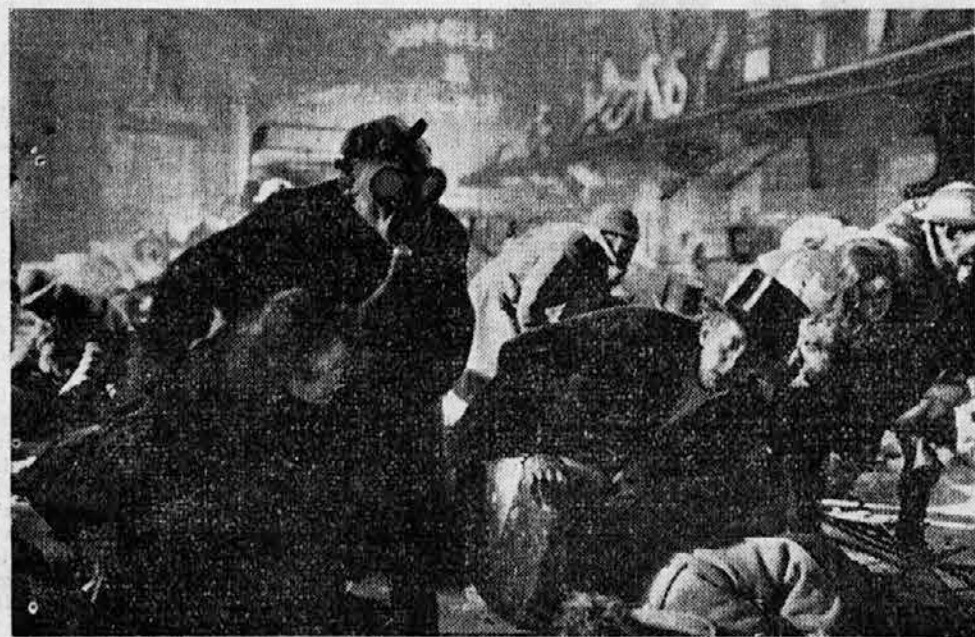
»Svet iz leta 3000« v filmu: prizor iz strahovite vojne, ki bo v eni uri uničila stari svet. — Slika je vzeta iz filma po fantastičnem romanu H. G. Wellsa »Things to come«.

Izhaja pa tudi bolj salonska izdaja »A. F.«, namreč mesečnik »Courier Royal«. Smatrajo ga za zelo imeniten in upoštevan list, ki črpa svoje informacije iz najvišjih krogov in jih podaja do velikih potankosti.