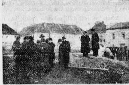
Komisija na stavbišču.