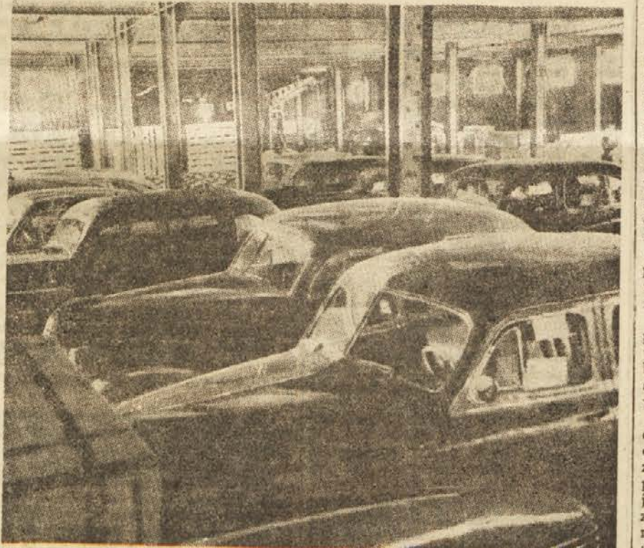
Avtomobili, ki so jih kupili izseljenci iz prostovoljnih prispevkov, čakajo na vkrcanje na ladjo »Radnik«.

Razgibali so se tudi farmerji. Vlada je namreč »v želji da prisikči na pomoč Veliki Britaniji in ostalim« znižala cene žitu. Farmerji pa pravijo: »Ako je naša