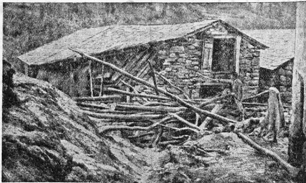
Razdejanje po povodnji v južni Franciji

V nabito polnem tramvaju je sedel mali sinek na kolenih svojega očeta in napeto gledal bujno oblečeno damo, ki se je prerinila v notranjščino. »Mama, to je neka gospa!« »Št! Saj vemo, da je gospa!« Malček je začudeno pogledal in zakričal: »Toda, mama! Prav kar si rekla atku, kaj neki more biti ta stvar, ki sedaj prihaja.«