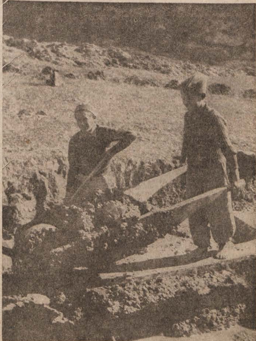
Pri regulaciji Bistrice na Sodražici pridno pomagajo tudi mladinci, ki odvažajo nakopano zemljo iz nove struge

Storili bomo vse, da izpolnimo delovni program, ki smo si ga zastavili za leto 1946, in da se izkažemo vredni zupanja, ki ga ima maršal Tito v nas.