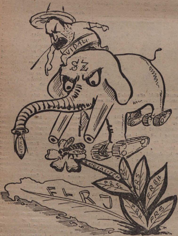
SZ IN VIDALI: Poglejte jo, kako se pripravlja na napad na naše mirno ljubne sile...