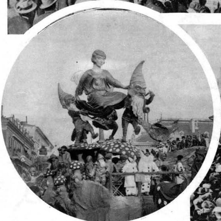
Prizor 13 lanskega karnevala v Nici

Zgoraj: Eden največjih in najlepših dandanašnjih karnevalov se vrši vsako leto v Pasadeni (Kalifornija).