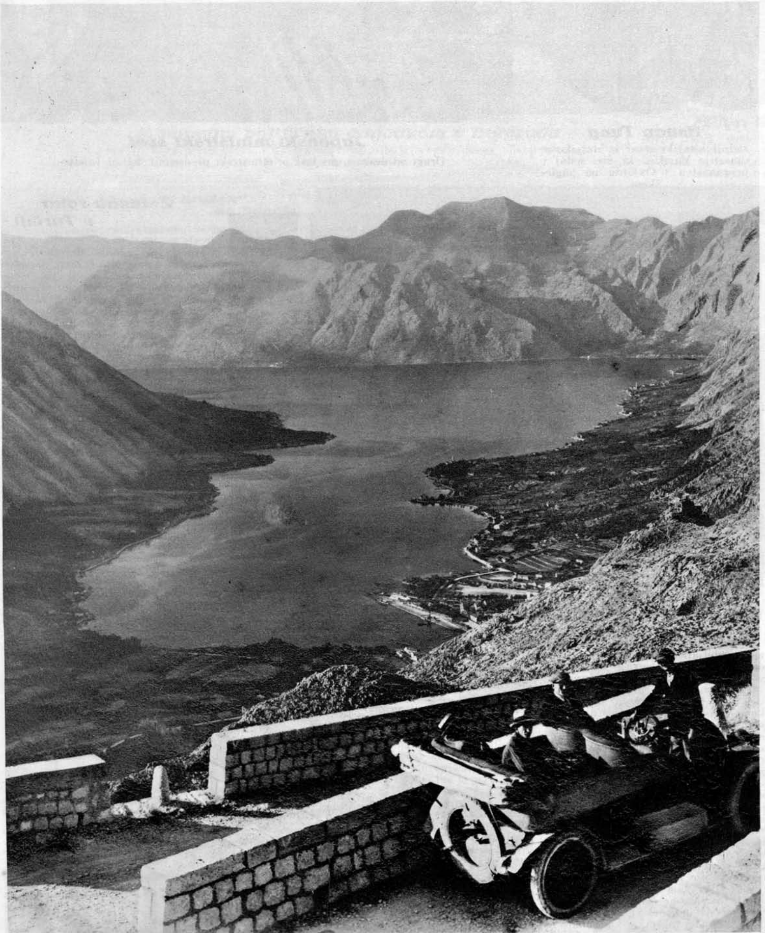
Pogled na Boko Kotorsko s ceste, ki vodi iz Kotora na Lovčen

Nekateri smatrajo ta pogled za najlepšega v Evropi; kakor znano je Boka tudi sedež naše vojne mornarice.