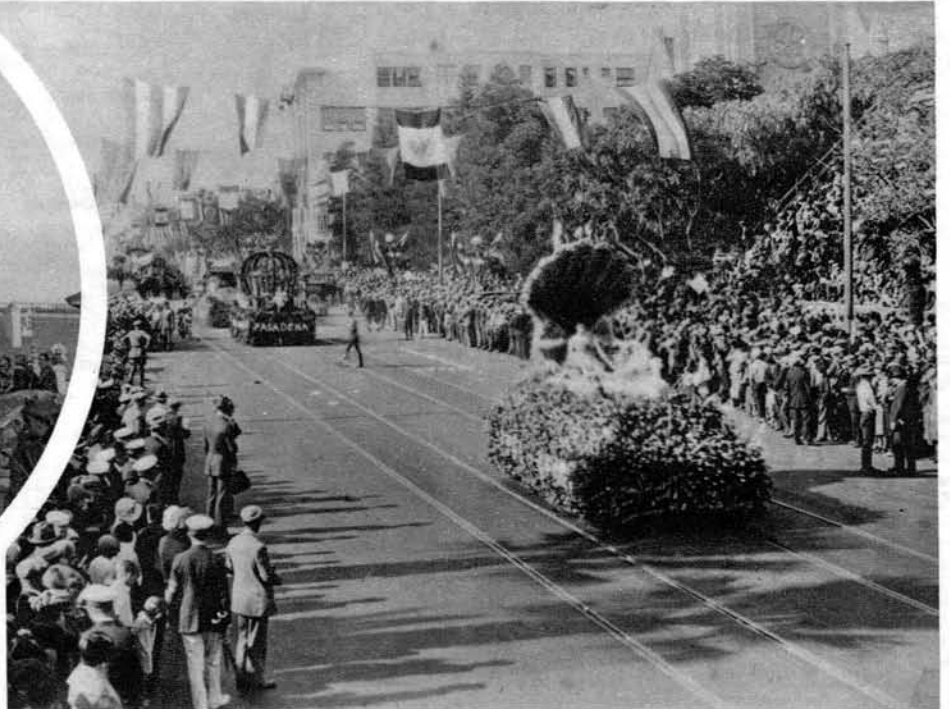
S karnevala v Viareggio (Italija)

Zgoraj: Eden največjih in najlepših dandanašnjih karnevalov se vrši vsako leto v Pasadeni (Kalifornija).