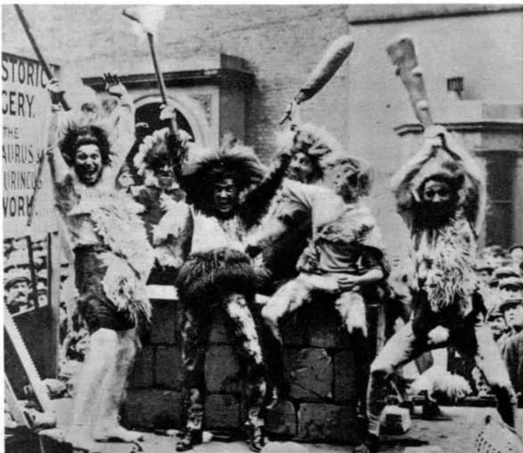
Celo resni Angleži ponore v predpustu

Tamošnji karnevali so še danes med najprivlačnejšimi v Italiji.