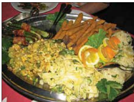
Ob pogledu na ploščo različnih špargljevih jedi se slina kar pocedi.

čanje vode in čistijo ledvice, zato je dobro, da po njih posegajo ledvični bolniki in tisti s povišanim krvnim pritiskom.