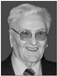
Piše: Aleksander Videčnik

V letih 1996 do 1998 sem zbiral razna ustna in pisna izročila o naši dolini. Naletel sem na izredno vsebinsko pestrost, saj so na eni strani pripovedi o strahovih, na drugi spev o gradovih, ki so bili strah in trepet podložnikov, in ne nazadnje tudi razna vraževerja in znaki, ki so kazali na kakšno smrt, ko so rekli, »da je dalo cahn«. Vse to sem zbral v knjigi Zgornjesavinjske vistorije, ki je izšla leta 1998. Mislim, da ne bo nič narobe, če naši spoštovani bralci spev malo osvežijo spomin na pripovedovanja svojih prednikov, ki se morajo zavedati, da vsa ljudstva tega sveta poznajo razna verovanja, vraže in legende v zvezi s posameznimi pojavi v nekdanjih graščinah ali pa tudi v naravi. Za grajske prebivalce pač niso imeli dobre besede.