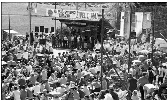
Množični prvomajski shod na Graški Gori