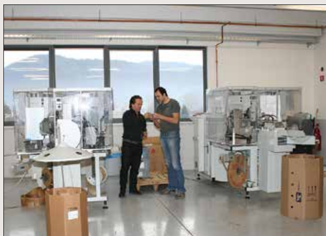
Sodobna oprema omogoča optimalno proizvodnjo.

večdesetih letih prejšnjega stoletja, so se preselili v hišo, kjer so zagotovili okoli 100 kvadratnih metrov za delavnico oziroma poslovne prostore. Do leta 2007 se je proizvodnja toliko povečala, da so morali najeti dodatne prostore, in sicer v Mozirju in skladišče na Rečici ob Savinji.