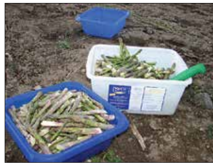
Sveže nabrani šparglji so še isti dan postreženi gostom ŠC Prodnik.

leg zelenjave obožujejo še meso, lahko odlični kuharji v ŠC Prodnik pripravijo sočen zrezek z gorgonzolo in šparglji, vsekakor pa vedno radi prisluhnejo željam svojih gostov in jim tako ustrezajo v največji možni meri.