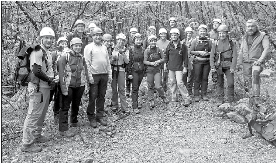
Izleta v organizaciji rečiškega planinskega društva se je udeležilo 23 planincev.

Skupina Obruč pripada globokemu krasu. Območje najvišjih vrhov predstavlja nepravilen labirint raztrganih apnenčastih sten, na sredini katerih se nahaja divje Pakleno. Na zahodu in jugu se strmo spušča proti Grobniškemu polju. Z roba planine je lep pogled na Reški zaliv in istrske planine. Hahlički s svojim najvišjim vrhom Obručom (Grobniške Alpe) spadajo med planine Reškega zaledja in pripadajo hrvaškemu primorju ter se nahajajo na robu Gorskega Kotorja. Večina vrhov je meja, tako da ena stran pripada Gorskemu Kotorju, a druga hrvaškemu primorju. Posebnost je odličen razgled na morje, Kvarnersko otočje, vse tja do Učke. Zaradi apnenčaste sestave je povsem brez vode. Zanimiva je flora, ker je tu meja med mediteranskim in kontinentalnim območjem.