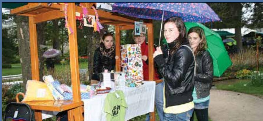
Na stojnici v Gaju so »lučke« predstavile delo društva.