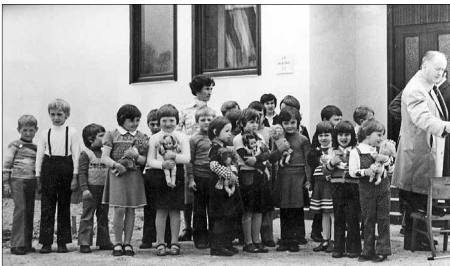
Prva generacija otrok v nazarskem vrtcu na otvoritveni slovesnosti leta 1977