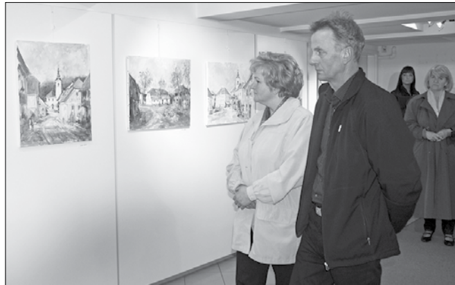
Likovna dela z utrinki Mozirja si je ogledalo veliko število obiskovalcev.