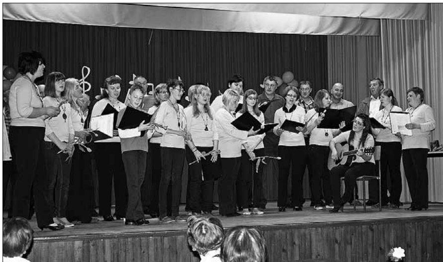
Ob zaključku koncerta so kot mešani pevski zbor zapeli radmirski pevci in pevke.