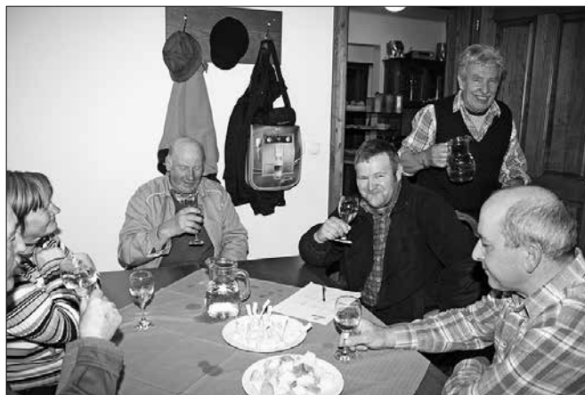
Komisije so ocenjevale več kot 40 vzorcev tolkca.