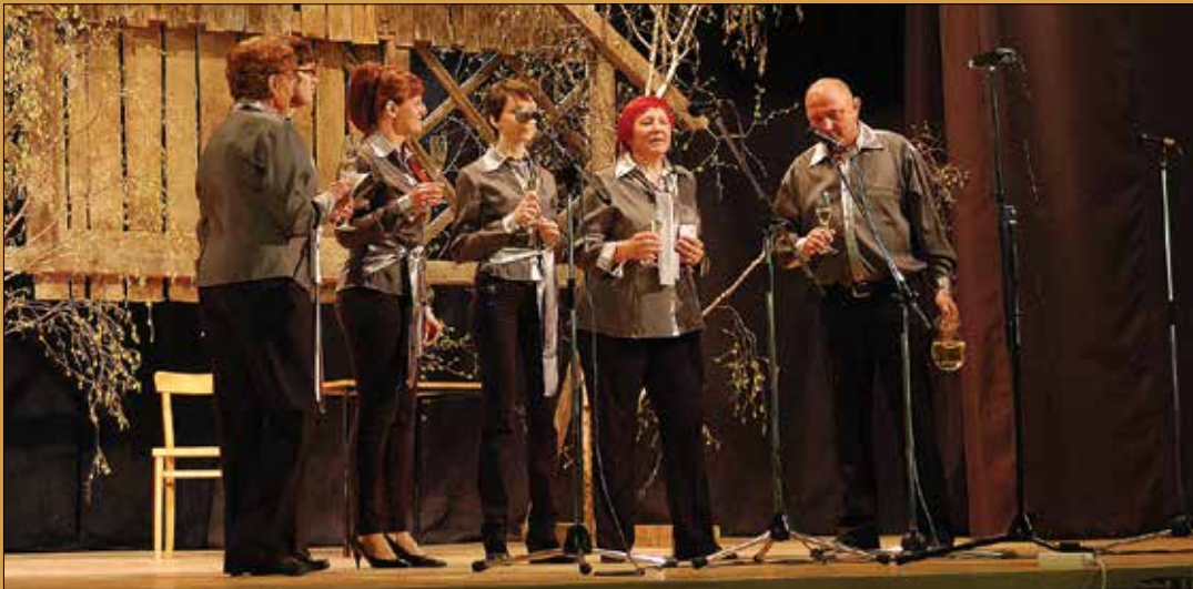
Letošnja rdeča nit prireditve so bile napičnice.