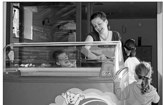
Otroci so bili zaradi poletnih temperatur navdušeni nad ponudbo sladoleda.