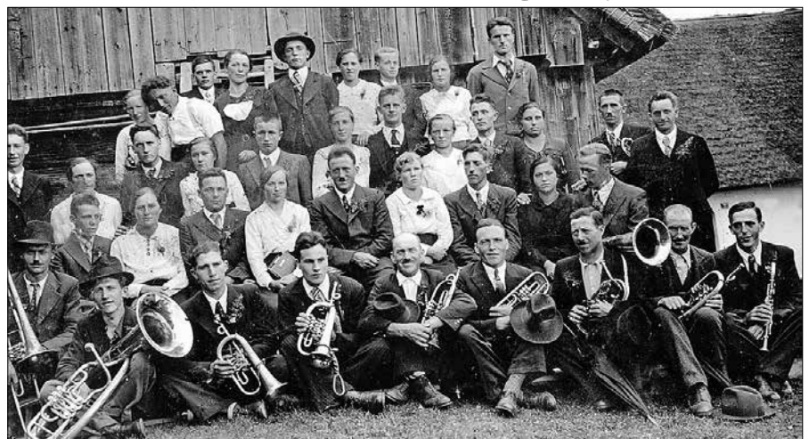
Leta 1942 so vaščani v Semprimožu blizu cerkve praznovali lepo nedeljo, hkrati pa so se poslovili od fantov, ki so morali kmalu zatem oditi v nemško vojsko.