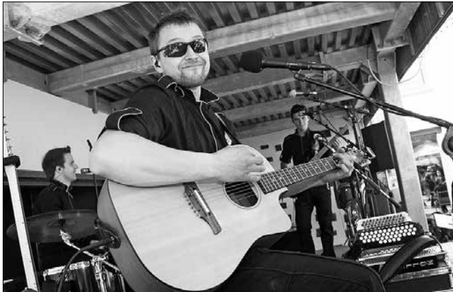
Zabavni prireditvi so dajali ton muzikantje ansambla Golte.