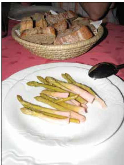
Vloženi šparglji kot okusna hladna predjed.

Že pred stoletji so bili šparglji poznani predvsem kot zdravilna rastlina, saj so bogat vir vitaminov in mineralnih snovi. Pomembni v prehrani so zaradi vsebnosti glutaciona, ki je pomemben v boju organizma proti raku, so tudi lahko prebavljivi in zaradi nizke vsebnosti ogljikovih hidratov in maščob priporočljivi v prehrani ljudi, ki imajo v krvi veliko maščob. Šparglji pospešujejo izlo-