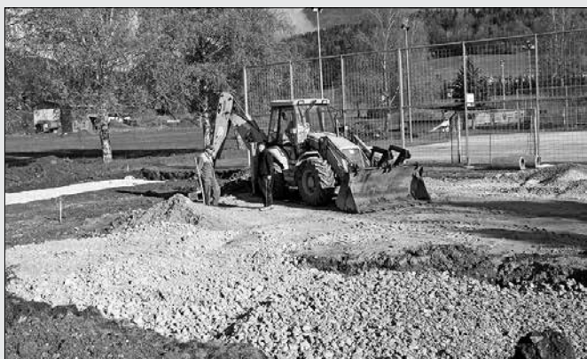
Dela na igrišču za odbojko na mivki