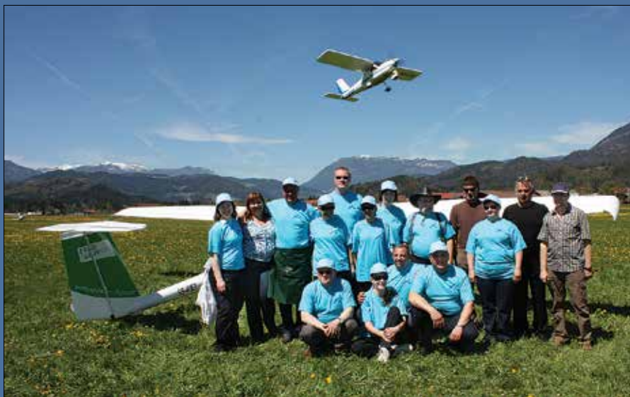
Spominska fotografija z ekipo, ki je poskrbela za nemoten sprejem svetovnega popotnika.