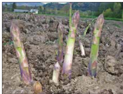
Že v aprilu na plan pogledajo prvi poganjki špargljev.

Tudi ocvrti šparglji so nekaj posebnega, nikakor ne gre zanemariti niti kulinarične klasike, šparglje s hrustljivo popečeno slanino, ki so odlična priloga različnim jedem. Za tiste, ki po-