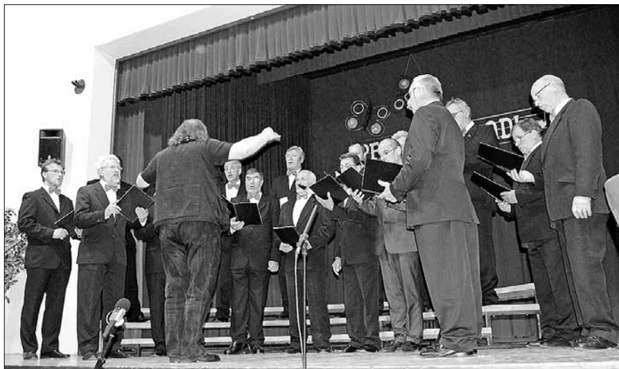
Kamniški pevci nadaljujejo bogato 130-letno tradicijo zborovskega petja.