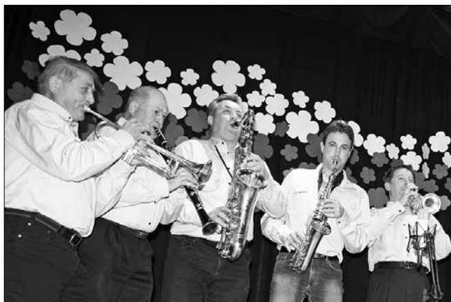
Suška banda je obiskovalcem zaigrala nekaj partizanskih in narodnih napevov.