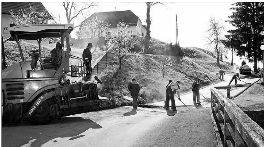
Z ureditvijo ceste in asfaltiranjem so zaključili prvo fazo kanalizacije v Podteru.