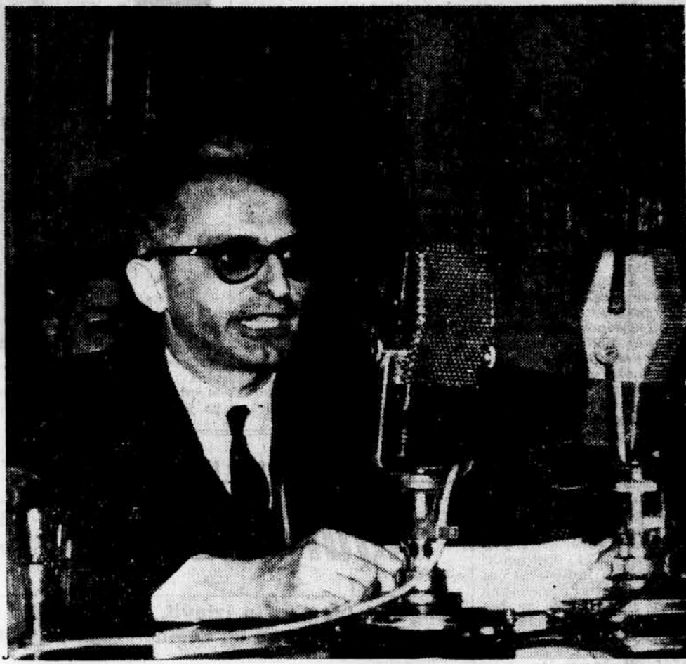
FRONDIZI, REVOLUCIJA IN PETROLEJ. - Mornariški oddelki so odpeljali predsednika Frondizija republike Frondizija na otok v La Plati, potem ko je zavrnil ultimatum...