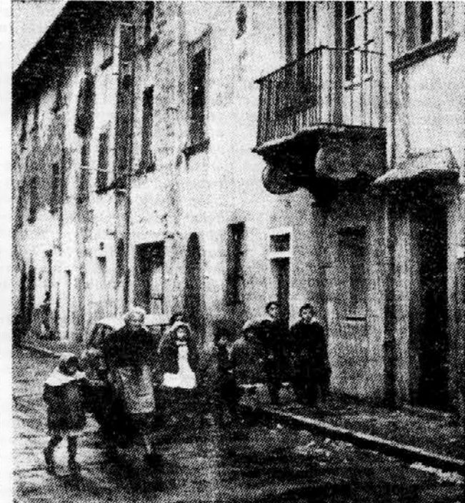
OTROCI GREDO V SOLO. — Skupina otrok na poti v šolo v južnitalijanskem podeželskem mestecu.