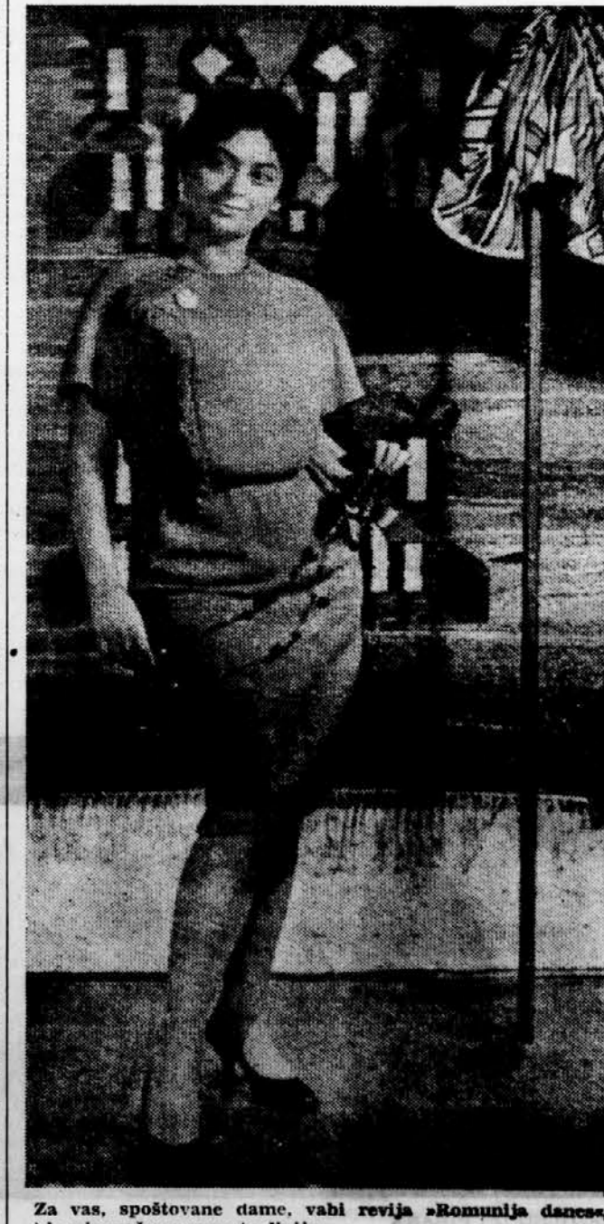
Za vas, spoštovane dame, vahi revija »Romunija dance«, ki priporočila preprosto linijo.

Obiski pripisujejo zdaj lahki industriji več pozornosti. Lani so ustanovili tudi posebno ministrstvo za lahko industrijo. Če bi primerjal izložbe buktareških in priporočila preprosto linijo.