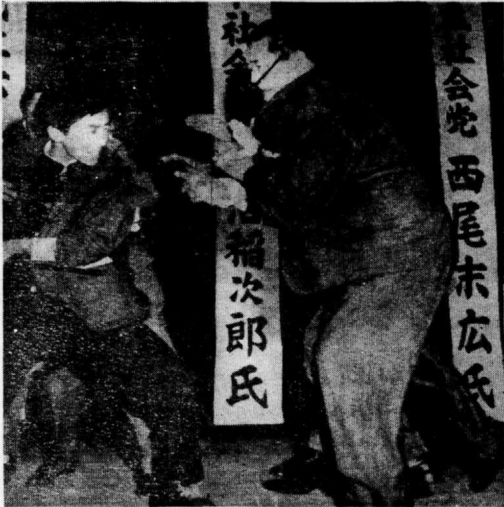
Leta 1960 je desničarski terorist in fanatik za bodel Inedžira Asanuma, voditelja Socialistične stranke Japonske. Na sliki: mladi fanatik Jamaguči se pripravlja, da že drugič zabode Asanuma, ki je kmalu potem med operacijo v bolnišnici umrl. Zločin se je zgodil med velikim političnim zborovanjem v Tokiu. Žrtvi desničarskega terorja sta bila med drugim tudi sedanj predsednik Socialistične stranke Kavakami in bivši premier Kiši. Oba sta okrevala.