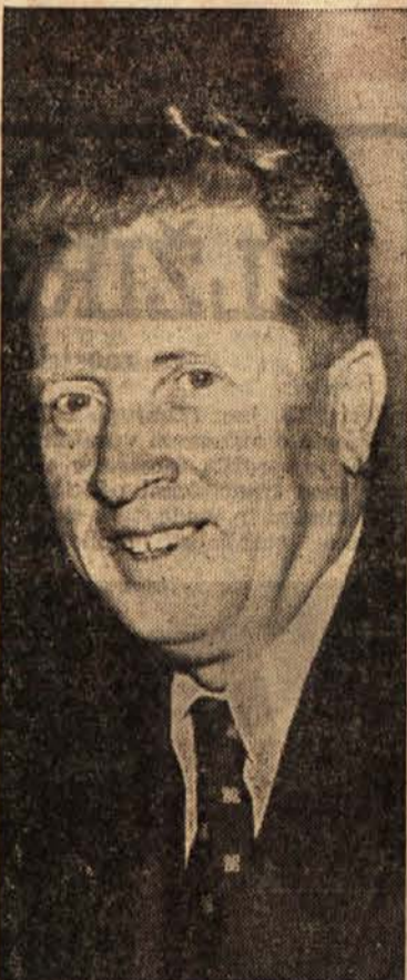
Miha Marinko, predsednik Ljudske skupščine LRS.