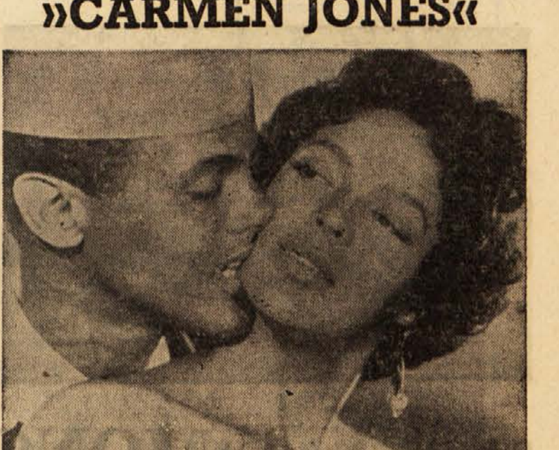
Predstava ob 15, 17, 19 in 21. V glavni vlogi Dorothy Dandridge in Hary Belafonte. Prodaja vstopnic od 9.30 do 11 ter od 14 dalje.