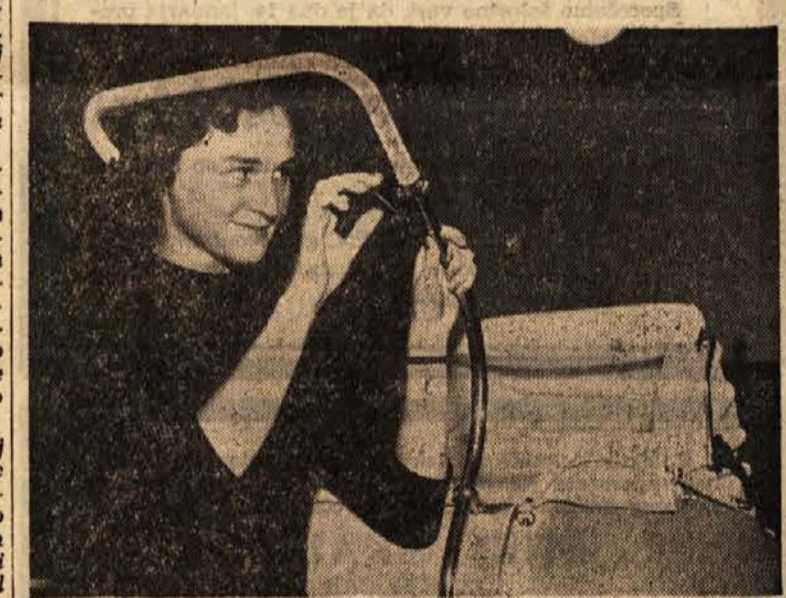
OTROŠKI VOZIČEK Z ROČNO ZAVORO

ljubljamu vam, da vas bodo zdravili najboljši psihiatri.« Pisma, ki jih blaznež z bombami pošilja listom, ga odkrivajo kot v lastno osebnost do skrajnosti zaverovane človeka. Priznani zdravnik meni, da je bilo zadnja leta toliko govora o atomskih in vodikovih bombah, da so psihopatu odpovedali občutljivi živci in možgani. Vsekakor pa je človeku z bombami uspelo napraviti preplah med osem newyorškim prebivalstvom, zaradi česar je razvila vsa newyorška policija mrzlično dejavnost.