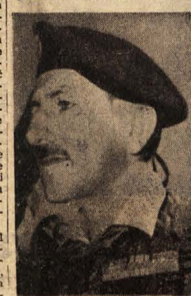
Francoski general Massu, ki je odgovoren »za red« v Alžiru

Pariz, 15. jan. (Tanjug). Blížnja debata o alžirskem vprašanju v OZN je sprožila zaostritev odnosov med francoskimi političnimi strankami in vlado, tako da je ogrožena stabilnost Molletove