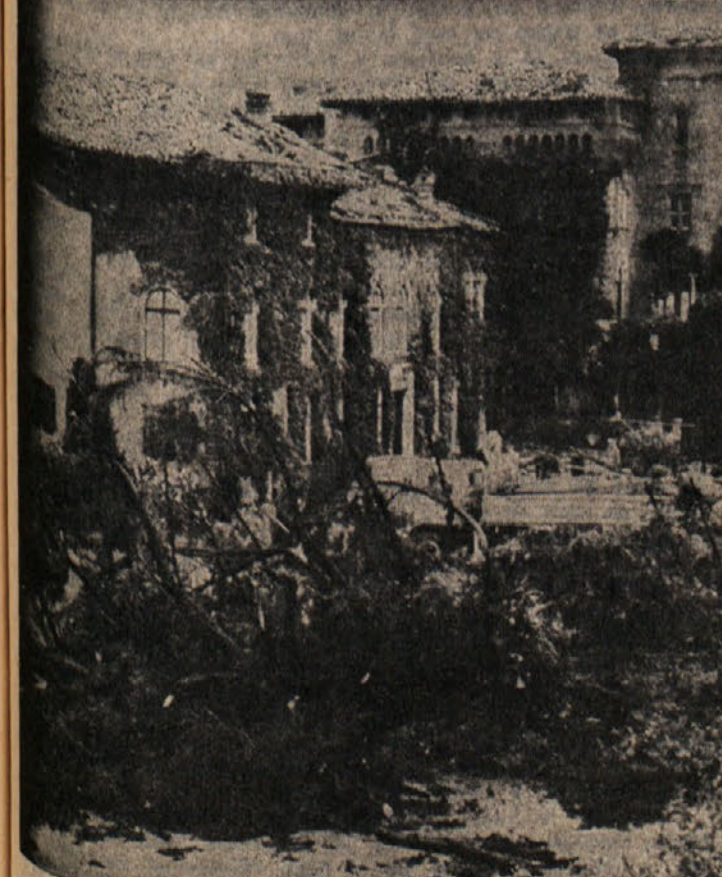
Grad grofa Santarose v Spessi pri Koprivi. Park okrog njega je bil popolnoma uničen

V Ronkah so oddali dela za prvi etapni glavne kanalizacije, za katera bodo porabili 95 milijonov lir; v septembru nameravajo oddati tudi drugi etapni za 30 milijonov lir. Pri obeh etapah bo občina deležna deželnega prispeva.