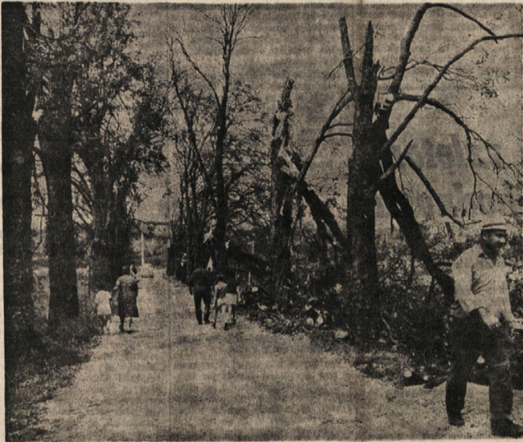
Razdejanje ob cesti pri Koprivi

Sedaj v ZDA že razpravljajo, za koliko se bo jen dejansko ovrednotil.