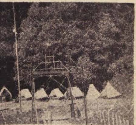
skratka vse, ki bi radi pomnožili vrste tabornikov. Skupščina bo ob 10. uri v zbornični dvorani ljubljanske univerze.

V nedeljo 22. t. m. bo ustanovna skupščina taborniške organizacije, ki vabi v svojo sredo vsakogar, kdor se zanima za življenje in vzgojo v naravi, predvsem mladino, blivše gozdovalnike in skavte,