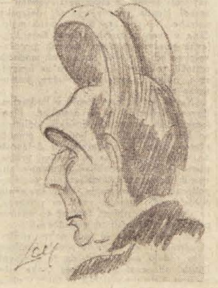
Ferdo Kozak v karikaturi neznanega risarja

»Imam načrte. Kako jih bom izvršil, ne vem. Prvotno dramo »Lepa Vida« sem po vojni za knjižno izdajo predelal in ji dal naslov »Vida Grantova«. Dasi teme-