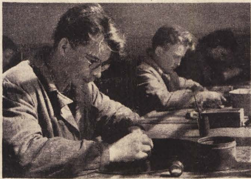
Učenci pri ročnem brušenju leč

Izdelovali pa bodo ali že izdelujejo: za široko potrošnjo med drugim gledališke daljnogledje; izdelali so prvih pet daljnogledov; predvsem imajo v načrtu izdelavo leč za navadne luppe, predvsem za industrijske obrate pa tudi za šole, za botanike, vrtnarje itd.; dalje leče za manjše mikroskope, ki jih bodo uporabljali v šolah itd. Prvi naš mikroskop bo imel lečo za 180-kratno povečavo. Izdelujejo pa tudi prototipe za projektorje.