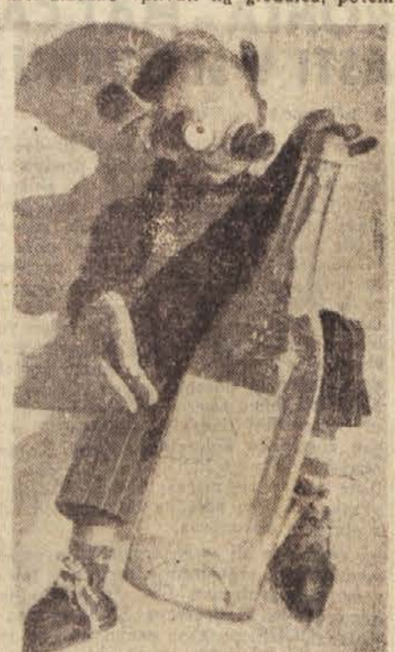
Titularni svetnik, lutka Sergeja obrazcov iz leta 1927

mo, kar je njihova nujna lastnost: njihova neizmerna gledališka izrazitost in zmožnost, da zgrabijo in gledalca prevzamejo. To je najpoglavnejše in edino važno. In če je tako, če so lutke v resnici zmogljive vplivati na gledalca, potem