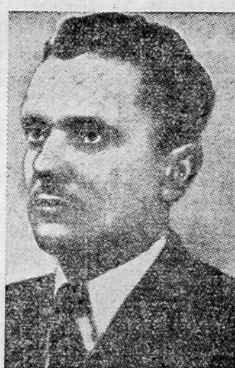
Tovariš Tito leta 1933

Delaš, delaš, zbiraj ljudi, ustvari organizacijo, naenkrat pa pridejo policijski vpadi, ki vse odnesejo. Na policiji tovaršev mučijo, zatem jih obsodijo v ječo, iz nekolično članov, ki so preživeli vdor, pa ustvarjajo zopet organizacijo. Zopet iste težave, iste nepravilnosti. Kljub temu izkušnja smo se težko odrekli šablonom... Ta član CK nam je govoril o novih izkušnjah, ne da jih je razbijal na drobce. Govoril mi je, kako naj izbiramo za Partijo ljudi po novem kriteriju, ljudi iz tovarn, delavnic, iz šol, v kateri uživajo ti ljudje veliko zaupanje zaradi svojega osebnega ugleda, ni pa se treba držati samo ozkega kroga že znanih ljudi. Tako nam je ta član CK postavil na ravno velike, toda ustvarljive naloge, če se zastavimo potrebni napori. Govoril mi je še pri odhodu, kako se bo CK preselil v državo, bo direktno v stiku z množicami. Rekel mi je še, da bi bilo potrebno ustanoviti vodstvo