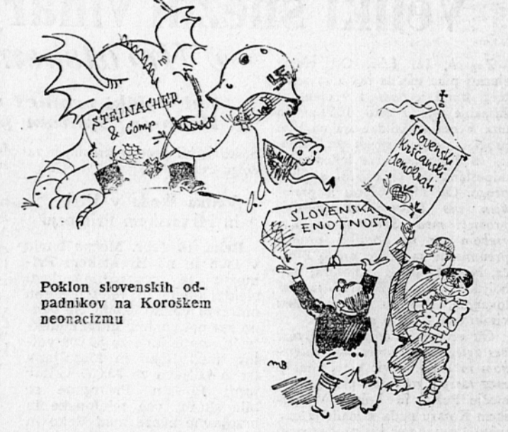
Poklon slovenskih odpadnikov na Koroskem neonacizmu

Dr. Adenauerja francoski predlogi dopolnilnih protokolov in pogodba o evropski obrambni skupnosti nesprejemljivi v njihovi sedanjih obliki. Skrb zaradi nevarnosti novih poplav na Holandskem in v Angliji Haag, 16. febr. Ob današnji plimi so pričakovali novih poplav. Plima je bila nižja, kot so pričakovali, in tudi ni bilo vetra, tako da so nasipi vzdržali pritisk. Popolne je bilo izredno stanje v ogroženih področjih preklicano. Jurji bodo ogrožena področja zapustili vojaški oddelki, ki so sedaj varovali nasipe. Na ogroženih mestih je bilo 20.000 holandskih in 6000 zaveznih vojakov. Tudi v vzhodni Angliji današnja plima ni povzročila nove škode. Na otoku Canvey je bilo v pripravljenosti 1200 vojakov in delavcev. Za jurji pričakujejo nove nevarnosti.