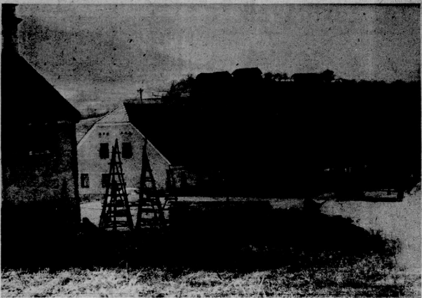
NA SLOMU BO CVETEL TURIZEM - Na Sloomu pri Ponikvi so pred dnevi v hiši na levi strani odprli spominsko sobo slovenskega prosvetitelja A. M. Slomška. Ker je v istem okolju obrat kmetijskega kombinata Sentjur z velikimi nasadi dobrih jabolk, lepa in privlačna pokrajina, dobro vino in zanimiv kulturni objekt, ljudje na Sloomu upravičeno pričakujejo, da jih bo v naslednjih letih obiskalo še več ljudi, kot zadnja leta.