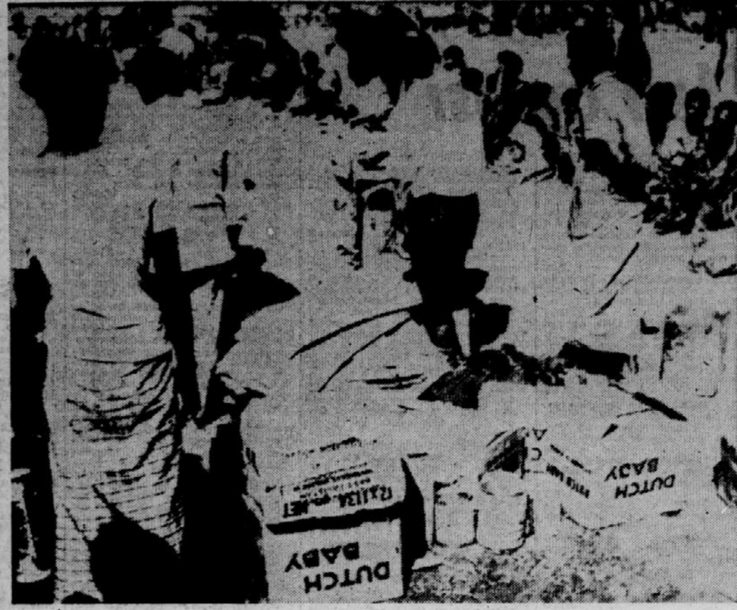
POMOČ RDEČEGA KRIŽA — Poziv za pomoč, ki ga je naslovil na vse organizacije Mednarodni rdeči križ, je naletel na širok odmev v svetu. Na sliki vidimo ekipo rdečega križa, ki deli zdravila in mleko ponesrečencem iz Vzhodnega Pakistana. Srečevala je ta pomoč samo kaplja v morju spriču razsežnosti katastrofe, ki se je zgodila nad ljudi v Bengalskem zalivu.