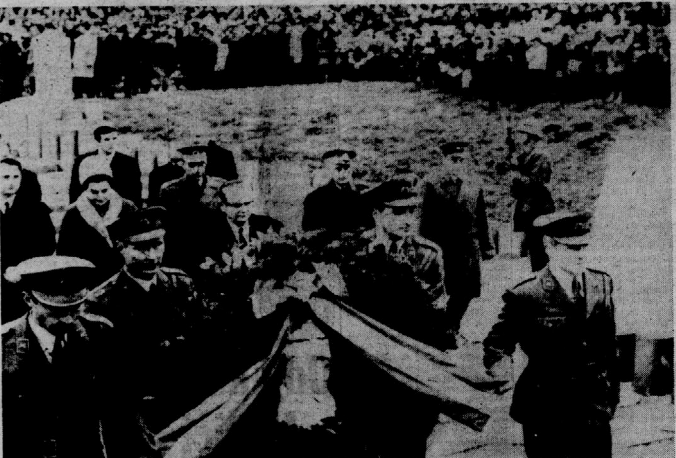
POČASTITVEV ŽRTEV NACIZMA — Predsednik republike Tito je položil večeraj venec k spomeniku ustreljenim domoljubom v spominskem parku v Kragujevcu.