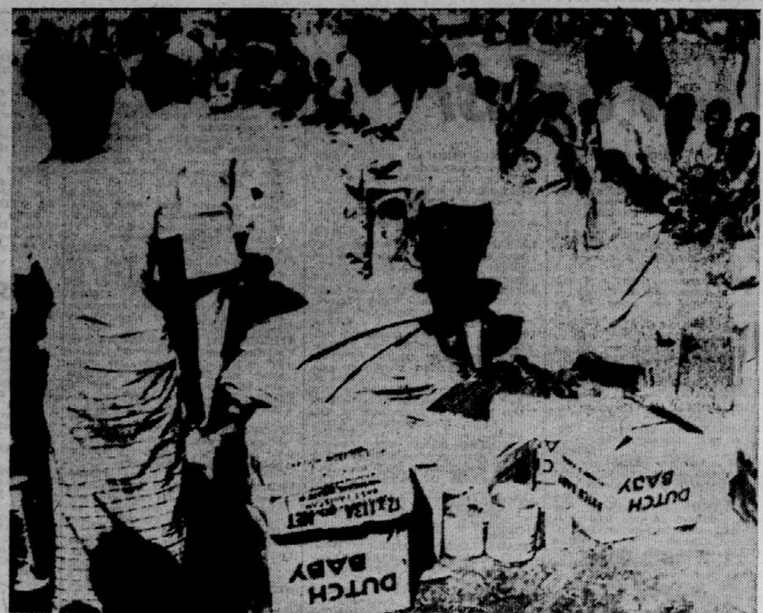
POMOČ RDEČEGA KRIZA — Poziv za pomoč, ki ga je nastovil na vse organizacije Mednarodni rdeči križ, je naletel na širok odmev v svetu. Na sliki vidimo ekipo rdečega križa, ki deli zdravila in mleko ponesrečencem iz Vzhodnega Pakistana. Seveda je ta pomoč samo kaplja v morju spričo razsežnosti katastrofe, ki se je zgrnila nad ljudi v Bengalskem zalivu.