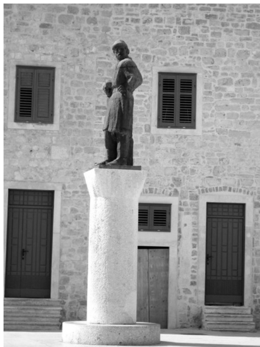
Ivan Meštrović, Spomenik J. Dalmatincu

vodo, ki ga držita s krili plahutajoča renesančna putta.