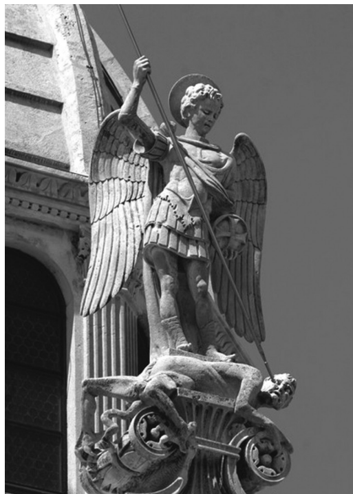
Kip sv. Jurija

Jurij Dalmatinec je že ob prihodu opazil pomanjkljivosti pri že obstoječih stenah šibeniške katedrale, ter jih popravil. Z meščani se je dogovoril, da je katedralo potrebno podaljšati in tako je dobil dovoljenje, da podre dve rektorski pisarni ter stojnice ob cerkvi, kar mu je omogočilo dvig stranskega