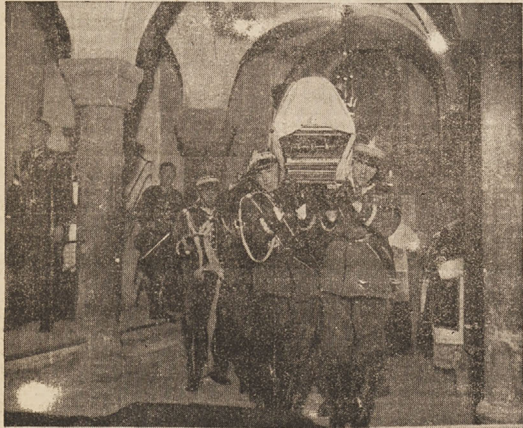
Poslednji akt pogrebnih svečanosti maršala Pilsudskega.

vplivov, ampak je odvisna tudi od nekega notranjega ponovkovanja (ritma), ki je čisto neodvisen od zunanjih dogodkov. Tega notranjega ponovkovanja sicer ne moremo izpremeniti, lahko pa to gibanje preračunamo že vnaprej kakor kroženje zvezd. To ponovkovanje v naši notranjo-