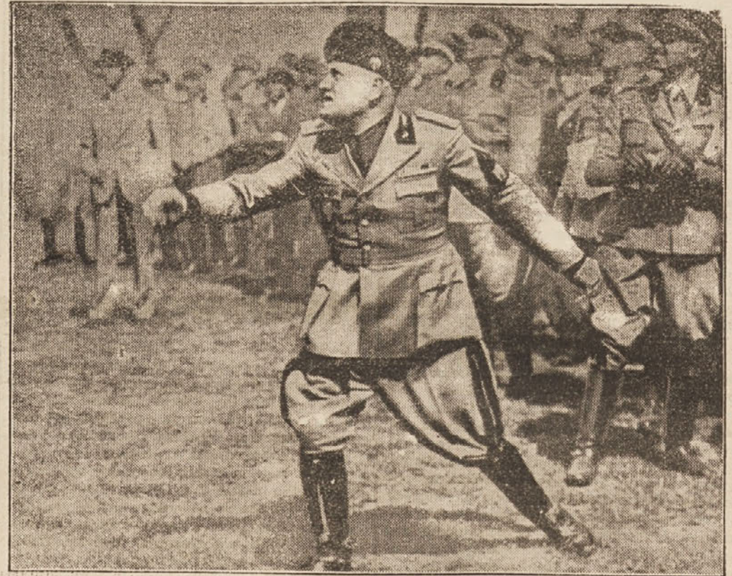
Mussolini kot vojaški instruktor.

V gradu Wawelu v Krakovu so položili k večnemu počitku prvega poljskega maršala. Poljski generali nesejo krsto v kripto.