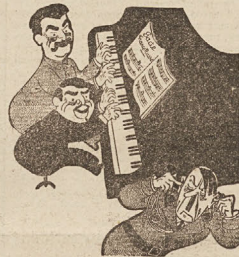
Hitlerja bole ušesa ...

vičnosti, torej sporazum in razorožitev vseh držav. To je ideja kolektivne varnosti. Nemčija jo je iskreno pozdravila, toda versajski mirovni diktat je tej zamisli zadal smrtni udarec. Hitler preide nato na kritiko versajskega mira. Poudarja, da je Nemčija strogo izpolnjevala svoje obveznosti. Nemčija je vse svoje orožje uničila, nasprotniki pa tega niso storili. To velja