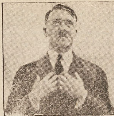
Hitler je spregovoril

Mesečna naročnina 20 Din, za inozemstvo 35 Din. Uredništvo: Ljubljana, Gregorčičeva ul. 23. Tel.: 2566, int. 3069