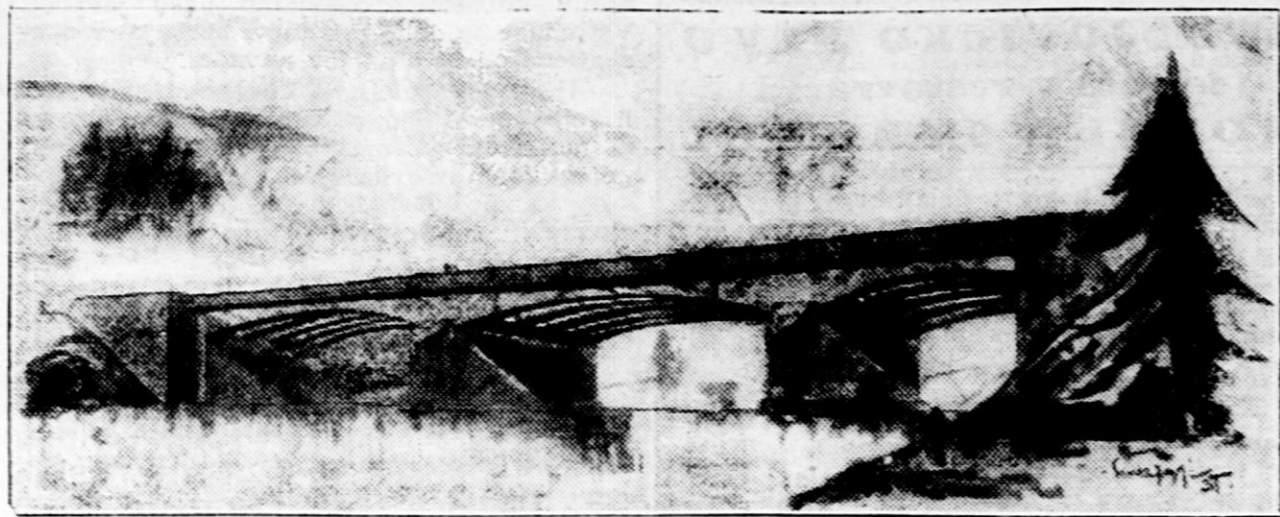
Bohinj, 7. maja.

Prvi med Bohinjsko Belo in Sotesko, drugi pa med Sotesko in Nomnjem