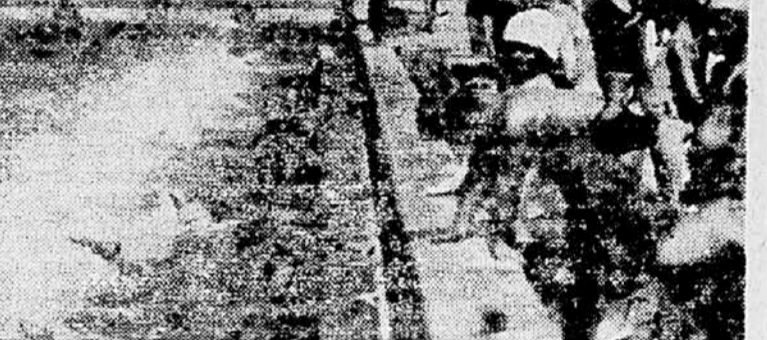
Plavalna šola Ilirije začne s svojim drugim tečajem v ponedeljek, 16. t. m. Vpisovanje v šolo je vsak dan od 11. do 12. in od 17. do 18. ure na kopališču Ilirije...