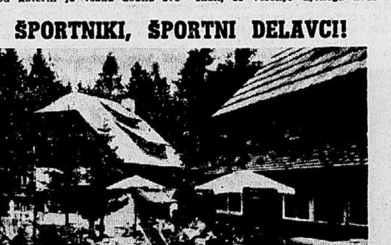
Planica (1000 m n. m.) je romantična gorska dolina na skrajnem severozahodnem gorskem kotu Slovenije. Tu ima športna zveza Slovenije svoj 'DOM', ki leži na vzhodu v to dolino, sredi smrekovega gozda...