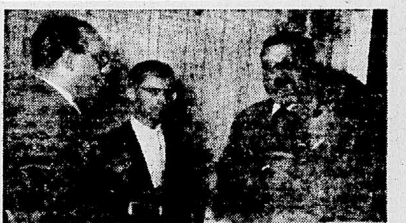
Naše uredništvo je večeraj popoldne pripravilo sprejem za delegacijo italijanskih novinarjev, ki je od torka popoldne na obisku v Sloveniji. Poleg gostov in slovenskih novinarjev so se sprejema udeležili tudi predstavniki kulturnega življenja. Sprejem je potekal v prijateljskem razgovoru o raznih problemih obeh sosednjih držav. Italijanski novinarji so si v sredo dopoldne ogledali tovarno »Litostroj«, kjer so se razgovarjali tudi s člani upravnega sveta podjetja. Zanimali so se za delavsko upravljanje in za proizvodnjo tovarne. Po obisku tovarne so bili na okrajnem ljudskem odboru Ljubljane, kjer jim je podpredsednik OLO Ljubljane tolažnji sistem naše uprave in komunalnega poslovanja. Popoldne so obiskali Narodno in Modernogledjo, zvečer pa balno predstavo v operi. Večeraj so bili na Gorenjskem na grobu talcev v Dravju. V Predsednijski palači na Vrhu in na Bledu. Delegacija bo danes dopoldne odpotovala v Zagreb.

Razprava je pokazala, da se mora kot podlaga vzeti edinele Marxova metoda, ki jo je treba prilagajevati pogojem proizvodnje in gospodarsko-političnim smotrom Jugoslavije kot socialistične države. Proučevanja so pokazala, da se druge tuje metode ne morejo izkoristiti v celoti. To pa ne pomeni, da se Jugoslaviji v nadaljnjem razvoju ni treba posluževati uspehov, ki jih je dosegla znanost bodisi v zahodnih bodisi v vzhodnih državah.