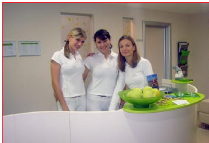
Plačana oglasna vsebina

Ultrazvok je naprava, ki deluje s frekvenco 400 kHz, kar omogoča najboljšo učinkovitost brez po-