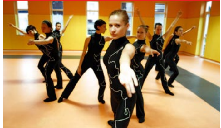
Utrinek iz plesne predstave Jigsaw

Jazz plesna sekcija se lahko pohvali tudi s tremi avtorskimi projekti Božene Krivec: celovečernimi plesnimi predstavami V pravljici leta 2004, Biti leta 2006 in letošnji plesni projekt Jigsaw, ki se je odplesal v petek,