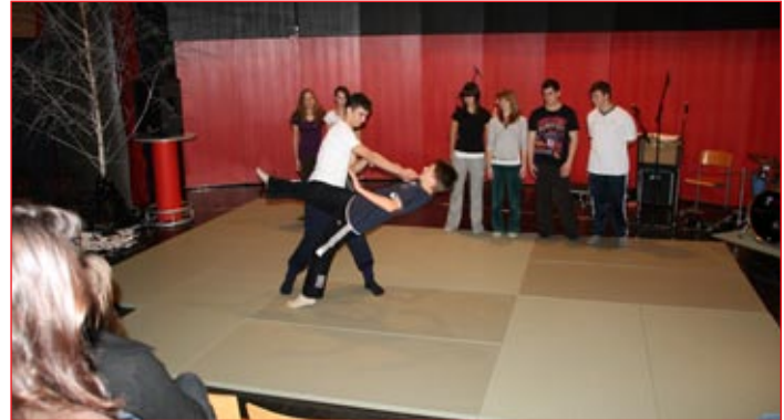
Dijaki prvih letnikov so se učili osnov borilne veščine karate.