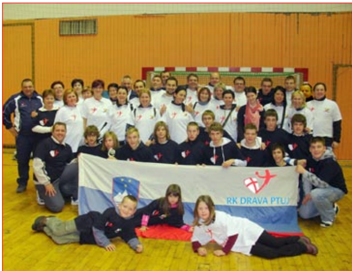
Ptujška ekipa rokometarjev in njihovih navijačev na turnirju Zvezde '08 v Beogradu

si jih nadene, saj bi sicer zaradi vztrajnega bobnanja dobil še žulje. Raglje, megafone in kar je še navijaških rekvizitov, je slišati že pred začetkom tekme, s svojim navijanjem, ki je v dvorani prebudilo tudi ostale gledalce, da so s Ptujčani neustrahovano navijali za svoje fante. »Kdor ne skače ni Slovenc, je ena od naših stalnic na mednarodnih tekmah. Tej dodamo še tisto: Dajte, dajte gol. Ko nam športna sreča obrača hrbet, naše fante bodrimo z vzklikanjem Drži obrambo! Včasih, ko je treba, navijamo z golj za strelca sedemmetrovk, pa za vratarja oziroma golmana,« so pojasnjevale mame, ki so po drugem dnevu turnirja počasi ostajale brez glasov, a na tekmah še vedno zmogle »navijati na ves glas« in vihteti slovensko zastavo, ki se je v dneh rokomet-