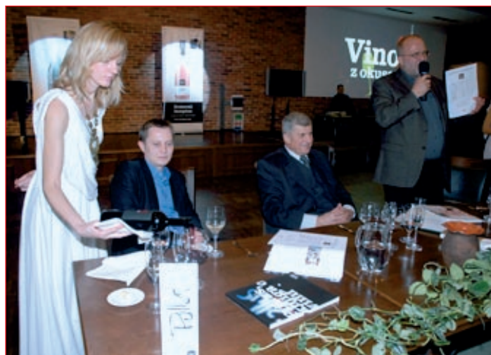
Na tradicionalnih vinskih zgodbah so ptujski vinarji predstavili novosti v Ptujski kleti. (na fotografiji) Terme Ptuj izdajajo vsake tri mesece katalog storitev, v katerem lahko najdete zanimive storitve in aktivnosti, ki vam jih ponujajo.