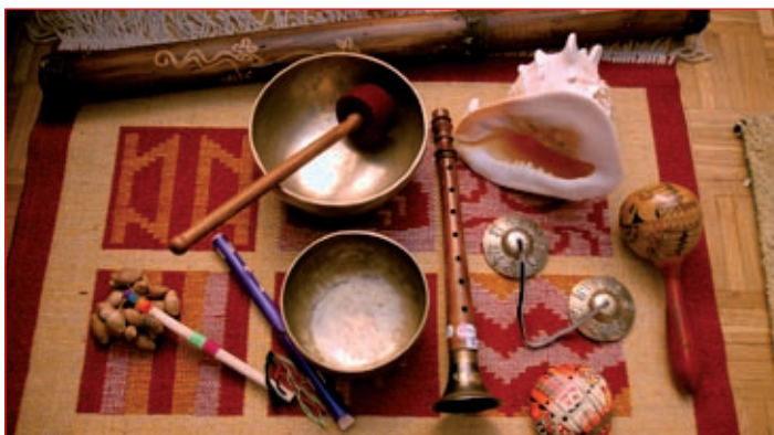
Perujski plodovi, frulica, tibetanske posode, indijska flavta, piščal, tingše, školjka in palica dežja iz Indonezije

Izvaja jih človek, ki ni zdravilec ali čarovnik, ampak umetnik, ki z uporabo gonga deluje na človekov energetski tok. Vibracija pa prodira v vsako celico telesa. Torej zdravi močna energija, ki jo proizvaja gong. Če primaknemo dlani k vibrirajočemu gongu, bomo občutili njegovo silno energijo s celotnim telesom. Igralec gonga je kreator izvedbe. Kvaliteta izražanja je odvisna od njegove osebnosti, od njegovega pristopa k igranju, od spoznanj in izkušenj ter od duhovnega razvoja in stanja zavesti.