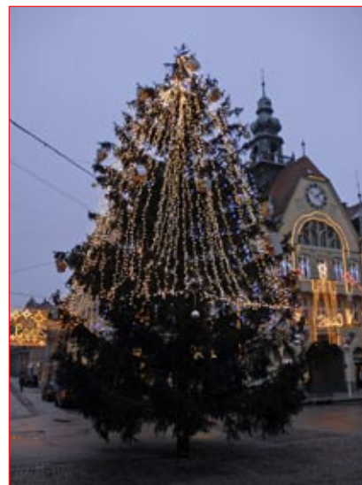
Tale veličastna božično-novoletna smreka se tako lepo poda v ambient starega Mestnega trga, da bi si človek zaželel, da bi kar celo leto ostala ali celo rasla na tem mestu, seveda brez okrasov.

Delavci Komunalnega podjetja Ptuj so deset metrov visoko smre-