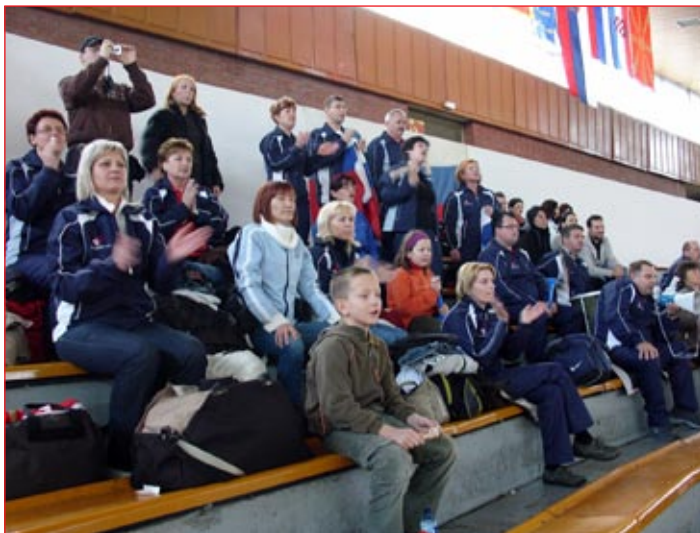
Tudi neumorni navijači so izredno lepo predstavljali ptujski rokomet in slovenski šport.

se našli tudi starši, ki jih zdaj spremljamo na domala vsaki tekmi. Pa naj bo to velik in mednarodno odmeven turnir, kot je ta v Beogradu, ali neka, za nekoga morda nepomembna tekma kje v bližini Ptujja. Mi gremo z našimi rokometarji, navijamo zanje in se z njimi veselimo, pa tudi žalostimo ob kakšni bolj slabo odigrani tekmi,« so že med potjo v Beograd pripovedovale mame. Očetje pa so potem svoje »pu-bece« pred vsako tekmo krepko stisnili, da bodo vedeli, kako radi jih imajo in kako verjamejo vanje »njihovi ta stari«.