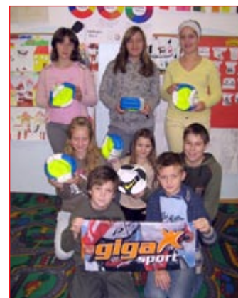
Žoge za vrstnike v Malaviju