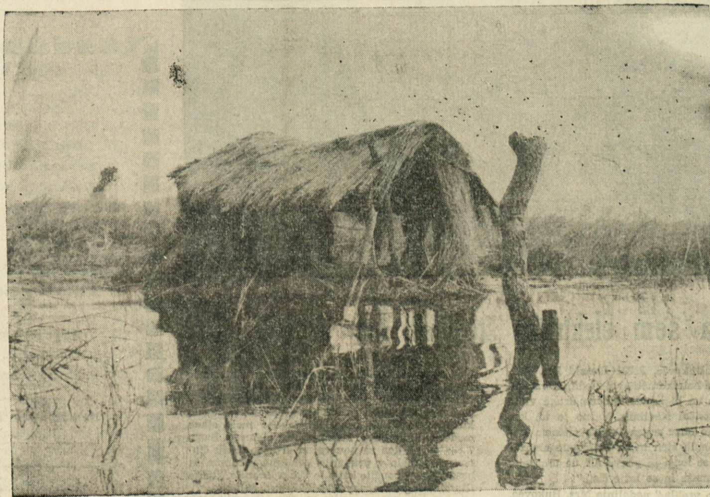
CIGAV DOM? — Ljudsko štetje je težka naloga še v civiliziranih deželah, veliko težavnejše je v divjini, kot so predeli v Severni Rodeziji v Afriki. Na sliki vidimo neke vrste bivališče na robu močvirja Lukanga, kjer žive primitivni in skrajno neprijazni ribiči. Popisovalec mora seveda tudi v to neprijazno bivališče, če hoče svoj posel dobro opraviti.

Televižen Zenith tkzv. Spacecommand 400, cena $200. Telefon LI 1-4059 po 7. uri zvečer. (196)