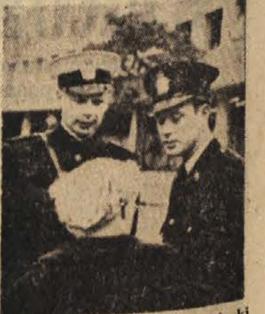
Norveški prometni stražniki, ki veljajo ne samo za dosledno pravične, marveč tudi izredno vpludne varuhe cestnega reda, so vsi brez izjeme mlajši od trideset let

POJASNILO RESEVALCEM KRIZANKE Zaradi tiskarske napake je treba geslo »pregibna« spremeniti v »pregibni«.