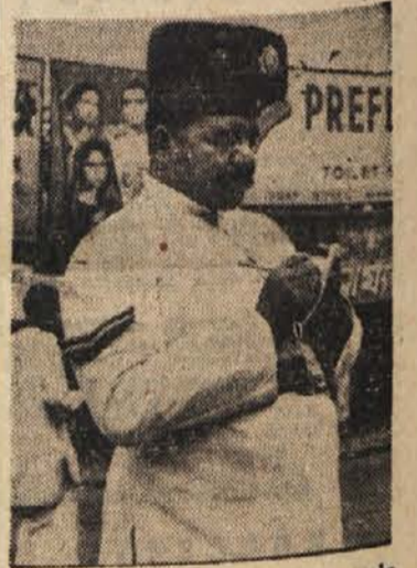
Tale indijski čuvar cestnega reda se očitno zaveda svoje veljave, po vsem videzu pa prav gotovo sodi med tiste, ki ne trpijo lakote