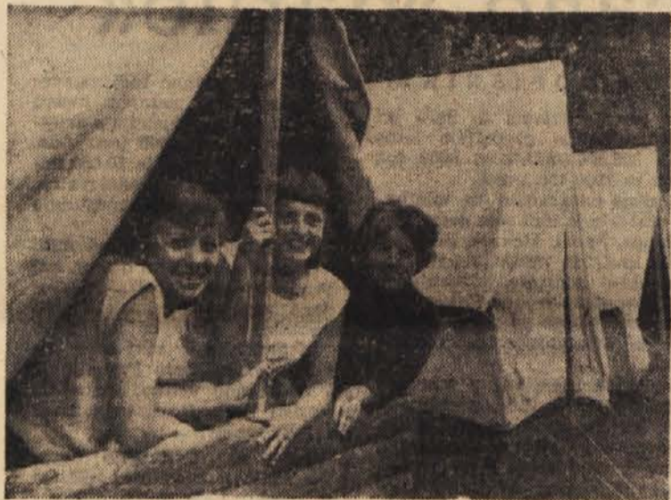
Pod šotorom je prijetno