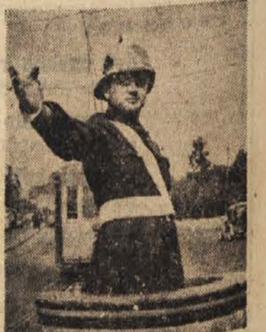
Kot Merkur z Olimpa ureja atenski prometni stražnik s svoje »prižnice« ulični promet