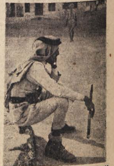
Orientalni fatalizem se kaže tudi v drži tega saudskoarabskega prometnega stražnika, ki sedi ob cestnem robu, kakor da mu je ves promet kaj malo mar

Prometni stražniki v posameznih deželah dajejo potniku s svojo uniformo in z nastopom prvi vtis o nacionalnem značaju dežele. Z nekaj posnetki posredujemo bralcem značilnosti prometnih stražnikov na cestnih križiščih v nekaterih deželah.