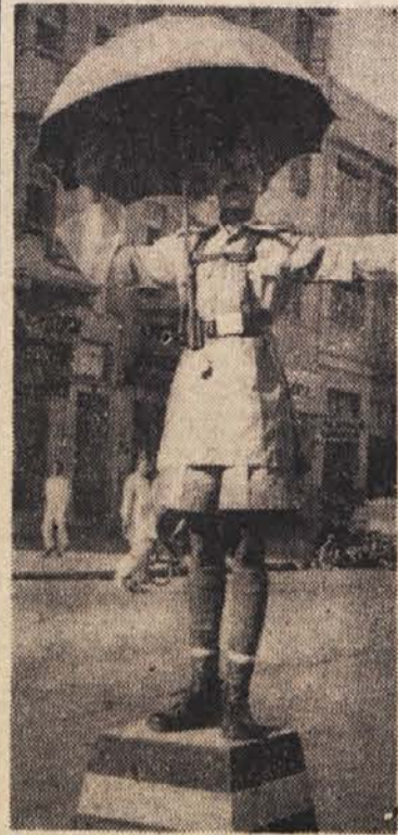
V Pakistanu je sončnik prav tako del stražnikove opreme kot na primer kapa in piščalka

Prometni stražniki v posameznih deželah dajejo potniku s svojo uniformo in z nastopom prvi vtis o nacionalnem značaju dežele. Z nekaj posnetki posredujemo bralcem značilnosti prometnih stražnikov na cestnih križiščih v nekaterih deželah.