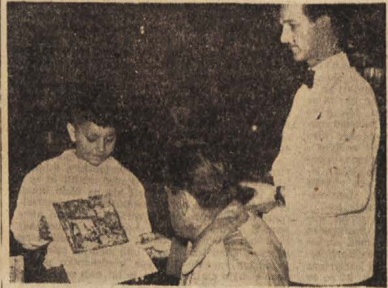
Naša dolžnost je, da otroku vrnemo »izgubljeno sonce«, ne pa da dovolimo, da ga on prodaja...

Rado odšteje denar očetu, ki se skornj ne utegne obliči, da bi hitro stekel tjakaj, od koder se je otrok komaj vrnil — v gostilno.