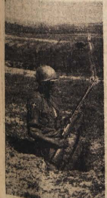
Na mejni straži onkraj Gaze

Mende je poudaril, da vidi stranka edini izhod iz položaja, ki preti državi, v podpori prizadevanjem za razorožitve, in je dodal, da imajo ZDA in Sovjetska zveza v tem oziru največjo odgovornost. Na koncu je rekel, da ima bonnska vlada »življenjski interes podpreti ta prizadevanja.«