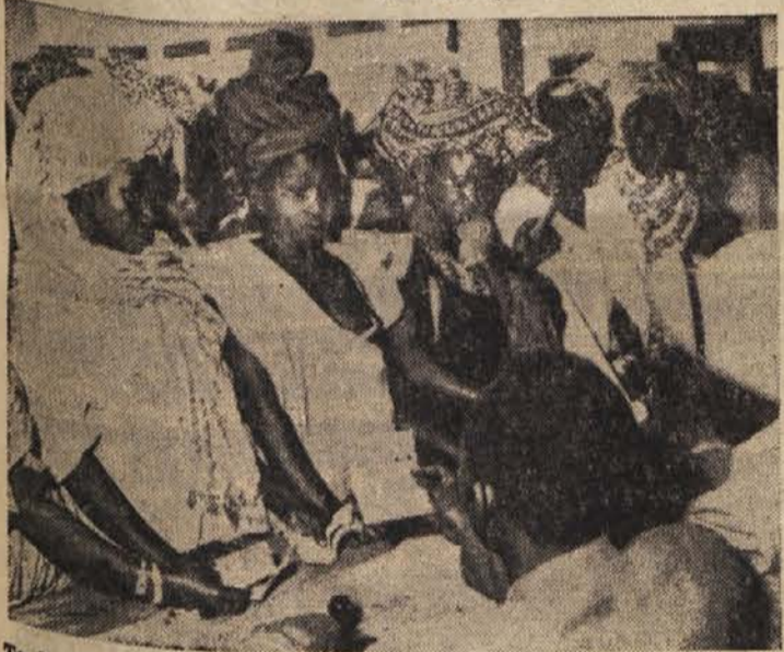
To dni so bile v Dakarju volitve. Udeležile so se jih tudi črнке — v svojih prazničnih oblekah in z vsem okrasjem

Rangun, 9. apr. (Reuter). Predmestni del Ranguna je zajel ogrožen požar in uničil 20 ljudi. Požar je izgubilo življenje, požar je bil 30. Veter je razplamtel stanje, ki je na prostoru okoli 15 km. km vas uničil. Škodo cenijo na 2,25 milijona funtov.