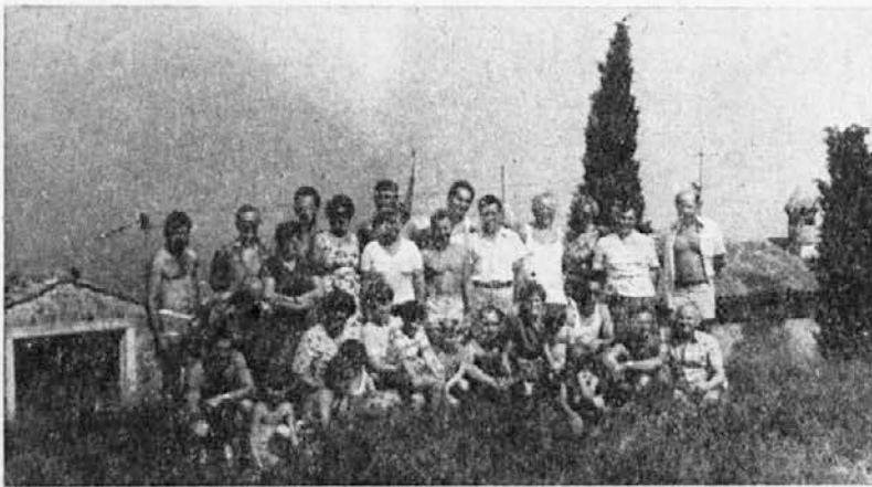
Na trimskem pohodu v Portorožu

Fotografije za to številko so prispevali: F. Rotar, Z. Strgar, kadrovska služba in oddelek za informiranje.