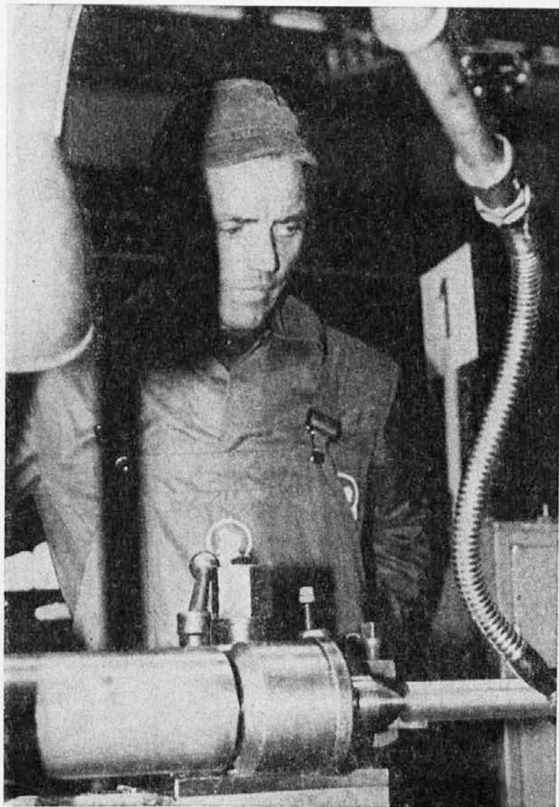
Eden naših tekmovalcev