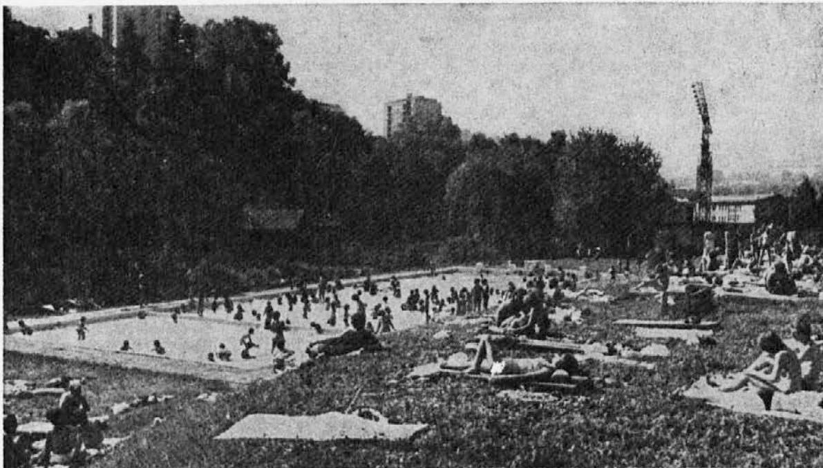
Od teh nobeden ne bi glasoval za to, da bi letni bazen drugo leto zaprli

Z zagrizenim delom in trudom si iz nedrij zemlje dobival kruh za številno družino. Vendar je dala premalo, zato si leta 1971 prišel med nas. Skromnost in marljivost sta ti pri delu pomagali, sodelavci so te imeli radi, ker si nesebično pomagal tudi drugim.