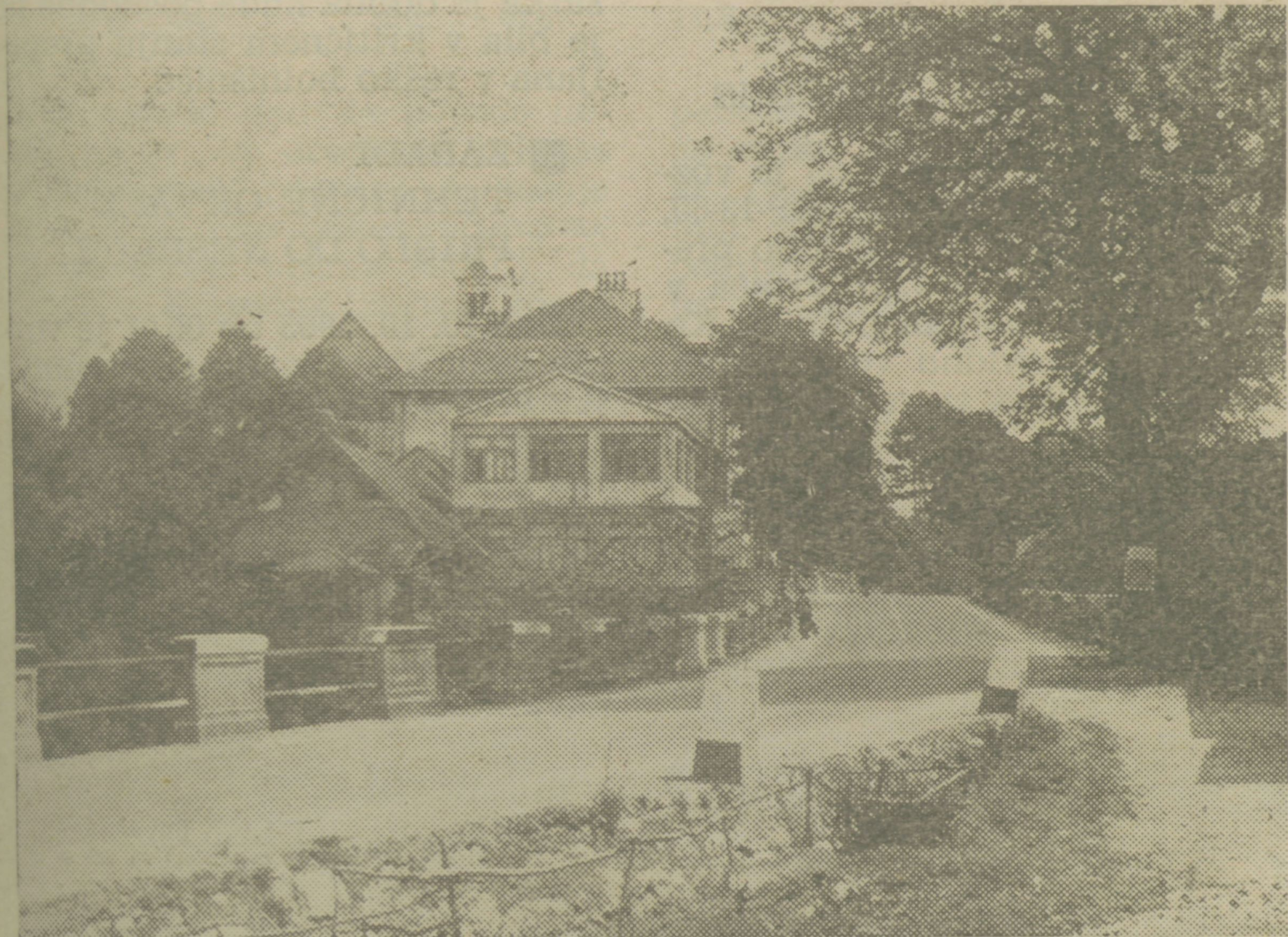
Motiv iz Podgrada

liteta povsem zadovoljiva. No, če ne bi kdo verjel domačinu, pa ga bodo o tem prepričale že štiri polne knjige vpisov za goste, pre-