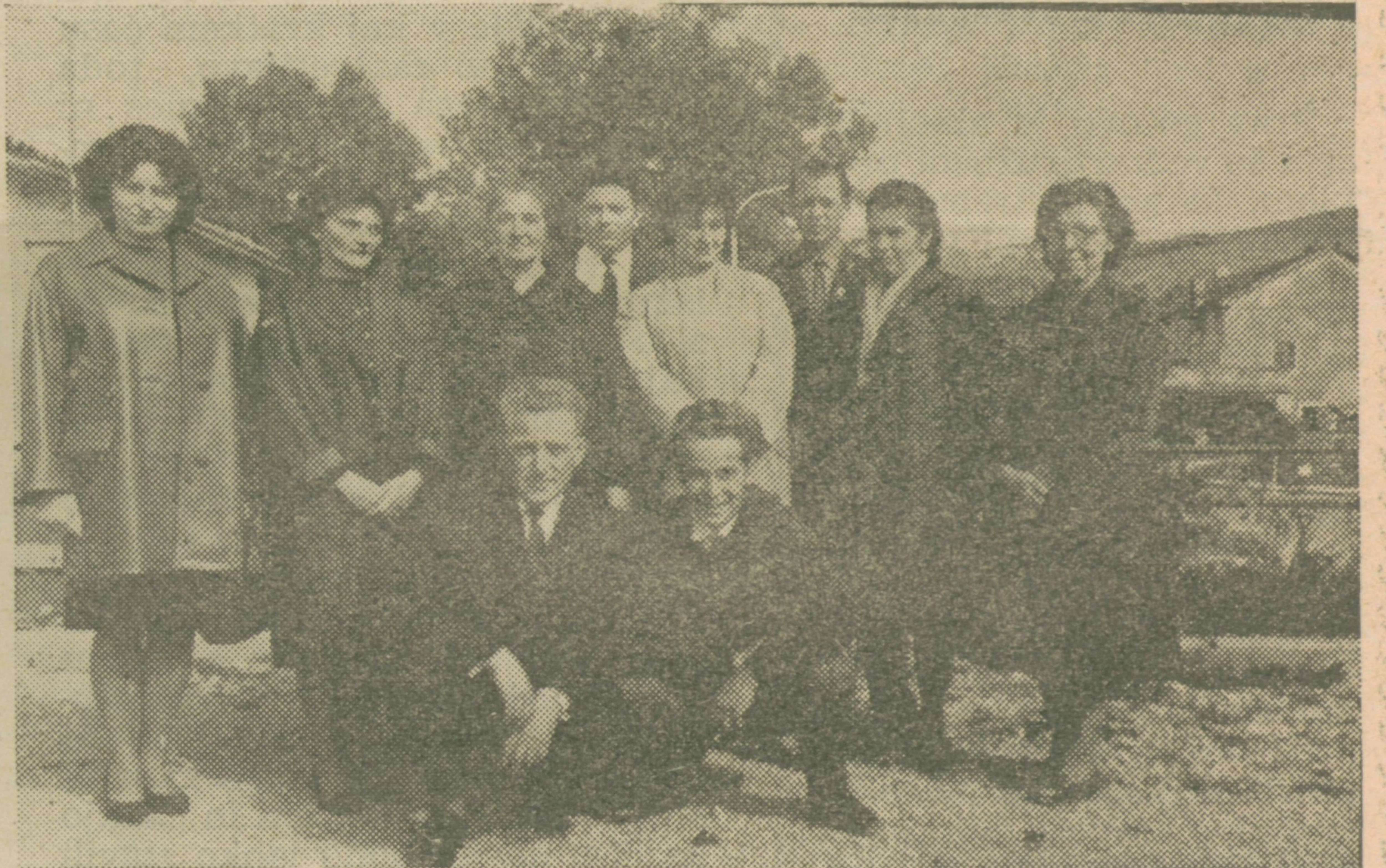
Odlikovanci - krvodajalci, ki so prejeli srebrne in zlate značke

Kar čutijo, so povedali tudi s pesmijo. Privrela je iz duš mladih pevcev ilirskobistriškega otroškega in mladinskega zbora. Po-