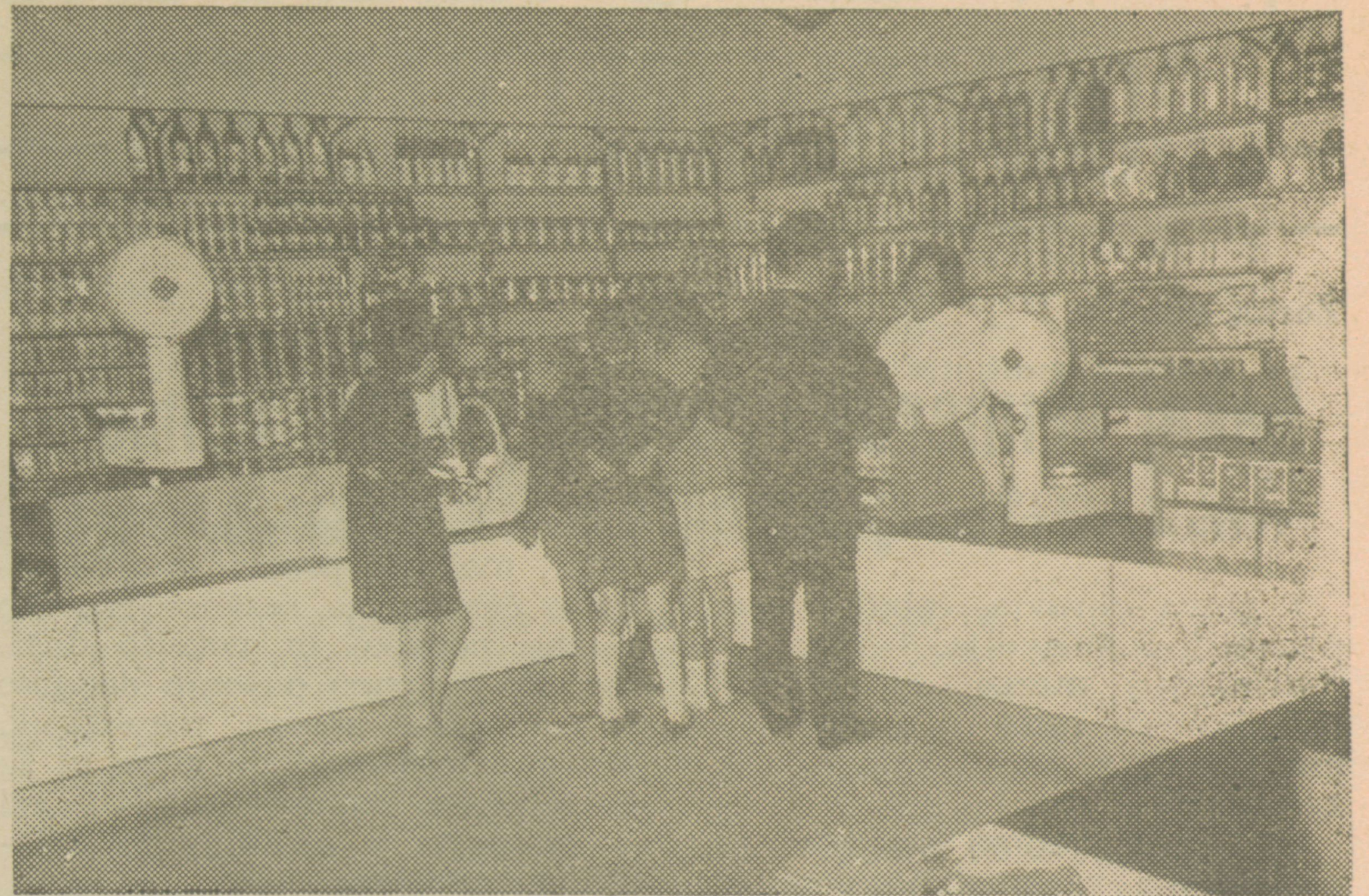
Pogled na notranjost lepo urejene trgovine »Zarja« v Ilir. Bistrici

pozne pomladanske in zgodnje jesenske slane, ki omejujejo dozorevanje in pridelek nekaterih poljščin (koruza, fižol), na nekatere izmed njih pa ne vplivajo tako neugodno.