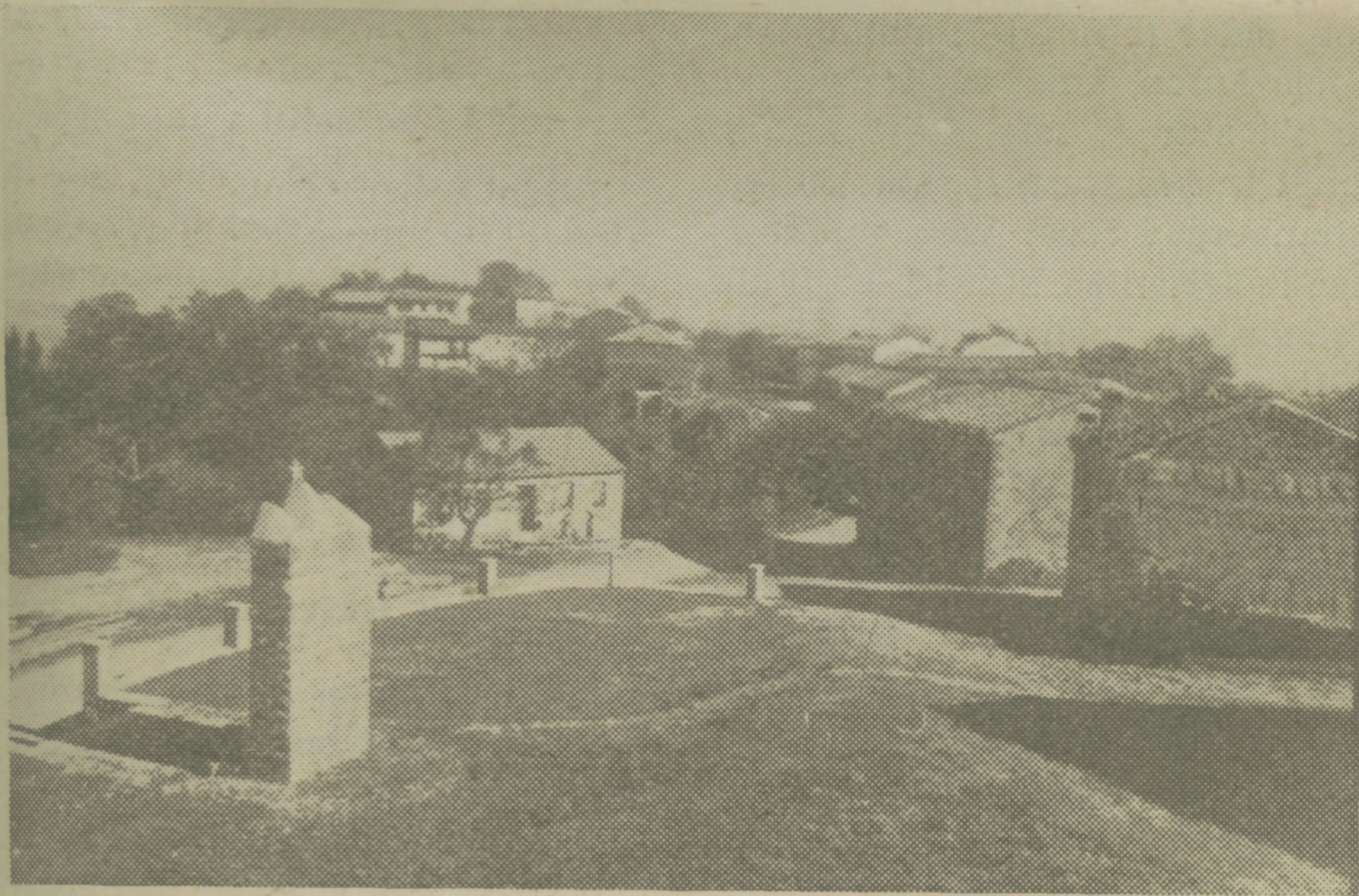
Srce Brkinov — znana partizanska vas Pregarje