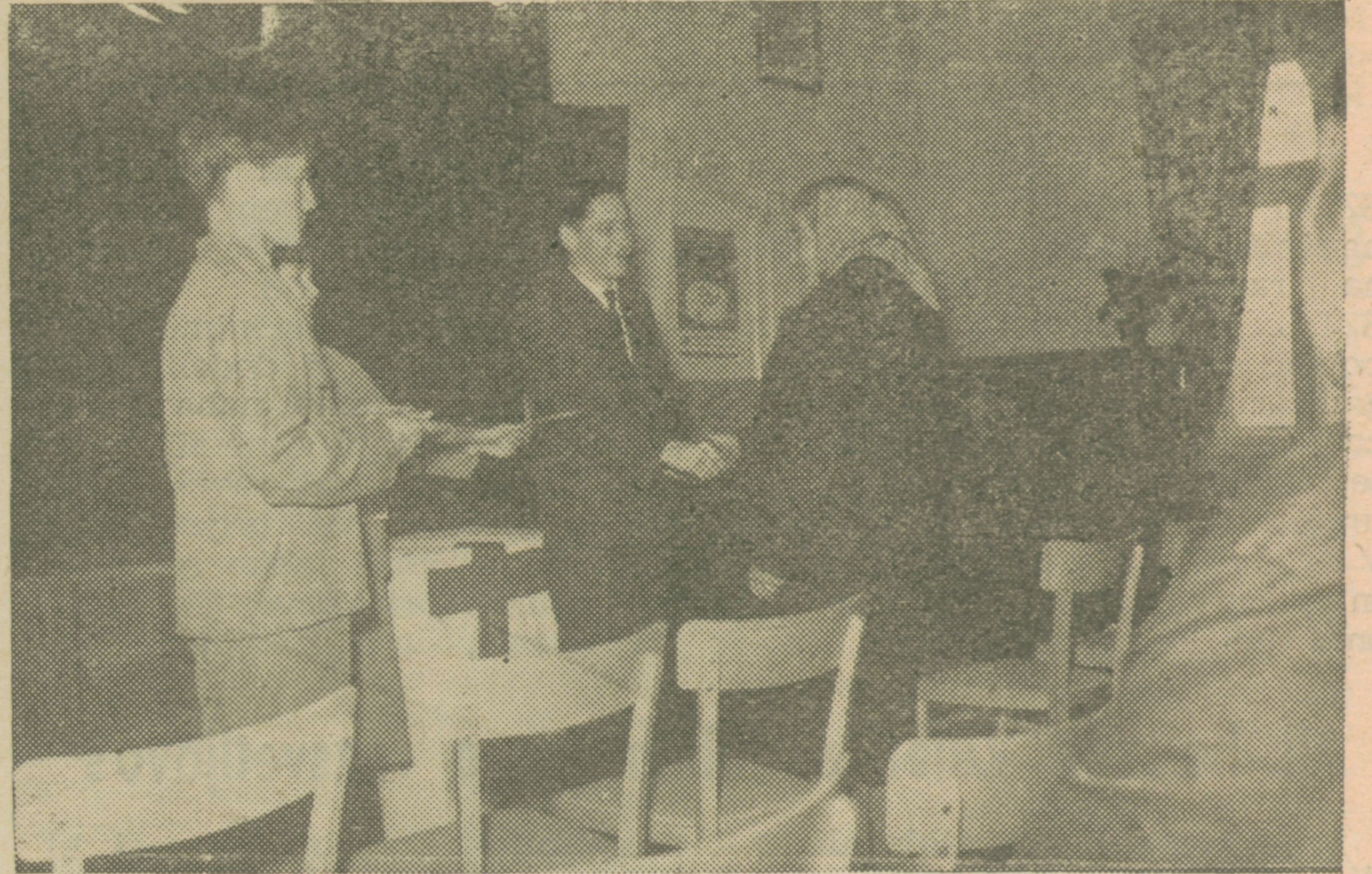
Predsednik skupščine čestita odlikovancem za pet in večkratno odajo krvi ter jim podeljuje značke

ljenje. Hvala vam za danes in za vedno! V srcu čutimo nekaj lepega, kar ne znamo izraziti z besedami...«