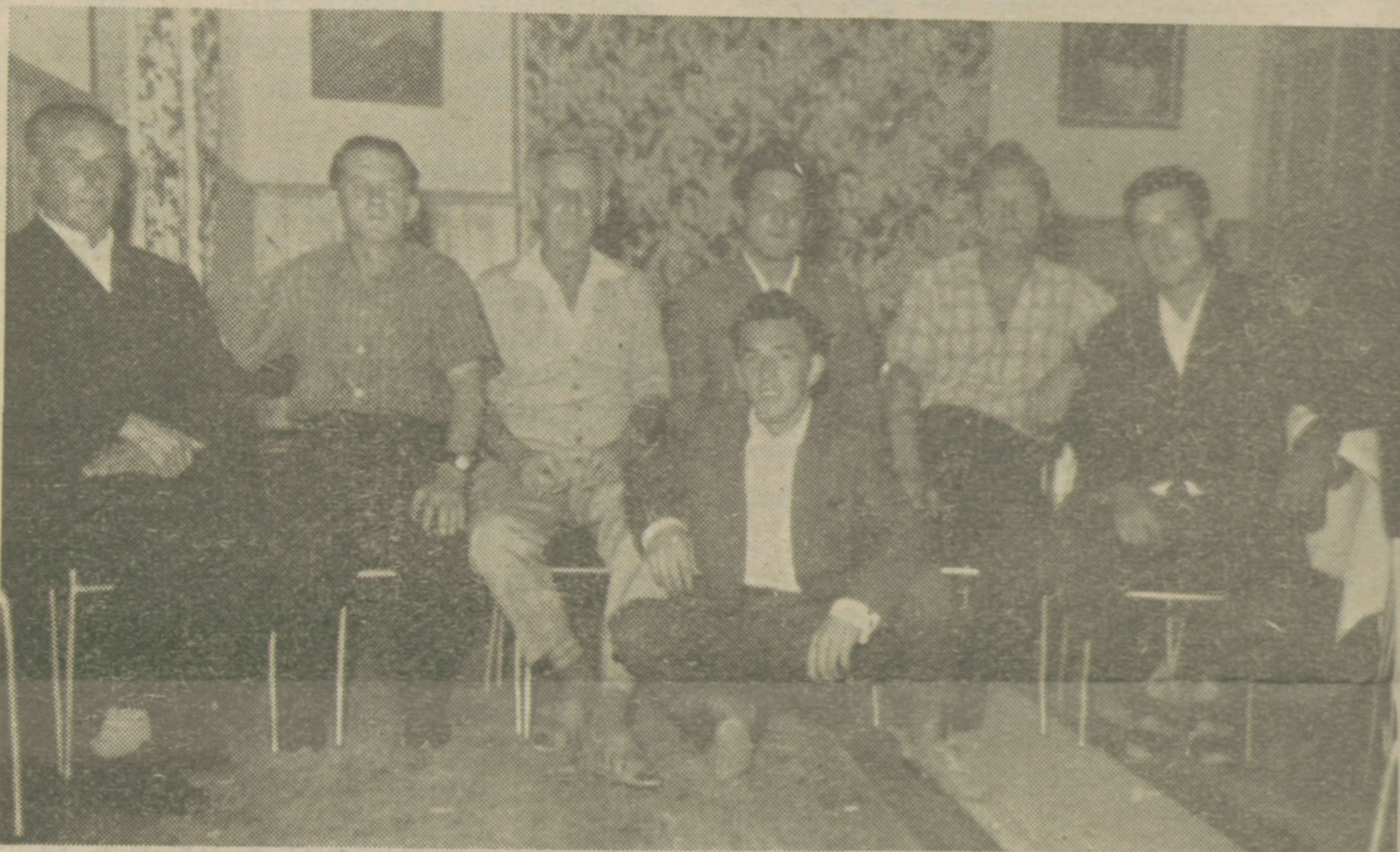
Združenje šoferjev in avtomehaničarjev je pred kratkim nagradilo najboljše šoferje in avtomehaničarje. — Na sliki nagrajenci

1/8 l mleka in oba rumenjaka dobro razžvrkljamo, dodamo sol in moko ter gladko razmešamo. Ko je popolnoma gladko, primešamo še ostalo mleko in pustimo približno 15 minut, da se moka napne. Medtem pripravimo konservo. Meso zrežemo na manjše kose, jih v malo pomaščeni kozici prepražimo in z vilicami zdrobimo. Meso pustimo na toplem. Potem naredimo sneg iz obeh beljakov in ga rahlo zamešamo v omletno testo. Iz tega spečemo bolj majhne omlete in jih nadevamo z mesno sekanico.