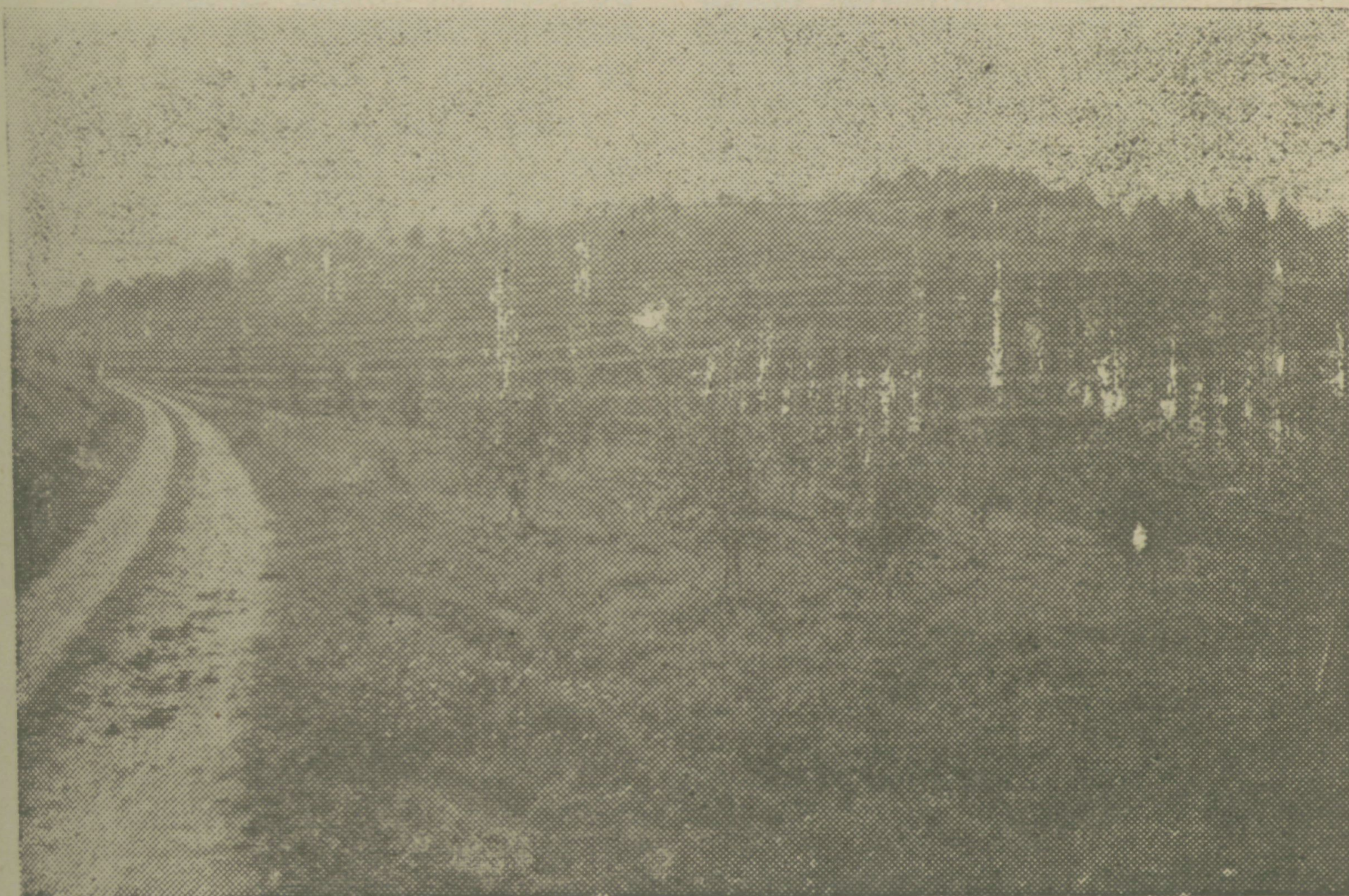
Pogled na plantažni nasad jablan v Smrjah. Nasad uspeva zelo dobro. Letošnje jesen so posamezne jablane že rodile

petkrat. Važne pa so tudi skrajno nizke in visoke temperature, ker prve omejujejo pridelavo ozimin, druge pa jarin. Za naše področje, naše poljščine (posebno pa za sadje), so še najvažnejše