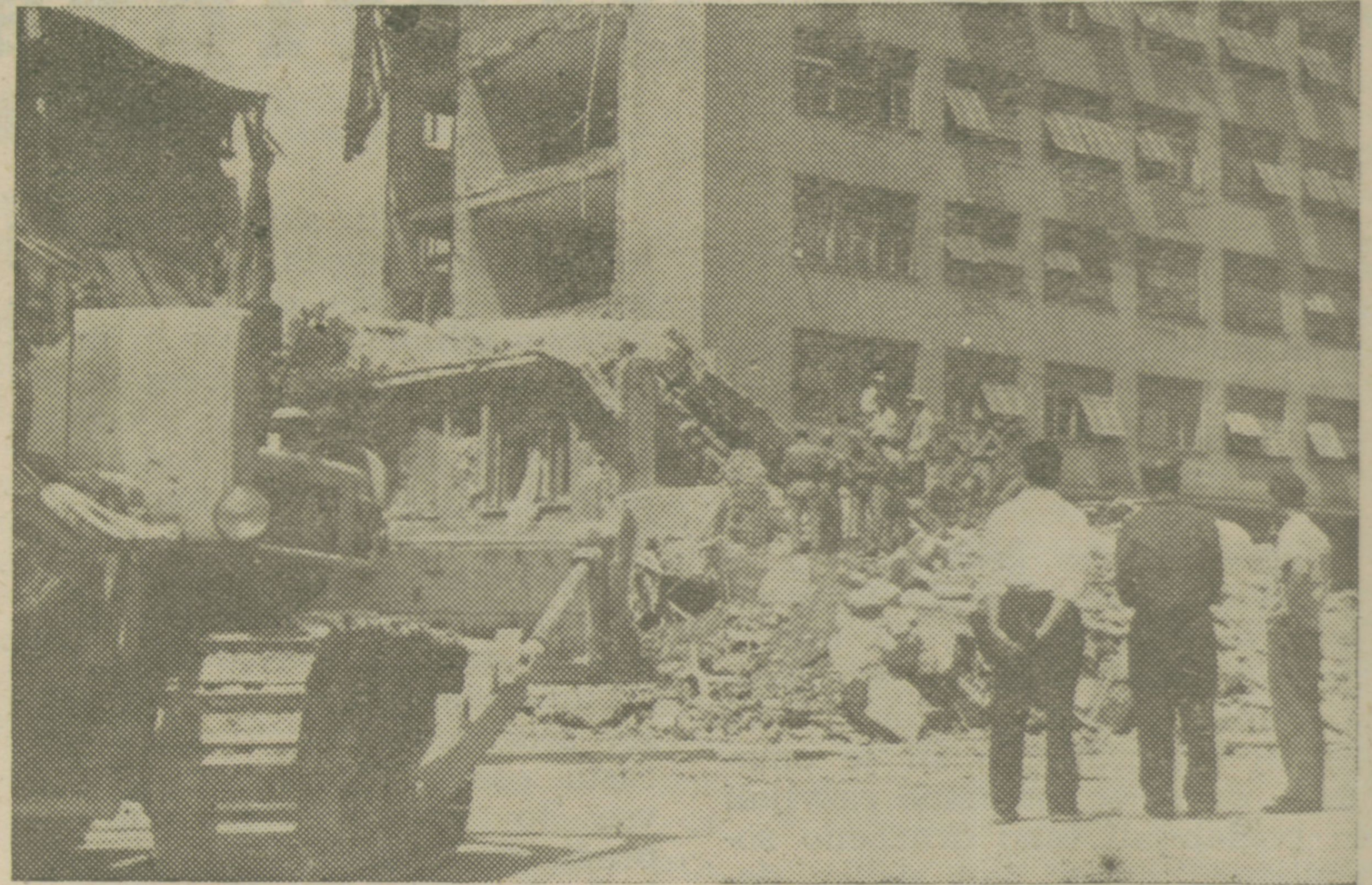
Tako je izgledala stavba socialnega zavarovanja drugi dan po potresu v Skopju

Značilna ugotovitev pri vpisu posojila je v tem, da je povsod prevladalo enotno mišljenje, da je posojilo humana akcija, ki jo