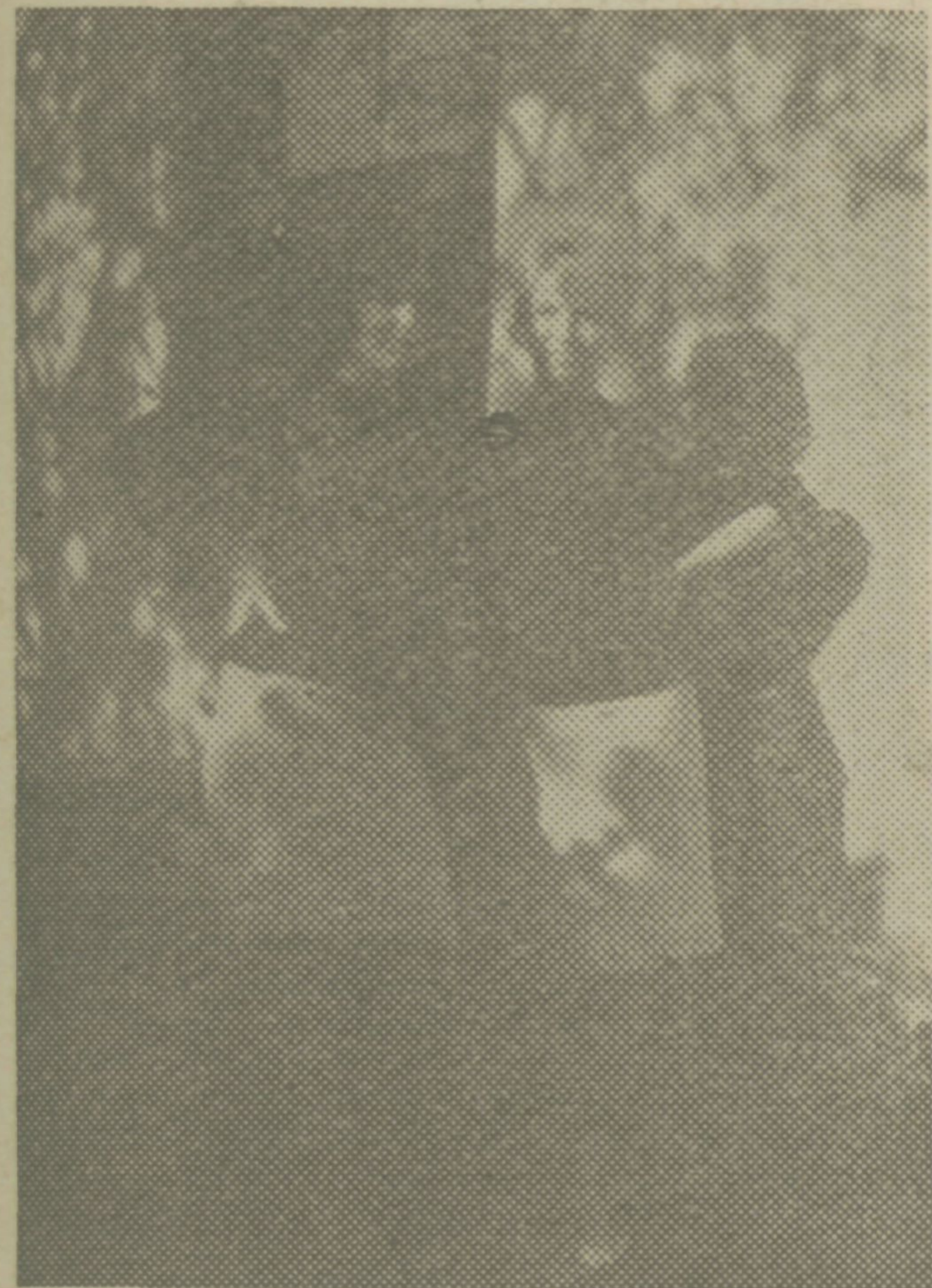
Prosvetni delavki - Gorenjki, ki sta se odločili za službovanje v naših Brkinih

Topel jesenski mir je razlit preko Brkinov. Hrastovi in bukovni gozdiči gorijo v čudovitih bar-