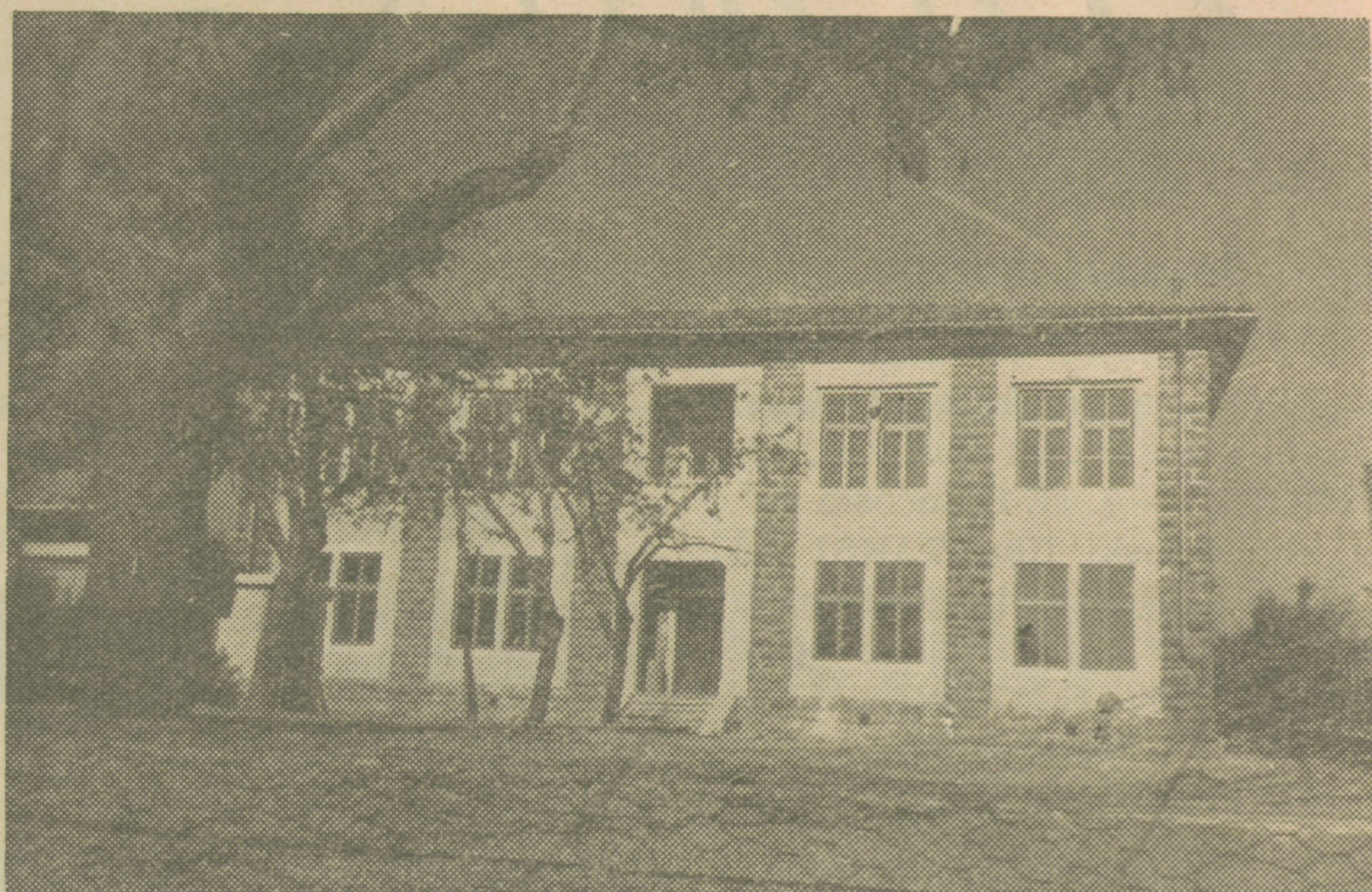
Osnovna šola na Pregarjah

sama poišče zabavo. Je pač tako, da seže večina po tem, kar je najbolj pristopno, to je pa — gostilna.