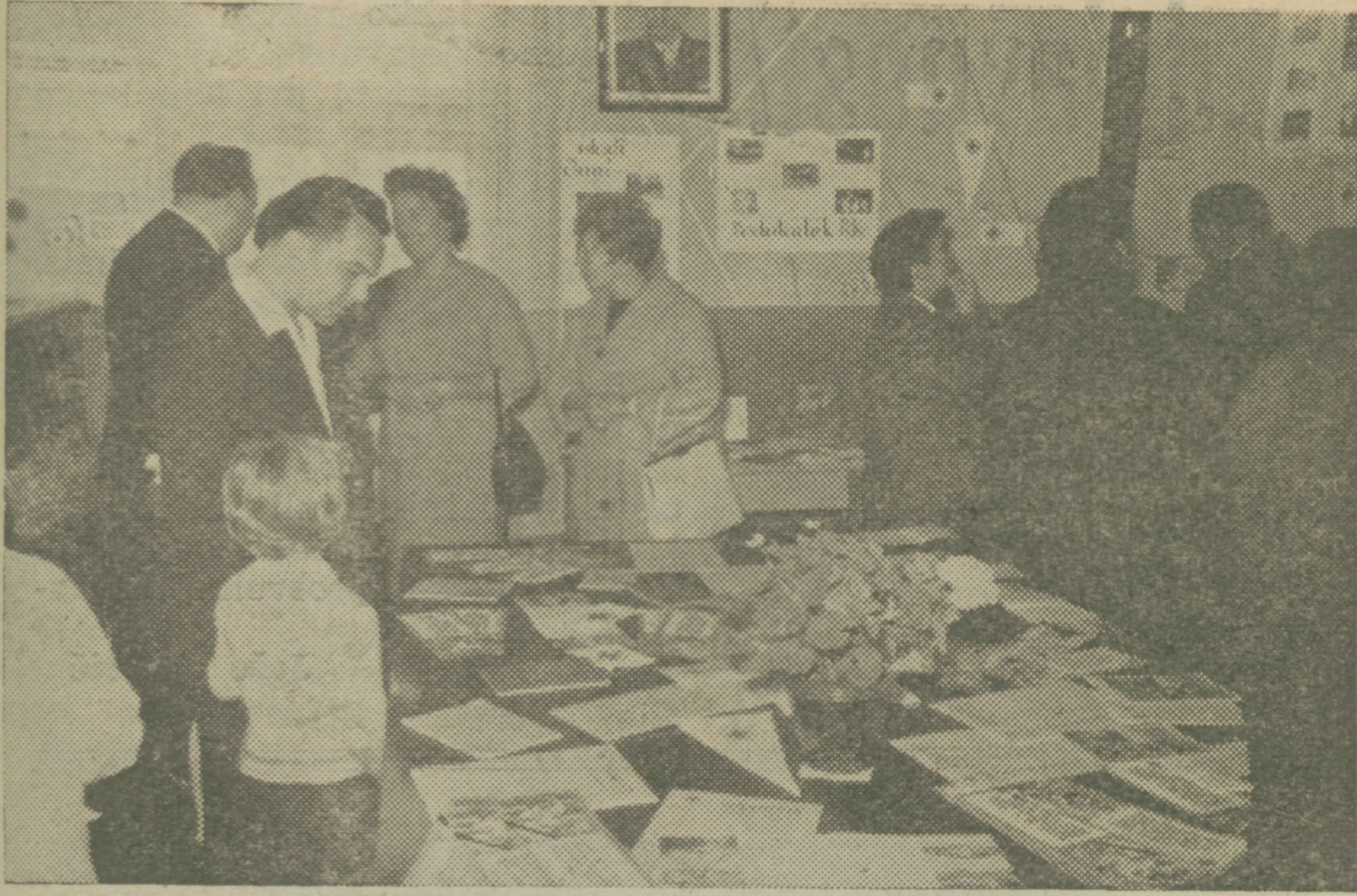
Razstava o delu in pomenu RK, ki jo je organiziral občinski odbor RKS