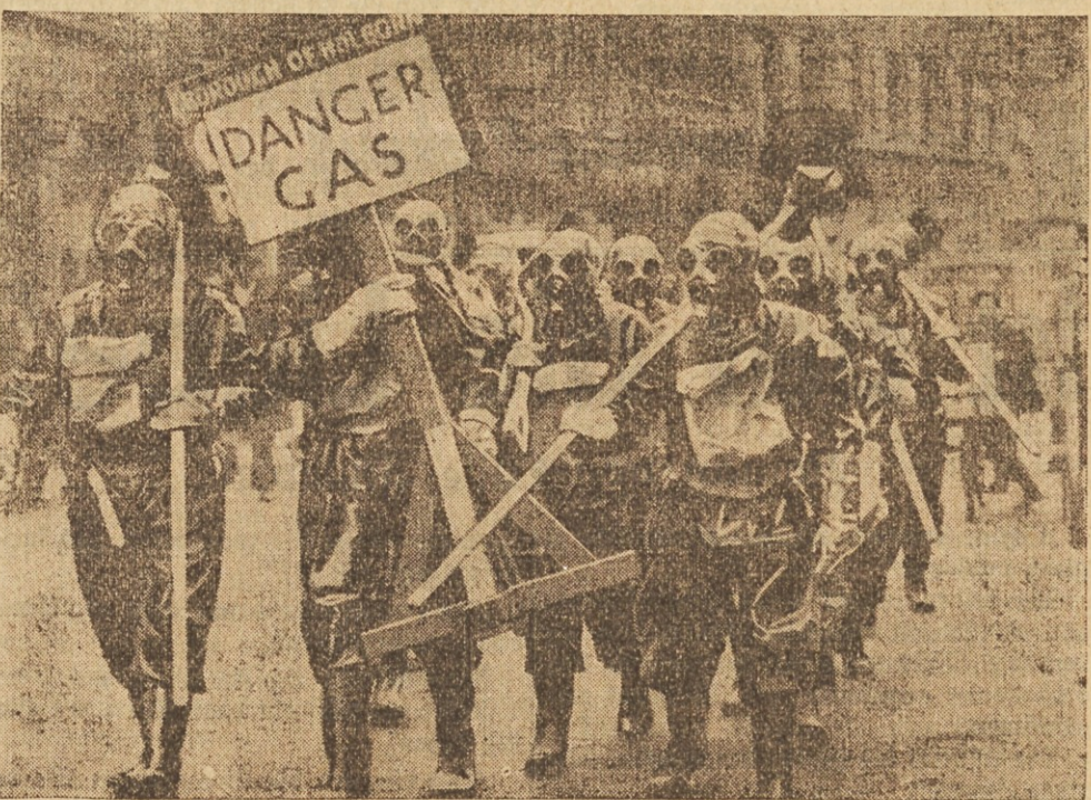
In diesen Tagen fand in London eine große Luftschutzübung statt, die der Bevölkerung in eindringlichster Weise die Gefahr von Giftgasangriffen durch Flugzeuge vor Augen führen sollte.

interessiert dem lustigen Kreisen einer elektrischen Eisenbahn und hatte seine Freude an dem Aufsteigen und Abfallen der Waggons, an dem Wirbel der bunten Karussells und an dem Flattern der Windmühlen, die da im Schaufenster ihr fröhliches Spiel vor vielen, neugierigen und sehnsüchtigen Kinderaugen entfalteten. Das war die rechte Ausspannung für ihn nach diesem schwierigen Fall, um den seine Gedanken immer wieder wanderten und für den bisher keine Lösung zu finden war. Ein Mord war geschehen in den Nebeln des Teiches. Ein junger Mensch, der Hilfe bringen wollte, war selbst das Opfer geworden und ein junges Mädchen lag zu Hause in Fieberphantasien und konnte keine rechte Auskunft geben. Was sie nur immer meinte mit dem „Hintertenden“, warum sie nur immer vor dem Manne am anderen Ufer sprach, der laut und leise, laut und leise ging. Alle Nachforschungen alle Vermutungen, alles Grübeln war bisher vergebens gewesen und keiner seiner zahlreichen Beamten, die er mit der Untersuchung beauftragt hatte, konnte eine Lösung finden, bis er sich selbst des Falles angenommen und bei Hella Anderson vorgeschrieben hatte. Doch auch dieser Versuch brachte nichts Neues — bis auf den