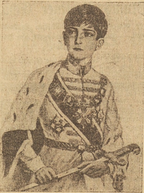
S. M. König Peter II. von Jugoslawien.

Beograd, 24. Jänner, (Avala.) Der bulgarische Ministerpräsident Georgi Kjussevanov ist heute um 9 Uhr vormittags in Beograd eingetroffen. Dem Chef der bulgarischen Regierung wurde ein feierlicher und herzlichster Empfang nicht nur durch die amtlichen Vertreter zuteil, sondern