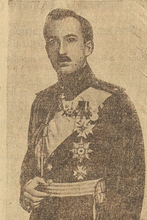
S. M. Zar Boris von Bulgarien.

Die Bestätigung dieser Vereinbarung erfolgte durch die Unterzeichnung des Vertrages.