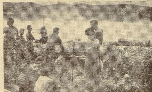
Dugi otok: dober tek ob ribi, pečeni na žaru!...