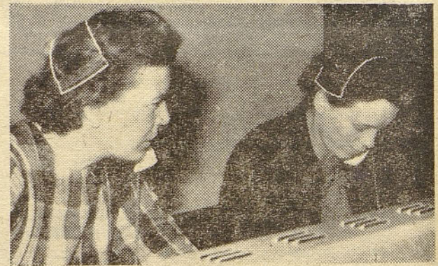
Telefonistkam pa dela res nikoli ne zmanjka...