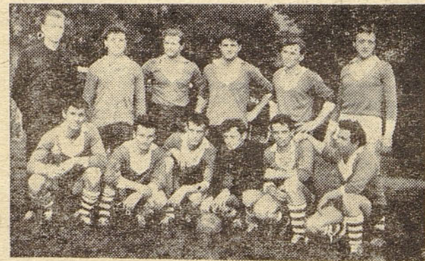
Zmagovalna ekipa nogometa šev »ISKRE«

Rokometna ekipa »Iskre« je zmagala nad obojima nasprotnikoma: ekipama Gimnazije in »Gostola«. V streljanju se je II. ekipa ISKRE morala zadovoljiti z 2. mestom za ekipo tovarne cementa iz Anhovega, medtem ko je I. ekipa tedaj nastopila na tekmovanju za poka! »Postojnske jame« in v močni konkurenci zasedla 4. mesto. Tudi v šahu so naši tekmovalci dosegli šele 4. mesto, slabo pa so se odrezali