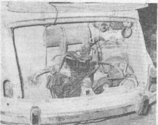
To, kar vidite na sliki, ni vredno počenega groša. Kajti če bi bilo, bi mehaničarsko navdahnjeni lump odvil, razdril ter odnesel tudi to — tako kot lep košček nekdanjega samohodnega vozilca...