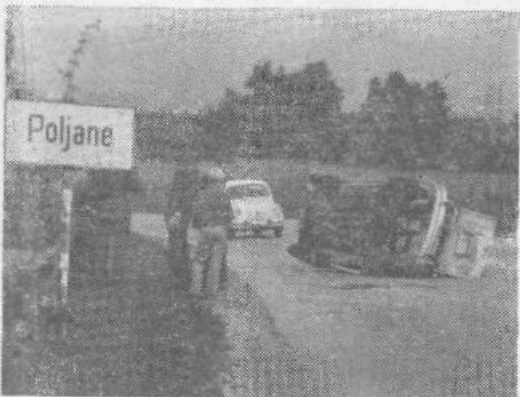
Najprej je bil fičko cel, ovinek pa oster. Potem je veseli mladenič sklenil stavo, da bo ovinek zvozil. Ovinek je še vedno takšen, kot je bil, fičko pa ne. Voznik je namreč stavo izgubil.