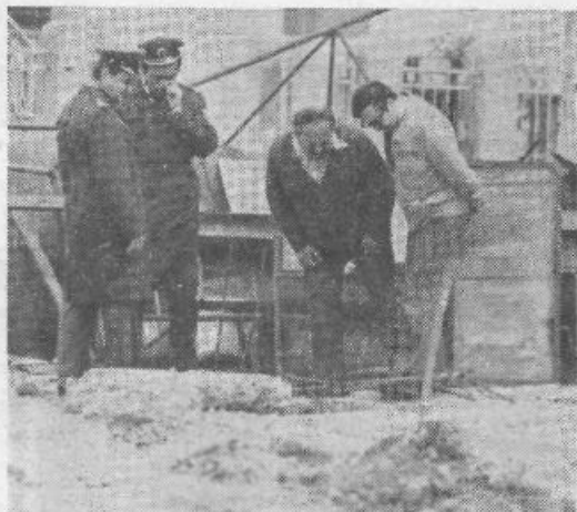
Na gradbišču križišča Drenikove in Celovške je bilo vedno živahno. Gradbinci so dobili tudi nekaj prizadevnih pomočnikov...