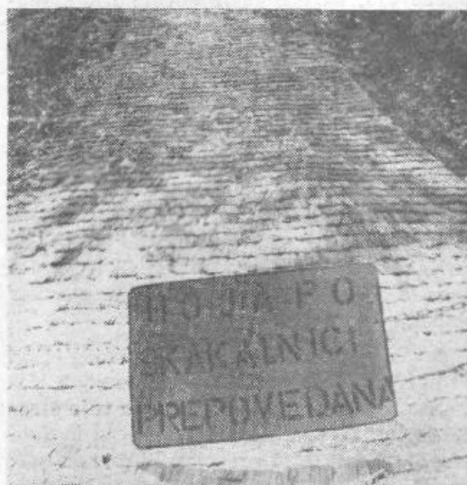
Hoja po skakalnici v Strahovici je prepovedana. In res, nihče ne hodi po njej. Ampak, skače tudi ne...