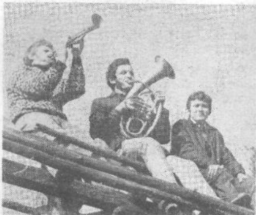
Kje so časi, ko je bilo z navijaških tribun slišati le »fuj sudija, daj mu eno na g...« in podobna športna gesla... Kultura je zavela tudi po stadionih — vsaj kar se rekvizitov tiče...

Izhaja od leta 1964 namesto Občinskih razgledov, ki jih je leta 1961 začel izdajati občinski odbor SZDL Ljubljana-Siška — Naslov: »Javna tribuna«, Ljubljana, Trg prekomorskih brigad 1, soba 405 — Tisk AERO, kemična, grafična in papirna industrija, Celje — Po mnenju sekretariata za informacije Izvršnega sveta SRS št. 421/1/72 z dne 7. 2. 1974 je Javna tribuna oproščena prometnega davka.