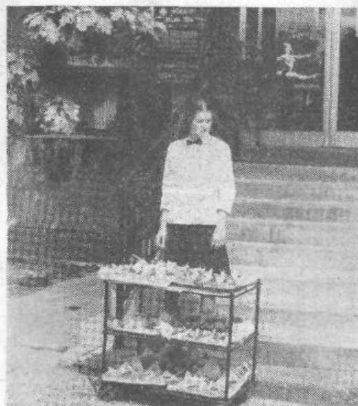
Ker stoli v sejnih dvoranah tu in tam prav grozljivo samevajo, bi kazalo na vabila kdaj pa kdaj naslikati tudi takšne dodatke — poleg dnevnih redov, seveda. In pa napisa, da bodo sendviče delili šele pod točko razno...