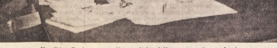
Kandidat Realne gimnazije pred komisijo za znanstveno skupino

Clani Komisij bodo te dni pregledali zapisnike o izpravi manjših garderob in eno večjo garderobo za statistike ter sedem ostalih delovnih protokolov. Filmski studio v Portorožu, ki je edini te vrste ob morju, obali in v bližini Krake, bo nadomestil studije v drugih krajih, saj se bodo lahko režiserji, v primeru slabega vremena pri snemanju zunanjih posnetkov ob morju ali na Kraku, poslužili studia in slikali notranje posnetke. Za ta studio še sedaj zbiramo razne domače in tuje filmske družbe, ki si bodo v dnevi 2. in 3. avgusta studio ogledale. V teh dneh bodo prišli na ogled studija tudi režiserji, igralci ter ostali udeleženci Puljskega filmskega festivala.