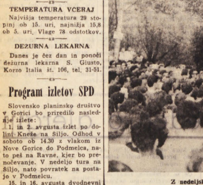
Z nedeljskega praznika ob Doberdobskem jezeru

EDGAR WALLACE: ZAGONETNA ZAPONKA Dragi Pavel! Tvoje tromesečno nakazilo ti pritiče šele 21. tega meseca. Zato mi je žal, a ne morem izpolniti tvoje prošnje. Moraš se navaditi na manj razpisno življenje, če hočeš ob moji smrti priti do resnične bogastva. Samo če boš se-daj znal prenašati žrtve, boš razumel, kaj pomeni imeti veliko denarja, in se boš znal kasneje ravnati. «Je star skopuh,» je pripomnil Frank. «Oni dan mi je moj delovni tovariš rekla, da mora imeti Trasmere najmanj en milijon funtov sterlingov. Kje si je pridobil ves ta denar?» «Mislim, da na Kitajskem,» je odgovoril Pavel in prezirljivo skomignil. «Rojen je tam doli na zlatih poljih ob reki Amur. Bil je še deček, ko je kupil nekaj zemljišč, na katerih so odkrili zlato. Sicer se pa ne morem pritoževati cezenj. Zame je bil vedno dober prijatelj. Ko ne bi bil tak razpisnež, kot sem, bi lahko zelo dobro živel z nakazilom, ki mi ga daje.» Frank si je prižgal novo cigareto, nakar je vprašal: «Glede tvojega strica krozijo zelo čudne stvari. Pravijo, da je največji skopuh v celem Londonu in da drži vsaj denar doma. Ali je res?» «V banki zares nima računov,» je priznal Pavel. «Meni je jasno, da ima velike vsote v Spring Houseu. Ta hiša je zgrajena kot trdnjava. V kleti je zavarovana soba, ki je prava mo-strovina. Moj stric me nikoli ni povabil s seboj v klet, vendar, kadar grem za nekoliko dni k njemu, ga vidim čisto stopati