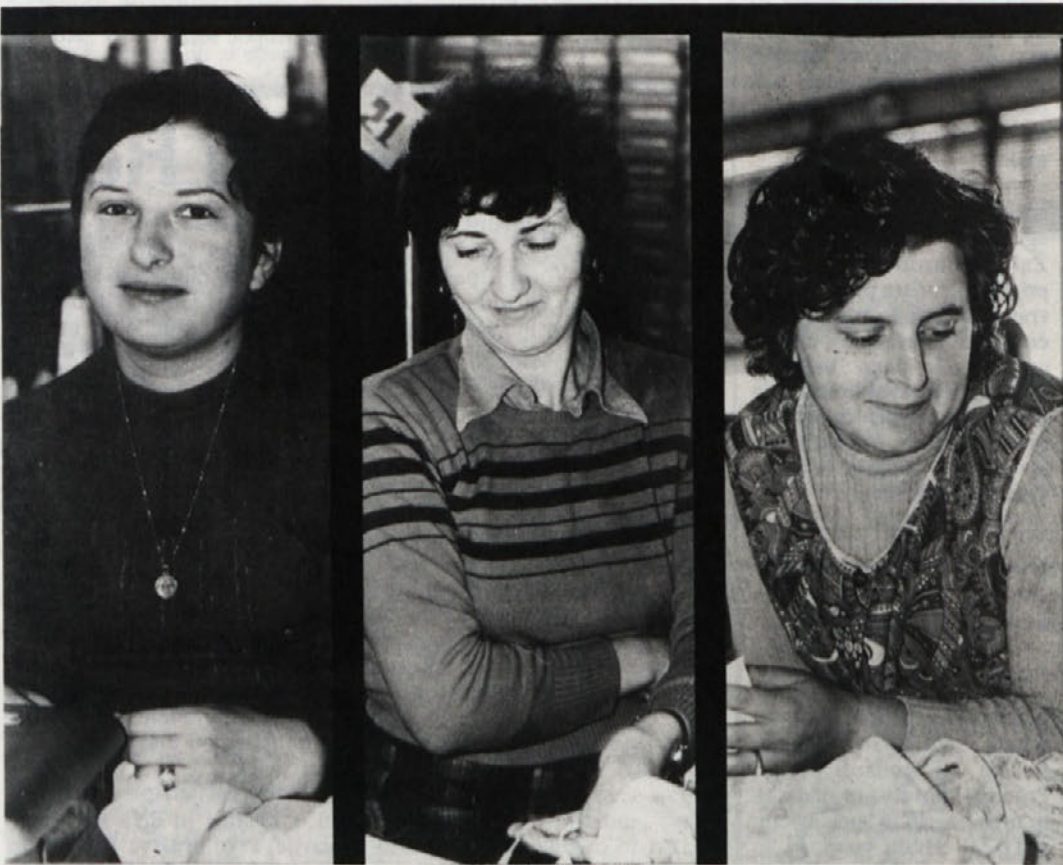
Delavec ni v službi samo zato, da bi pridno dosegal normo, si prizadeval za večjo storilnost in prihranek pri materialu, mora biti tudi dober samoupravljaec. Tega pa ni mogoče doseči brez dobrega sistema obveščanja. Na fotografiji so delavke iz TOZD Dobova.