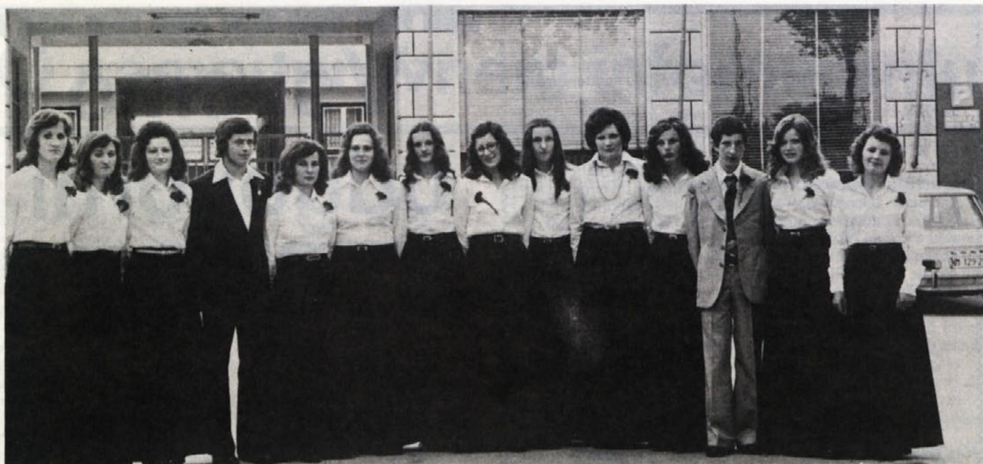
Izobraževanju posvečamo v BETI veliko pozornost. Konec maja je zapustila poklicno šolo nova generacija učenk in učencev. Pri delu in življenju jim želimo mnogo uspeha!