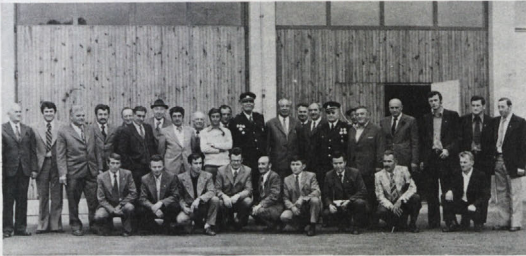
Metliške gasilce so obiskali kolegi iz Kragujevca. Skupno so preživel lep dan, pogovorili pa so se o svojih težavah in uspehih.