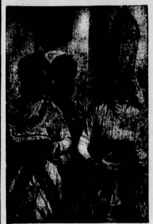
Für die Weihnachtstage werden in verschiedenen ungarischen Dörfern bei Weihnachtsspielen besondere Weihnachtstrachten getragen. Hier sieht man ungarische Mädchen aus dem Dorf Molossa in ihren prächtigen, mit Spitze und Stickerel geschmückten Kleidern.