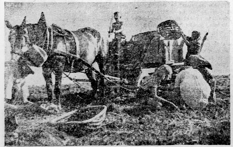
KROMPIRJA BO DOVOLJ ZA VSE