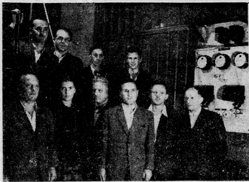
V sredo zvečer je tudi delavski svet tiskarne »Slovenskega poročevalca« izvolil upravni odbor

Dvajset delavcev je še na gradbišču v Medvodah, ki grade tamkajšnji elektrarno z dvema turbinskima stebroma