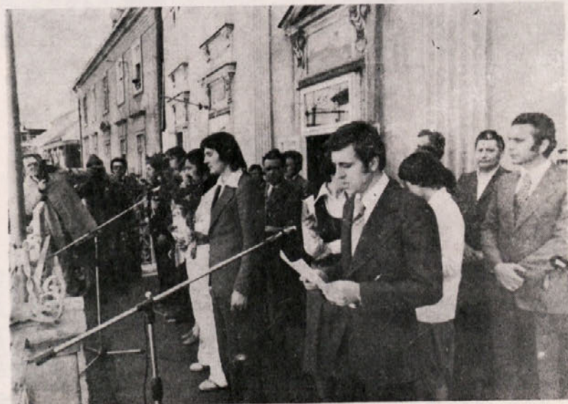
Štafeta palica v rokah celjskih mladincev, 18. aprila 1977

Zaradi velike prenatrpanosti, bomo letošnje igre mladosti predstavili na prve dni v mesecu juniju s tem, da je takrat nosilec dejavnosti osnovna organizacija