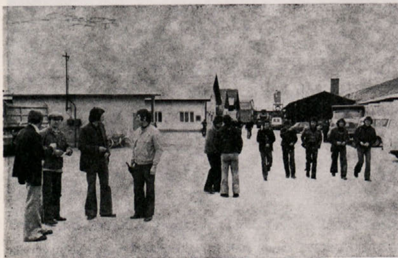
Kje boš pa ti preživel prvomajske praznike ...

Enako velja tudi za fotografije z vseh prireditev in proslav v mesecu mladosti.