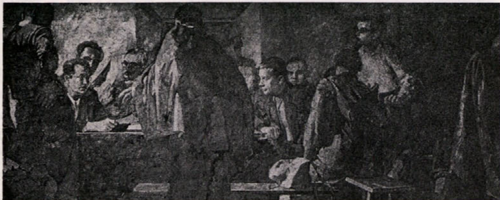
Ustanovni kongres Komunistične partije Slovenije 1937

Od takrat naprej je z besedo Tito povezana vsa naša zgodovina. Genialno vodenje narodno-osvobodilne borbe, kreativno razvijanje marksistične misli, miroljubno sožitje med narodi, neuvrščenost,