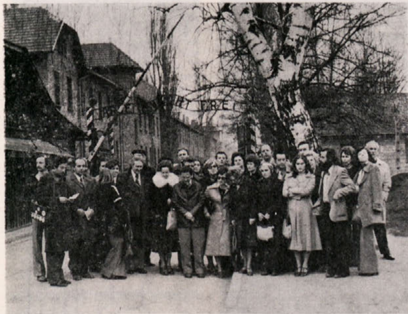
Ingradovi obiskovalci pred vhodom v taborišče AUSCHWITZ aprila letos. Pomnik časa je breza, ki so jo fašisti posadili pri otvoritvi taborišča leta 1939