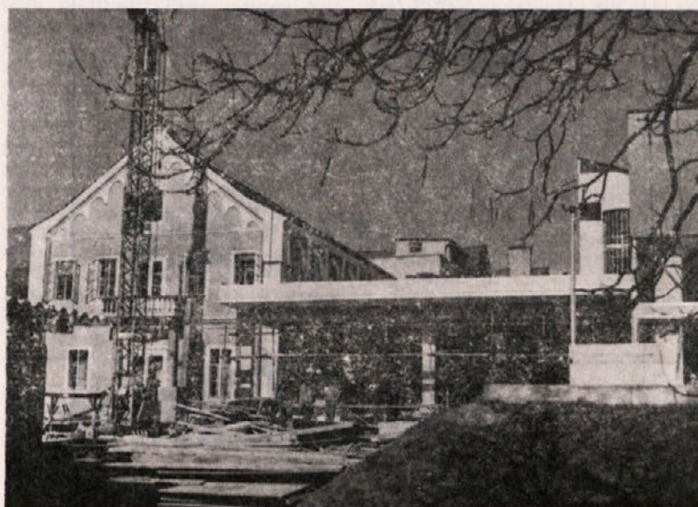
TOZD GO LAŠKO: Lani je Zdravilišče v Laškem pridobilo novo zgradbo in pokrit bazen, letos pa Ingrad izvaja objekt, ki bo funkcionalno povezoval stare in nove prostore