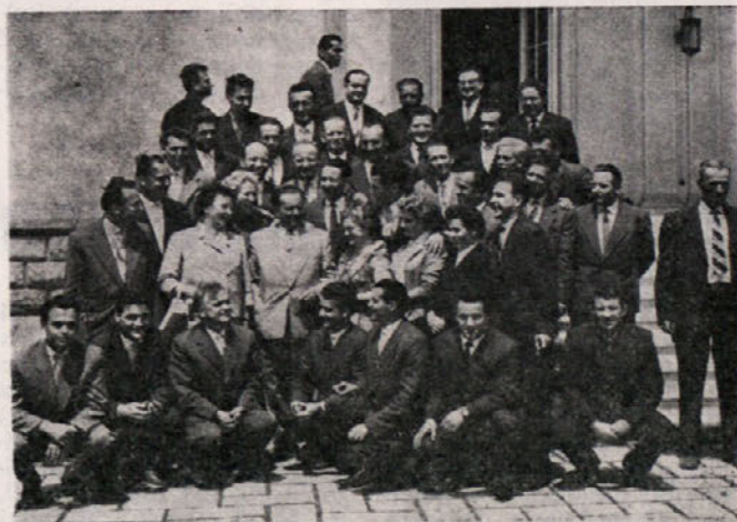
Prvič se je Franc Vrbnjak srečal s Titom leta 1959

Okrog 14,30 ure istega dne se je tovariš Tito poslovil od nas in se nam zahvalil za čestitke ter naprosil, da prenesemo vsem