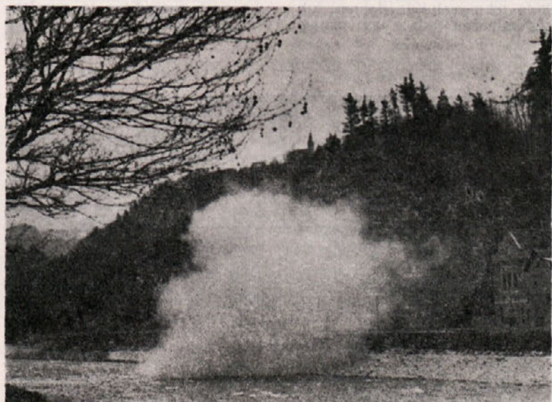
TOZD GO CELJE: Zaradi stalnih večjih potreb nasipnega materiala smo prevzeli sanacijo plazu v parku. Celotna količina materiala znaša 320.000 m 3 . Izvedeno je bilo že prvo uspešno masovno miniranje