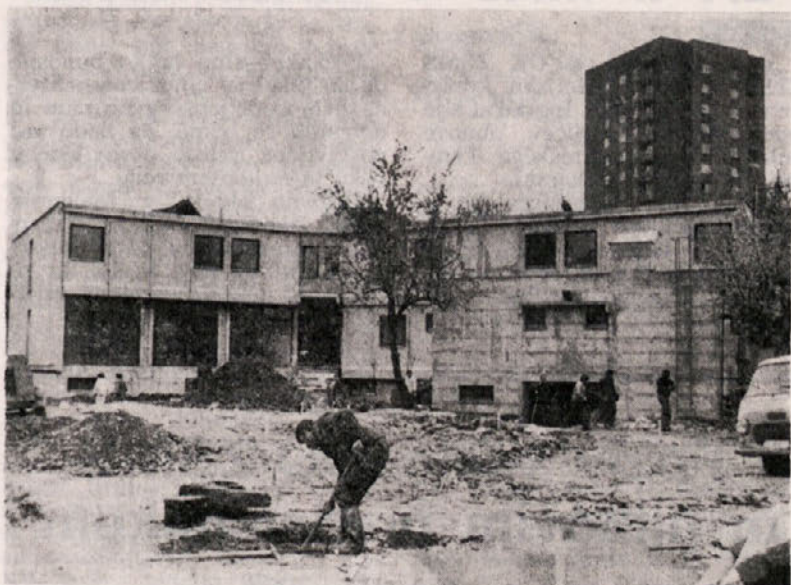
TOZD GO CELJE: Samski dom za delavce UJV v Ipavčevi ulici