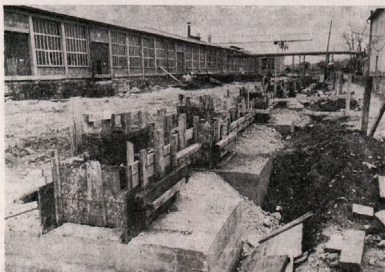
TOZD GO CELJE: Gradnja furnirnice LIK »Savinja bo potekala kljub dvomesečnem zastoju (zaradi dokumentacije) v okviru pogodbenega roka in bo možno pravočasno montirati uvoženo opremo