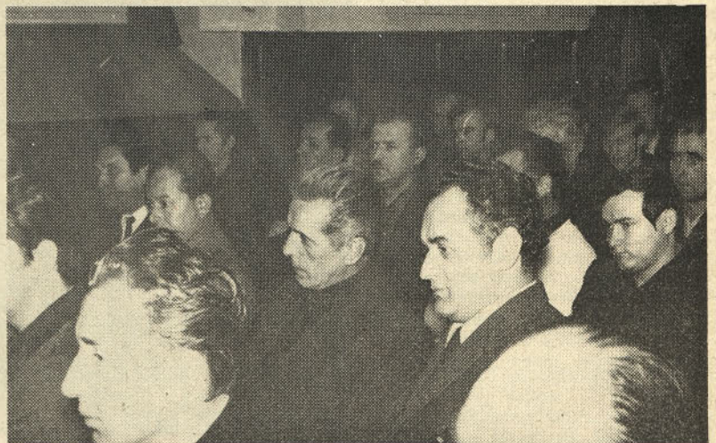
Del udeležencev problemske konference ZK