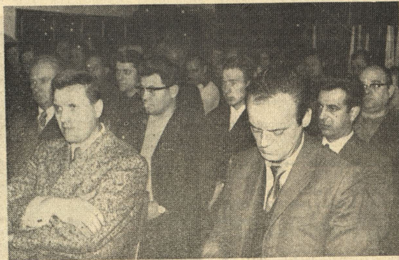
Člani ZK na problemski konferenci poslušajo poročilo sekretarja

V poročilu se navaja, da zahteva po ponovni korekturi osnovnih postavk za člane Zveze komunistov ni sprejemljiva, saj smo se ravno mi zavzemali za odpravo nesorazmerij. Vendar je naša naloga, da najdemo možnost povečanja plač vsem zaposlenim in ne samo določenim skupinam. Zavedati se moramo vsi člani ZK in kolektiv, da sredstva za osebne dohodke ne bomo povečali s prekinitvami dela, ampak le z boljším delom in večjo disciplino, za kar smo odgovorni predvsem člani Zveze komunistov.