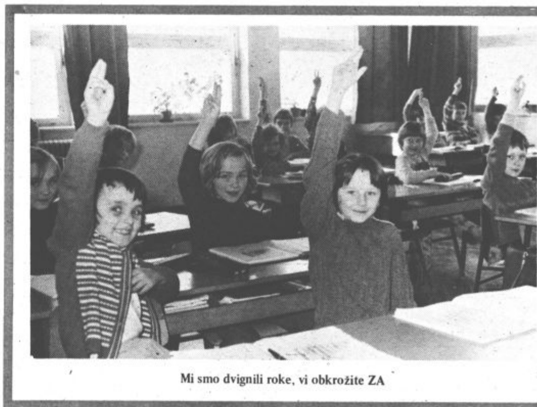
Mi smo dvignili roke, vi obkrožite ZA

Preostala sredstva za gradnjo objektov otroškega varstva ter vzgoje in izobraževanja bodo samoupravne interesne skupnosti zagotovile s svojimi rednimi dohodki ter s sredstvi, ki jih bodo zagotovile po samoupravnem sporazumu za te investicije temeljne organizacije združenega dela.