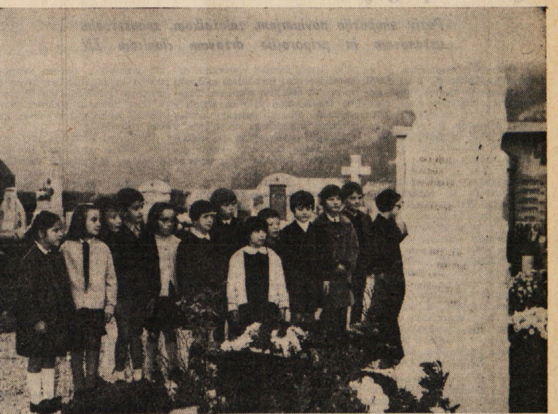
Danes se bomo spomnili naših pokojnih in okrasili bomo njihove grobove. Še posebno se bomo s hvaležnostjo spomnili vseh, ki so žrtvovali življenje, da bi mogli mi živeti boljše čase. Včeraj so se na katinarskem pokopališču poklonili padlim za svobodo tudi katinarski otroci

BEOGRAD, 31. — Komisija zvezne skupščine za ustava vprašanja je danes pričela sklepno razpravo o ustavnih spremembah in sprejela nekatere osnovne ustavne popravke, ki jih bodo predložili skupščini in javnosti v razpravo. Med prvimi je komisija sprejela popravke, da se v čl. 2 ustave poudari, da SFRJ poleg šestih republik sestavlja tudi avtonomni pokrajini Vojvodine ter Kosova in Metohije, kar doslej ni bilo izrecno rečeno. Ideja tega popravka je, da se čim ustrežne zagotovijo enakopravnost vseh narodov Jugoslavije. Drugi popravki se nanasa na strukturo bodoče zvezne skupščine. Predlaga se namreč, da zvezno skupščino sestavljajo: svet narodov (kot svet delegatov republik in pokrajin), gospodarski svet, kulturno - prosvetni svet, socialno - zdravstveni svet (kot svet delovne skupnosti) in družbeno - politični svet (kot svet delegatov, državljanov in občin), ki bi imel moč vseh pristojnosti od sedanjega zveznega sveta. Zelo važna razprava je bila občin načina volitev v posamezne svete. Poleg utemeljitev v korist neposrednih volitev so zagovorniki poslednjih volitev upravičeno opozarjali, da so poslednje volitve v določenih pogojih lahko demokratske.