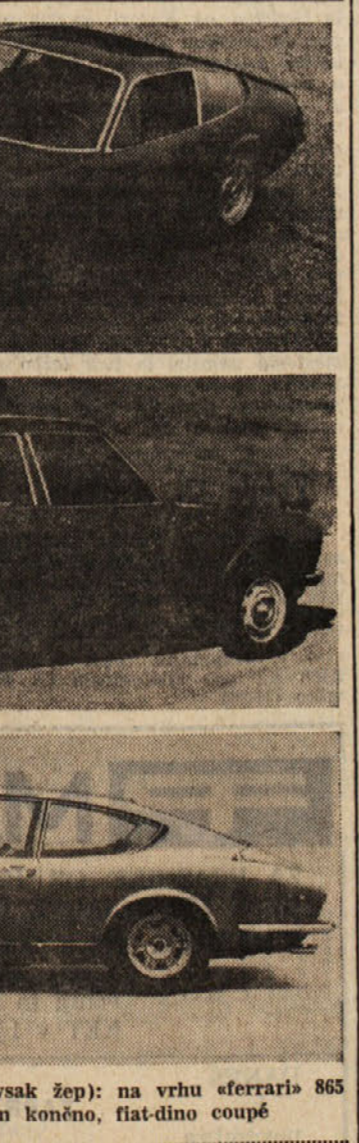
Za sleherni okus (pa čeprav ne za vsak žep): na vrhu «Ferraris 865 GTB/4», v sredini «Peugeot 604», in končno, fiat-dino coupé

Kar zadeva sedanji mednarodni avtomobilski salon, moramo takoj poudariti, da vidimo na njem izključno osebne avtomobile, ker bodo spomladi in sicer od 12. do 20. aprila na istem razstavišču priredili razstavo tako imenovane industrijskega vozila, to se pravi tovornjakov, avtobusov, gasilskih vozil in drugih motornih vozil, ki ne spadajo na področje osebnih vozil.