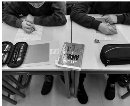
Slika 2: Ustvarjanje učencev na temo prebranih zgodb

Precej učencev se je odločilo za likovno upodobitev v obliki stripa na temo Mladost je norost ... V kratkem času 20-ih minut je nekaterim uspela čudovita upodobitev vseh prebranih odlomkov. Njihovi izdelki so zasijali