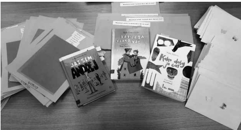
Slika 1: Knjige in delovno gradivo, vključeno v projekt

Pri načrtovanju dvehurnega pouka za sedmošolce smo posegli po naslednjih nalogah: na temelju izbranih odlomkov iz del Kako dolg je čas (Mate Dolenc), Jaz sem Andrej in Babica za lahko noč (Vinko Möderndorfer) smo učence povabili k ustvarjanju. Pripravili smo pisne podlage za različne naloge: za literarni del smo pripravili liste rumene barve, ki naj bi simbolično ponazarjali sonce, nanje pa smo prilepili trše liste rjave barve, na katere so učenci zapisali besedila. Rjava barva je v našem primeru ponazarjala starost, zrelost v družbi rumene, sončne barve, ki je prisposoba sonca, mladosti, optimizma in navdiha. Na vrhu pripravljene pisne podlage smo prilepili Pavčkovo pesem: Vsak zase tiho zori, / počasi in z leti, / a kamor greš, vse poti / je treba na novo začeti . Rumeni list z rjavim osrednjim delom je bil torej navdih učencem za literarno ustvarjanje treh različnih nalog, ki bodo podrobno opisane v nadaljevanju.