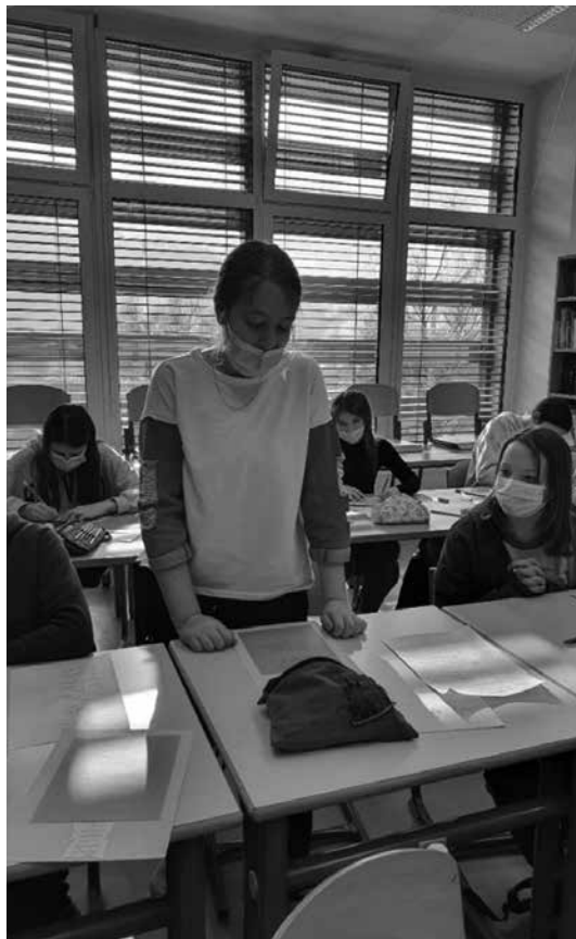
Slika 3: Predstavitev izdelkov

Kar četrtnina jih je nagovorila svoje starše ali dedke in babice, da so sodelovali in z nami delili razmišljanja o mladosti ter zreli starosti. Napisali so ogromno zanimivih in hudomušnih mnenj.