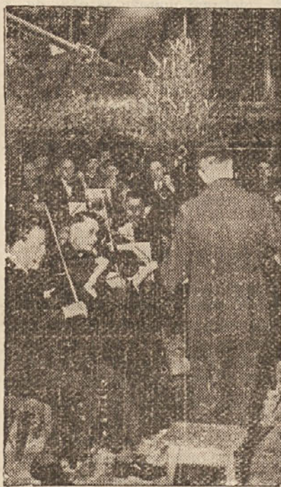
Rudarji rudnika v Reihershausenu pri Göttingenu so praznovali božič v globini 900 m pod zemljo. Orkester gledališča v Göttingenu jim je pa sviral.

Ali so se pri tem odvadili kletvin, o tem nimamo podatkov, res pa je, da so ljubljanski paglavci imeli svoj brezplačen teater, ko so poslušali in gledali spokorne arstante.