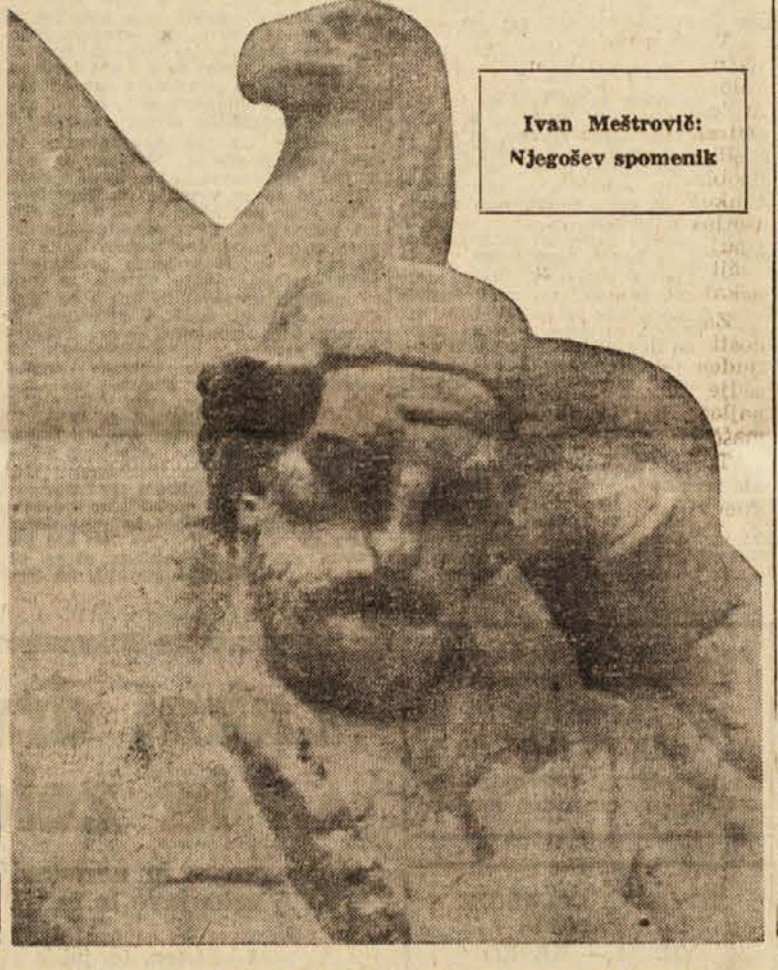
Ivan Meštrovič: Njegošev spomenik