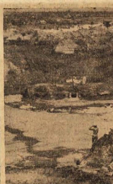
Evakuacija ob ustju Rdeče reke

Hanoj, 10. jul. (AFP). V ustju Rdeče reke je bilo včeraj precej mirno. Boji so se bili le pri mestu Vin Jen. Pritisk vietnamskih entozevanja.