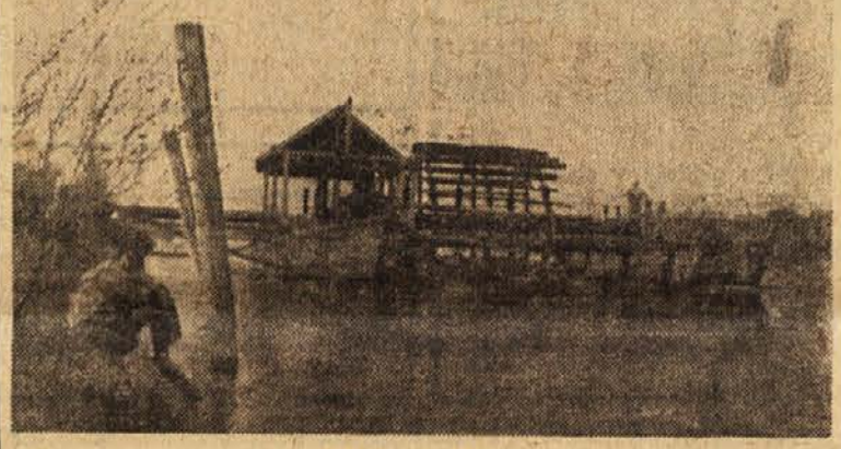
Mlin na Muri

Zveza borcev se pripravila, da bo slovesno praznovala Dan vstaje. Ker pa posamezni tovariši niso opravili svojih nalog, še ni zbran vse zgodovinski material in nekateri aktivni borci NOB še niso odklopani.