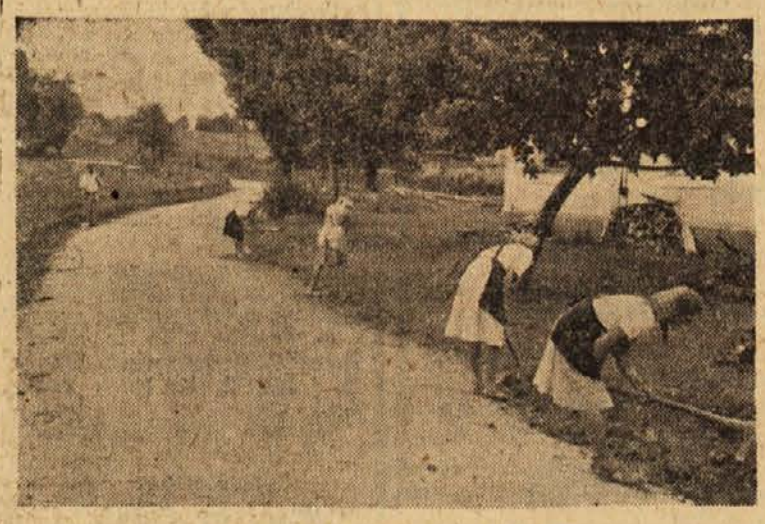
Belokranjci pridno urejajo ceste

V gozdovih okrog St. Janža, Krmelja in Tržiča je tudi letos dovolj borovnic. Vasčani omenjenih vasi jih nabere na dan preko 100 kg, včasih pa tudi več. KZ v St. Janžu jih plačuje kg po 45 din. K. J.