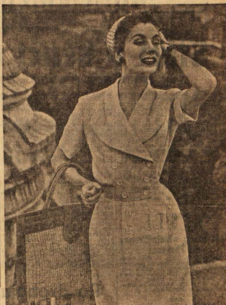
Obleka iz modrega bombažnega blaga.

Senčnike lahko napravimo iz najrazličnejših tvarin. Zanje lahko uporabimo ostanke svile, kretone, cica, tafta, lahko pa jih napravimo iz impregmiranega, pergamentu podobnega papirja.