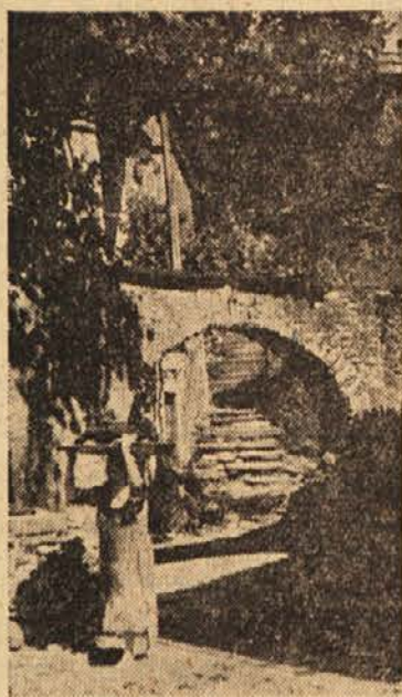
Motiv iz Vipave

V delo klubov članov delavskih svetov bo praksa gotovo prinesla razne spremembe in izboljšanja oblik dela, ki jih vnaprej ni mogoče predvideti.