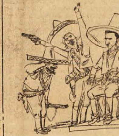
»Ljudstvo je z velikim navdušenjem izbralo novega predsednika republike«

»svobojeno« glavno mesto Guatemala, v katerem so bile že končane prve ustrelitve in aretacije kakih 1000 Arbenzovih pristašev. Polkovnik Armas je imel prvi grozljivi govor: »adsko Guatemala monsignor Avelana pa je naslovil na vernike pastirsko pismo z željo, da se