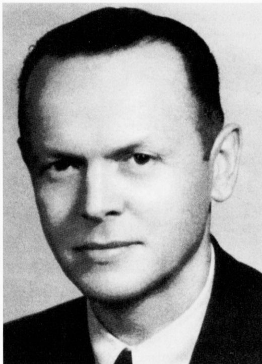
Posnetek iz 1953. leta

V letih 1918-19 je v Zagrebu študiral gozdarstvo, nato medicino v Ljubljani, Gradcu in Zagrebu ter tu 1927 diplomiral. Dve leti je delal kot oddelčni zdravnik v Brežicah, od 1930 v bolnišnici za ženske bolezni v Ljubljani. Izpopolnjeval se je v Zagrebu (1932), Franciji, Belgiji, Nizozemski, Italiji in Veliki Britaniji (1937-38); 1939 je postal primarij. Kot član zdravniškega matičnega odbora OF za Ljubljano je 1941 vodil zbiranje in pošiljanje sanitetnega materiala za partizane. Leta 1942 se je tudi sam vključil v NOV. Najprej je bil upravnik Slovenske centralne vojne partizanske bolnišnice, od decembra 1943 pa šef sekcije za bolnišnice pri sanitetnem oddelku Glavnega štaba NOV in Partizanskih odredov Slovenije. V razmerah partizanskega vojskovanja je