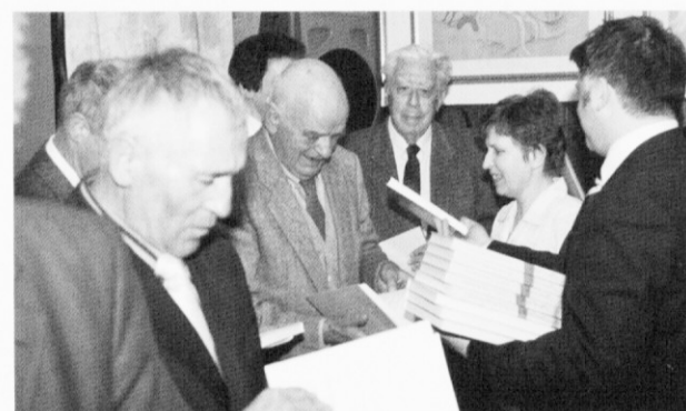
Ustvarjalcem sta ravnateljica in župan podarila zbornik V vzponu znanja