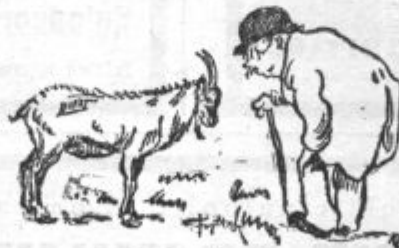
Dva dobra prijatelja med seboj.

Praden grem na drugi svet te prosim odpuščanja, da mi odpustiš, če sem te le kedaj v svojem življenju kaj razžalil.