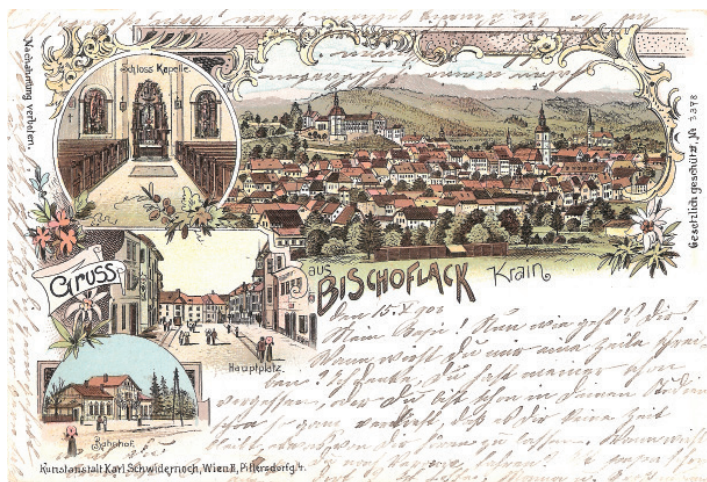
Litografija Škofje Loke s pogledom na veduto mesta, grajsko kapelo, Mestni trg s Homanovo hišo ter železniško postajo, poslana leta 1903. (Ihrani: zasebni arhiv)

Ključne besede: Škofjeloška kopalniška družba, Olepševalno društvo, Tujsko-prometno društvo, Turistično društvo Škofja Loka, Turizem Škofja Loka.