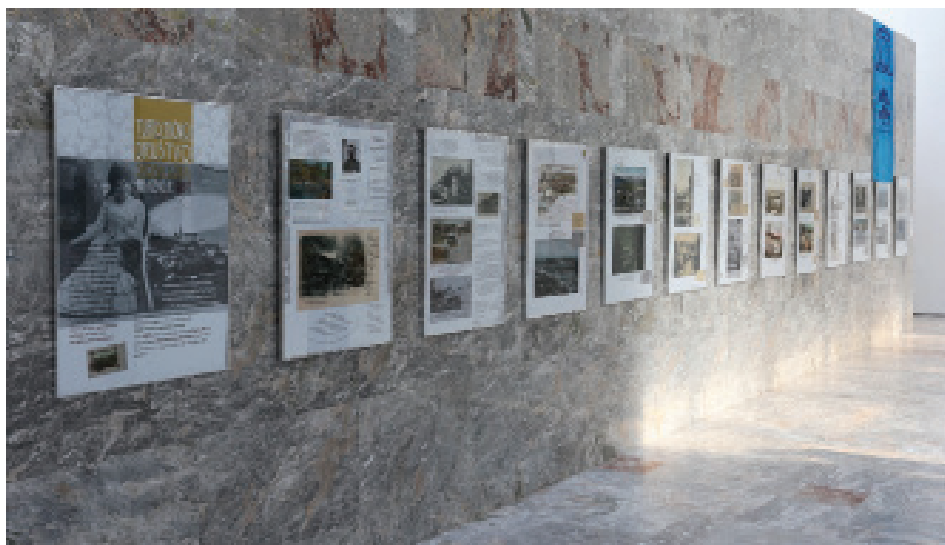
Razstava starih razglednic ob 120-letnici razvoja loškega turizma v Sokolskem domu (29. 9.–22. 10. 2017).

društveni prostor v Kašmanovi hiši na Mestnem trgu. Ob občinskem prazniku je prejelo srebrni grb Občine Škofja Loka za uspešno 50-letno delovanje. 20