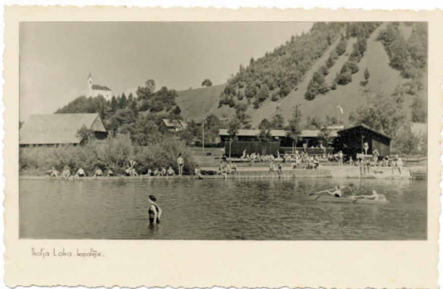
Kopališče v Puštalu.