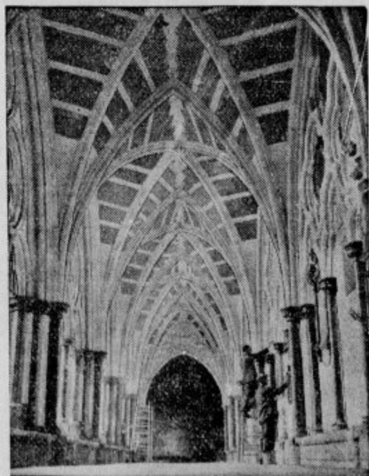
V mleku se koplje... Svetovnoznano londonsko cerkev Westminster-abbey, ki izvira iz 16. stoletja in krije grobove angleških kraljev, bodo od vrha do tal izmili z mlekom. Strokovnjaki so dognali, da se na ta način marmor najbolje ohrani.