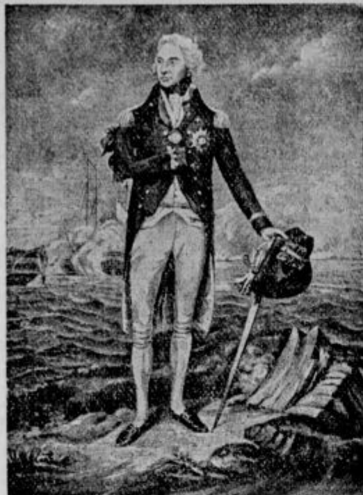
Nesmrtni junak morja: angleški admiral H. Nelson, slavnj zmagovalc v bitki pri Trafalgaru, čegar 175 letnico rojstva so obhajali Angleži 29. t. m.