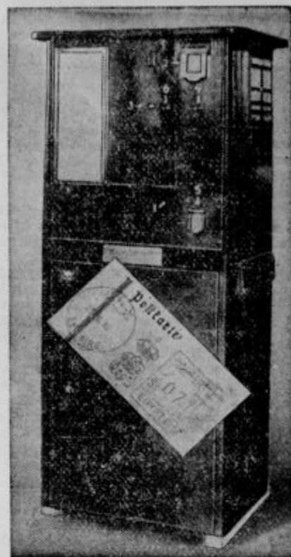
Avtomatični poštni urad: Če vržeš v ta avtomat pismo in potreben denar, aparat pismo opremi z znamko, pritisne nanj pečat in odpravi v poštni nabiralnik. Avtomat je zgradila neka berlinska tvrdka in ga prvič razstavijo meseca februarja 1934 na kongresu svetovnega poštnega društva.

Straznik: Ali ne veste, da je danes Gregorjev fotozlet v Slovenske gorice? Danes so vsi Ljubljančani v Ormožu, Ptuj in Ljutomeru.