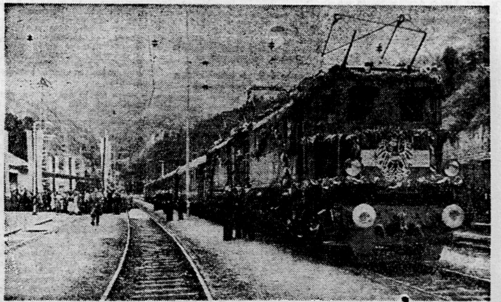
Škofi dež in okrašene postaje je peljal v petek prvi električni vlak od Beljaka do Področja. Poleg dosežanj zveze z Nemčijo, Svico in Italijo ima sedaj Avstrija elektrificirano železniško zvezo tudi s Jugoslavijo. Ta zveza bo dobila svoj prvi pomen, ko bo mo elektrificirali tudi našo gorjenjsko progo in josenjski železniški voz. Elektrifikacija tega dela pomembne mednarodne proge kaže dobre volje Avstrilcev, da bi okrepili promet z našo državo in s njenimi pristanišči ter čez njo s Trstom in ostalim Balkanom. Na sliki: Slovensost na postaji Področja ob prihodu prvega električnega vlaka.