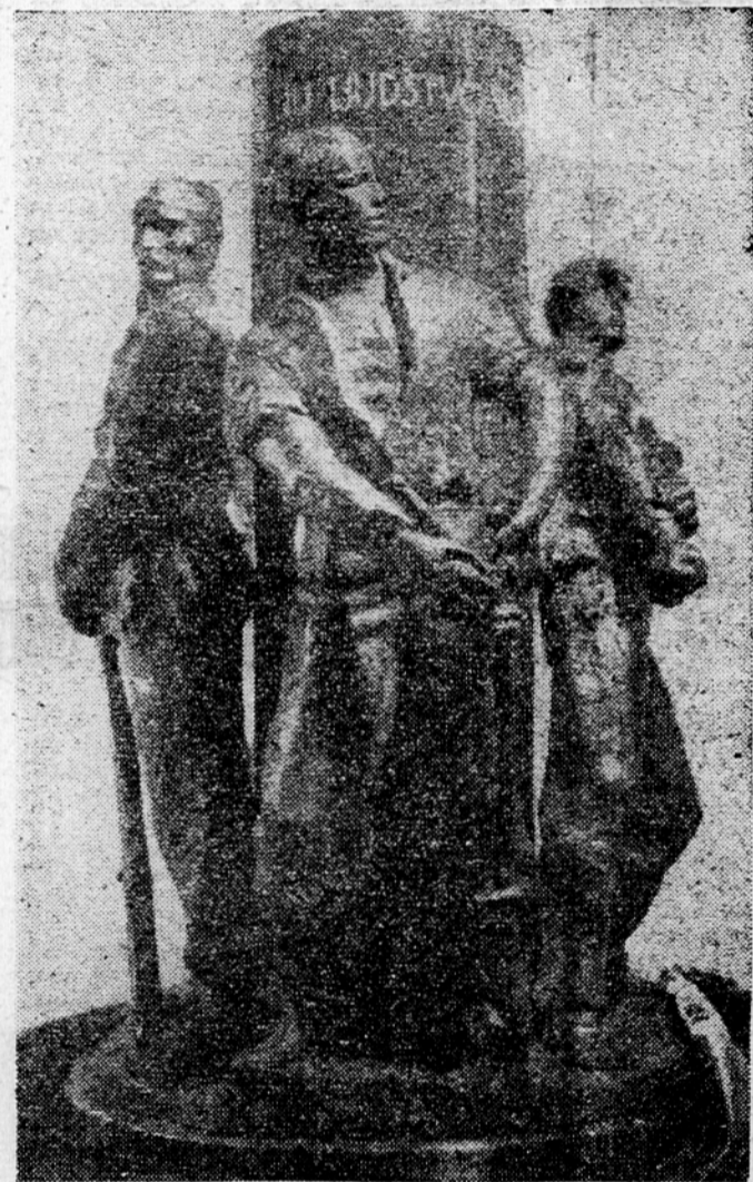
Kip, ki ga je U Nu dobil v dar na zletu v Kopru