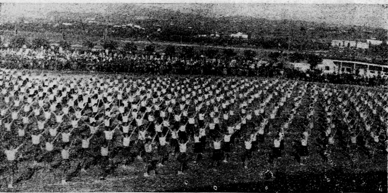
Proste vaje mladink na pokrajinskem zletu »Partizana« v Kopru, ki mu je prisostvoval tudi predsednik vlade Burmanske unije U Nu