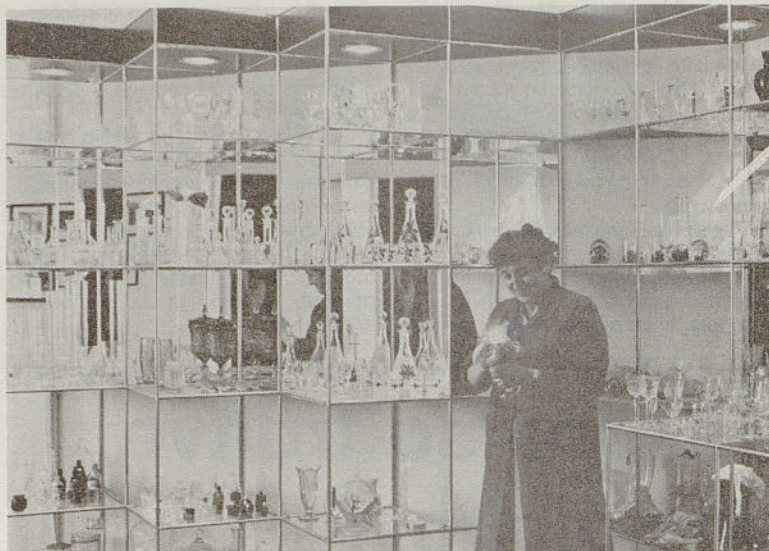
Delček preteklosti in dela hrastniških steklarjev danes hranimo v našem muzeju. Vredno ga je čuvati.

S prvenstvenim tekmovanjem so pričeli tudi kadeti. V prvem kolu so