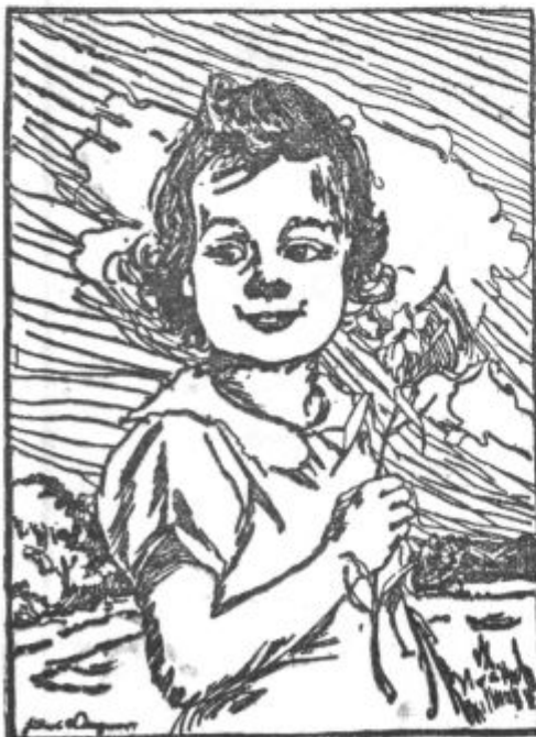
H. Wagner: NAŠ OTROK

Smutsova odprava je torej dosegla, da bodo dobili ti ostanki izumirajočega ljudstva del pokrajine z neomejenimi lovskimi pravicami in kjer se bodo mogli stalno naseliti. Tudi ameriški Carnegiev zavod za narodopisje jim bo pomagal. dt