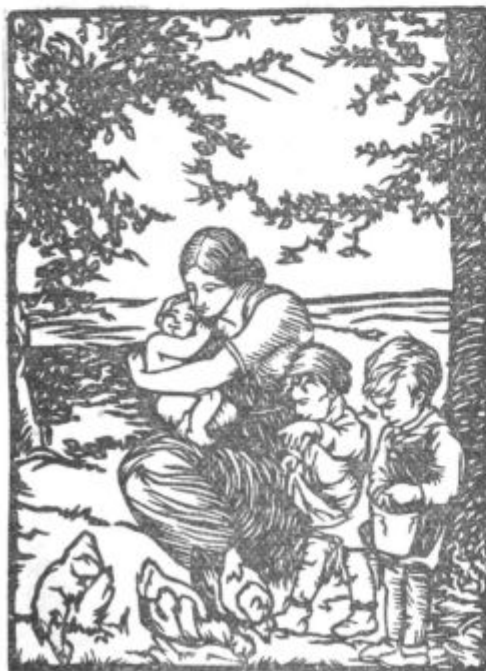
PRI MATERI (A. de Wall — izrezanka),

Les pâtres sont des rois, les femmes ont des gestes Nobles, un parler calme et doux, un grave accueil. Les fleurs même, en ce sol d'endurance et d'orgueil, N'ont pas de parfums lourds, mais des senteurs agrestes.