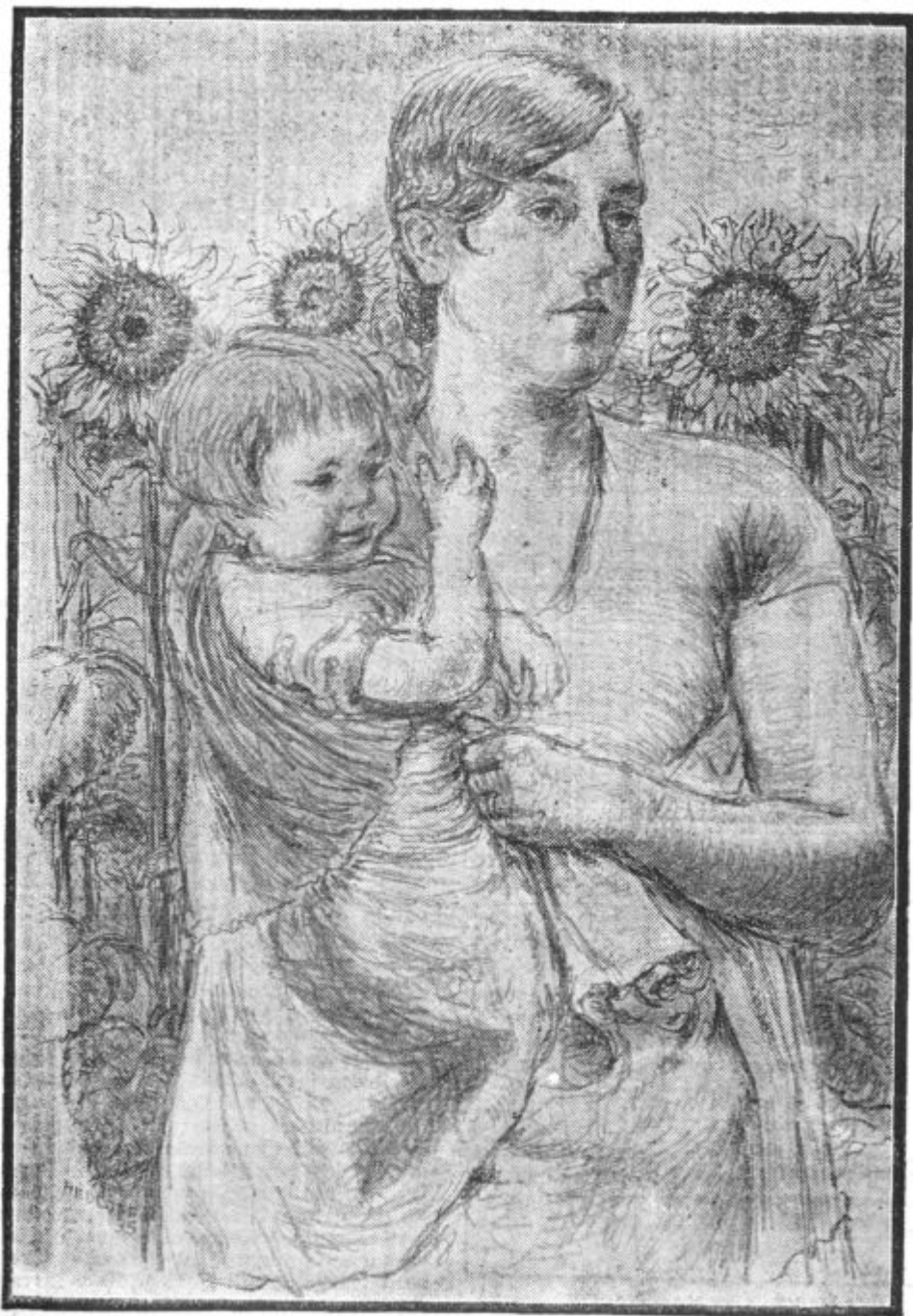
MED SONČNICAMI (litografija)