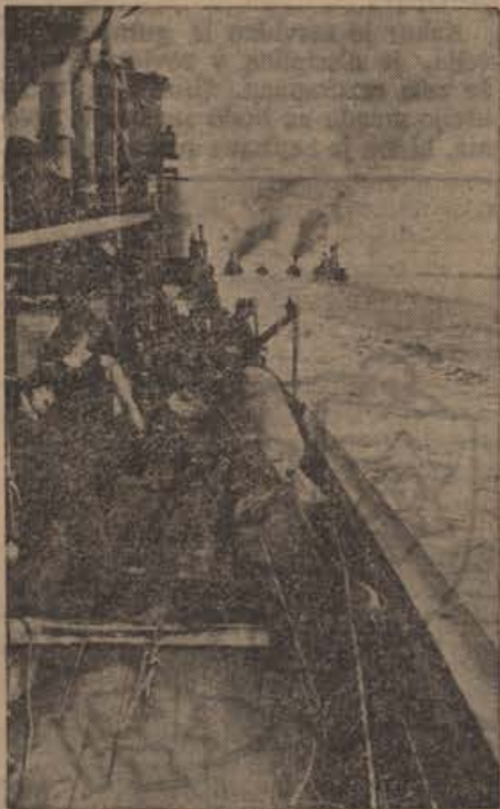
Minensucher auf der Fahrt in das minenverseuchte Gebiet. Stille, aber wichtige Arbeit, die für die Schifffahrt geleistet wird

Izkazalo se je, da se je tolikanj napovedana angleška ofenziva brez pristanka v svrhu razbremenitve Sovjetov klaverno razbila. Od 22. junija do 9. septembra so izgubili Angleži več kakor 1200 letal. Angleži sami smatrajo to ofenzivo kot razbito, zato že par dni ne napadajo kanalske obale, temveč napadajo nemško civilno prebivalstvo v nočnih napadih. Nemška obramba je tako učinkovita, da so se tudi ti napadi v največji meri izjalovili. Samo pri napadu na Berlin so izgubili 21 letal. Angleške izgube na morju in v zraku so bile v preteklem tednu tako občutne, da jih nobena laž ne more spraviti s sveta.