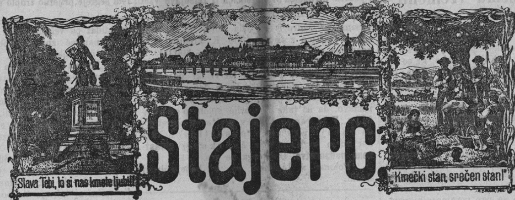
Slava Tebi, ki si nas kmeto ljubil!

„Stajerc“ izhaja vsaki petek, datiran z dnevom naslednje nedelje. Naročnina velja za Avstrijo: za celo leto 3 krome, za pol in četrt leta razmerno; za Ogrsko 4 K 50 vin. za celo leto, za Nemčijo stane za celo leto 5 kron, za Ameriko pa 6 kron; za drugo inozemstvo se računani naročnino z ozirom na visokost poštnine. Naročnino je plačati naprej. Posamezne števe se prodajajo po 6 v. Uredništvo in upravitelstvo se nahajata v Ptuj, gledališko poslojše št. 3.