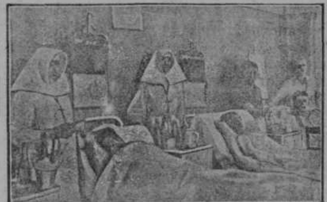
Desno: Rešeni po 144 urah. Rudarji v premogovniku Beuthen v Nemčiji so bili 144 ur zasuti. Na sliki vidimo rešene v bolnici.