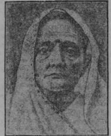
Žena vodje indijskih nacionalistov Ghandija, gospa Kasturbay, je bila aretirana od angleške oblasti.