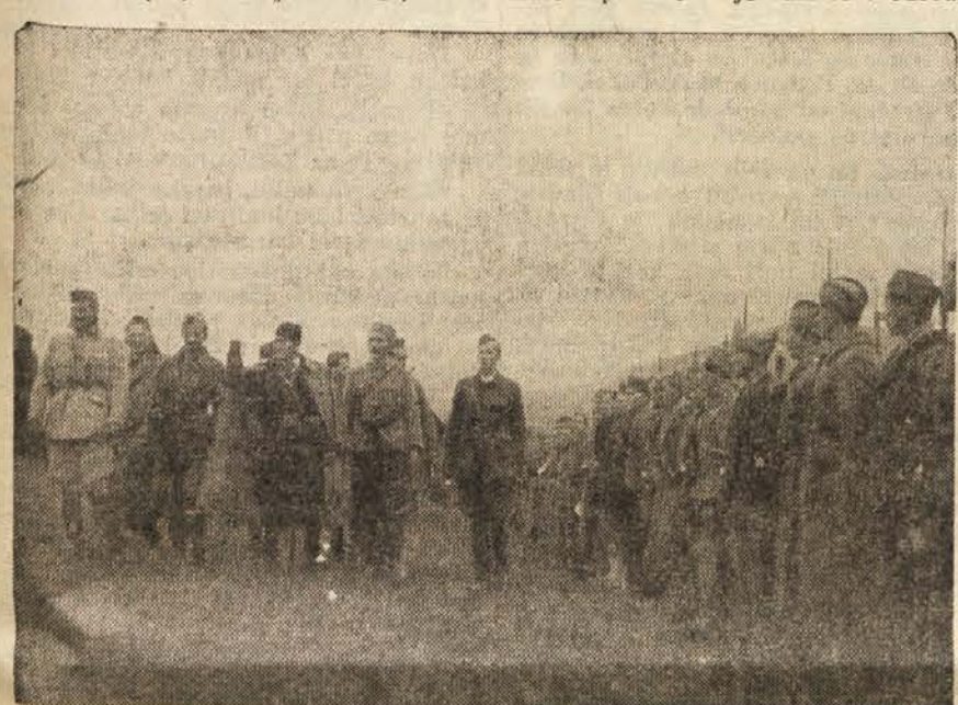
Maršal Tito pri predaji zastave I. proletarski brigadi leta 1942. v Bosanskem Petrovcu

ditati naši narodi, preden so ustvarili svoje prve regularne edince in preden so se končno osvobodili.