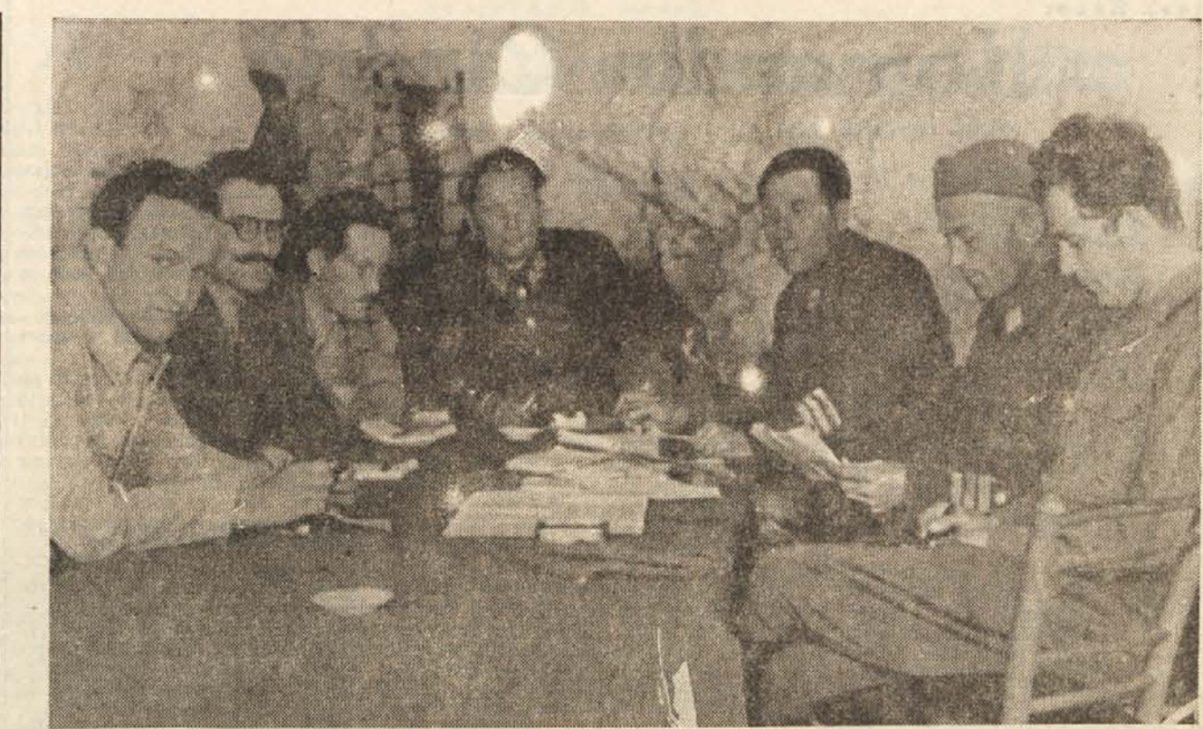
Iz dni slavne osvobodilne borbe. Na sliki (od leve proti desni): dr. Bakarić, Milutinović, Edvard Kardelj, maršal Tito, Aleksandar Ranković, Tempo in Milovan Djilas v podzemnem bivališču (leta 1943)

V brigado so stopili najboljši in najbolj preizkušeni borci, po večini komunisti. Brigada se je kmalu prsilavila s svojo trdnostjo in junaštvom, tako da si je sleherni borec štel v čast boriti se v vrstah brigade. Niso bili redki primeri, da so borci kratkoma zapuščali svoje jedinice v odredih