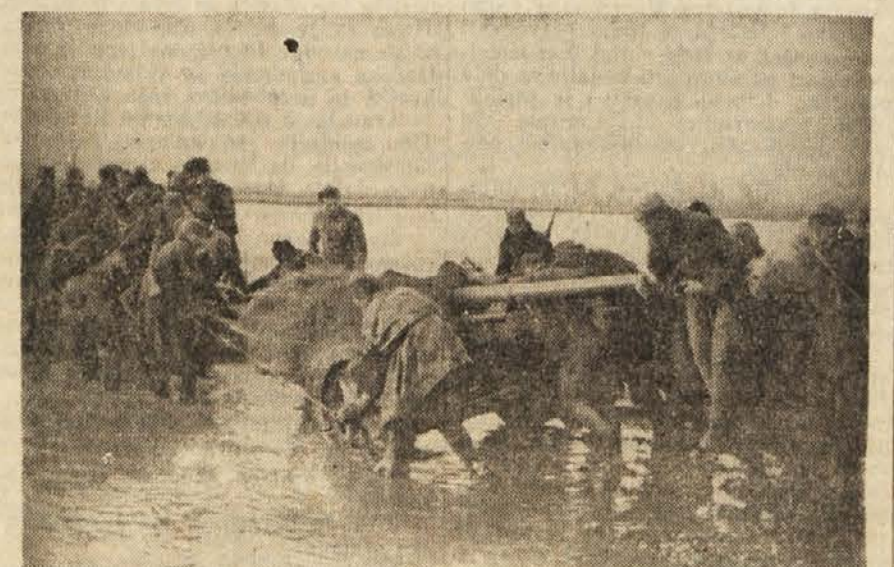
XXVIII. divizija pri prehodu čez reko.

V tej ofenzivi smo zaradi četniške izdaje izgubili svobodno ozemlje v Sandžaku, Črni gori in Hercegovini ter smo morali zapustiti ta teren, kjer je zavladala najbolj krvava in nečloveška oblast četniških izdajalcev. Naše edince so bile v zelo težavnem položaju za ad. pomorni nja st. va in živeža, bile pa so moralno močne,