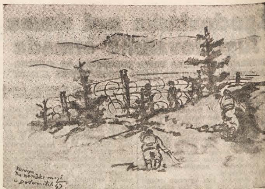
Kurirja Dolomitskega odreda čakata ob meji, da bo šla mimo nemška patrola