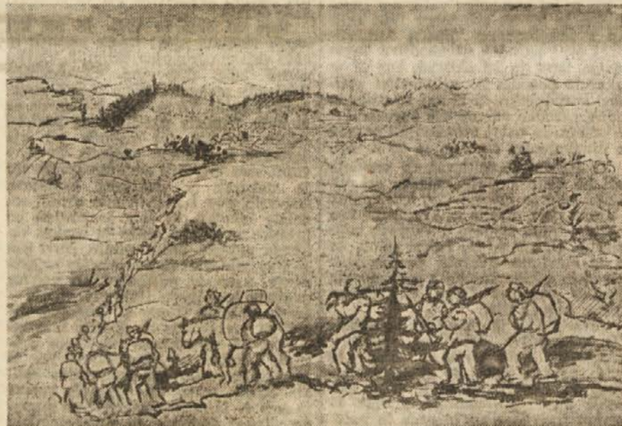
Pohod Šerčerjeve brigade po borbi pri Krvavi peči na Notranjskem