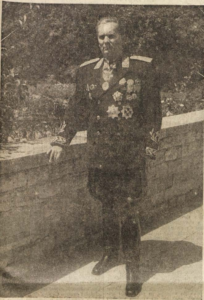
Organizator JA, vrhovni komandant oboroženih sil in minister za narodno obrambo, maršal Jugoslavije Josip Broz-Tito

Predsednik zvezne vlade, minister za narodno obrambo in vrhovni komandant oboroženih sil FLRJ, maršal Jugoslavije Josip Broz-Tito je določil 22. decembra za »Dan Jugoslovanske armade«, ki ga bo naša armada obhajala vsako leto kot svoj praznik. Proglasitev dneva Jugoslovanske armade je pomembno priznanje naši armadi. Ta dan slave z armado tudi naši narodi, ki so jo vzgojili in vzljubili kot svoje najdražje dete. Tako je praznik Jugoslovanske armade tudi praznik naših narodov.