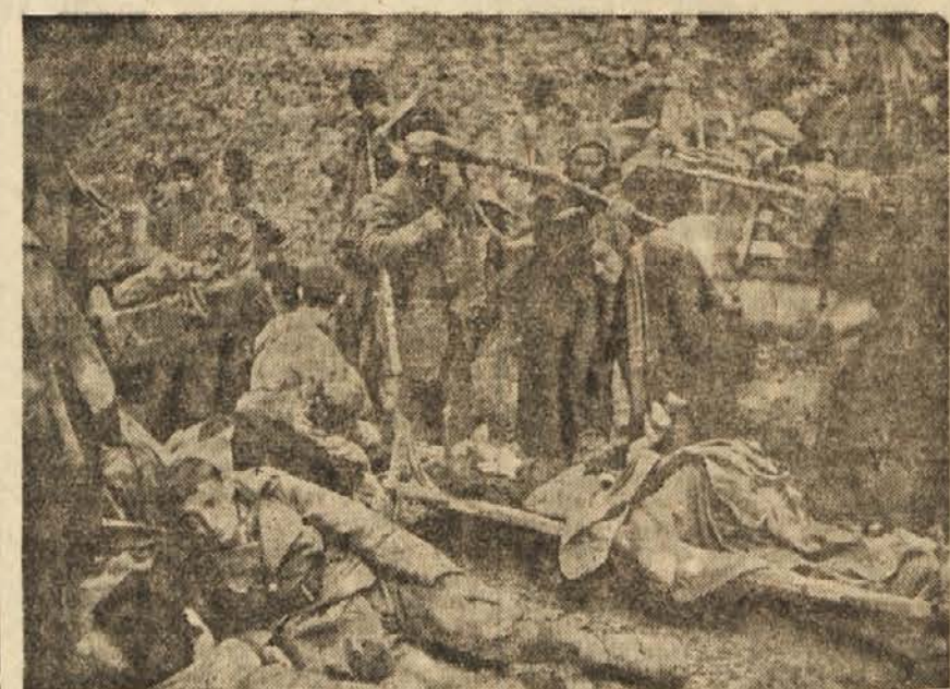
Bolnica na Zelengori ob V. ofenzivi

Živela Jugoslovanska armada — osvoboditeljica naših narodov, čuvar pridobitev osvobodilne borbe, neodvisnosti naše domovine in mirne izgradnje socializma v naši državi!