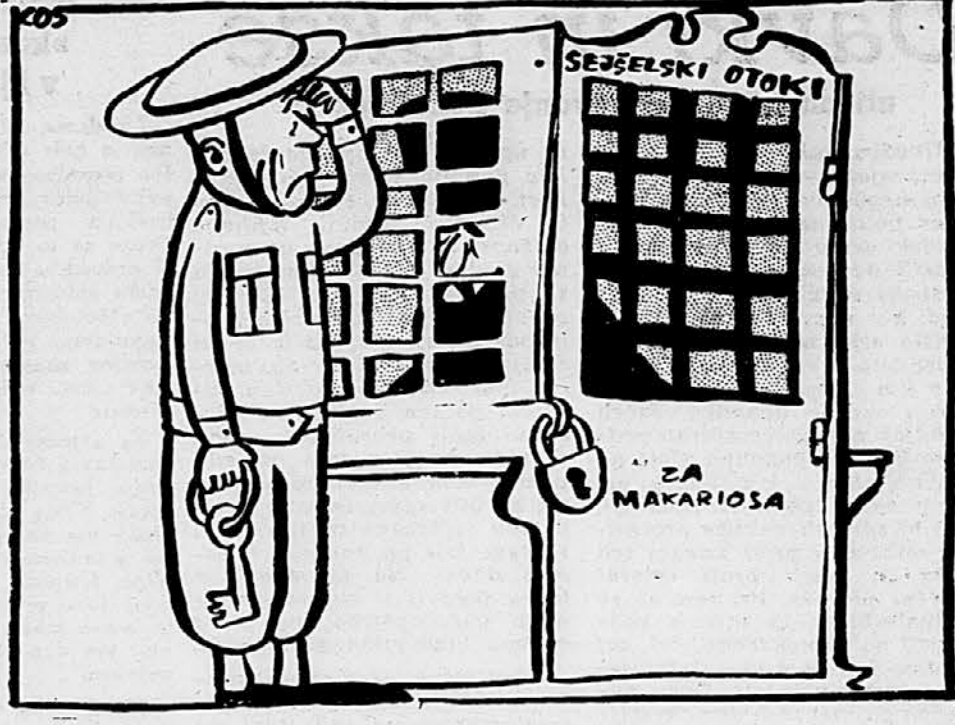
FRANCOSKO - TUNIZIJSKA POGAJANJA

OB SPOVEDNICI Anglešč: »Hm, pa se bo le treba pripogniti pred njim.«