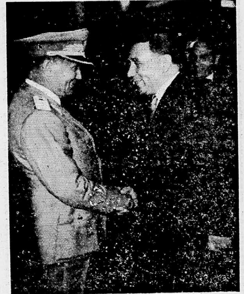
Predvčerajšnjim se je predsednik Tito s sodelavci vrnil v domovino. Na sliki: Predsednik Tito se na beograjski železniški postaji pozdravlja z Aleksandrom Rankoviciem.