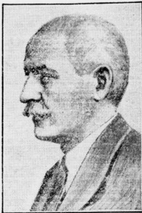
Min. predsednik Mušanov, ki je odstopil in bil poverjen s sestavo nove vlade

Ljudje, ki trpe na otežkočeni telesni potrebi in ki jih radi tega mučijo krvno prenapolnjenju trebuha, pritisk (v možgane) krvi v možgane, glavobol, močno utripanje srca, dalje, ki trpe na boleznih dančne sluznice, fišurah, hemoroidalnem zamotku, fistulah jemljejo za iztrebljenje črevesa zjutraj in zvečer po četrtinico »Franz Josefove« grenčice. Vodilni zdravniki kirurških zavodov izjavljajo, da se poslužujejo »Franz Josefove« grenčice po operacijah z najboljšim uspehom. »Franz Josefova« grenčica se dobi v vseh lekarnah, drogerijah in specerijskih trgovinah.