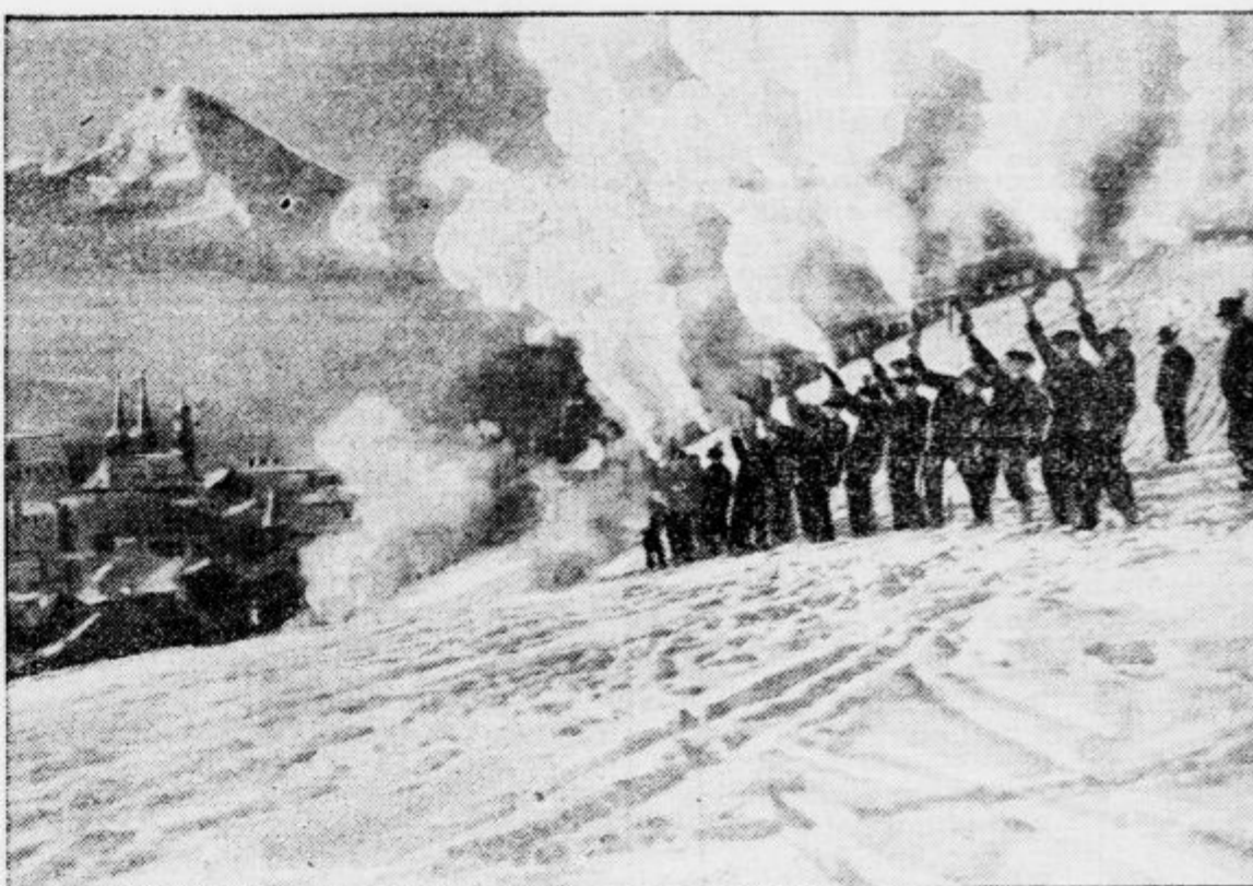
Bavarski gorski strelci pozdravljajo novo leto s častno salvo