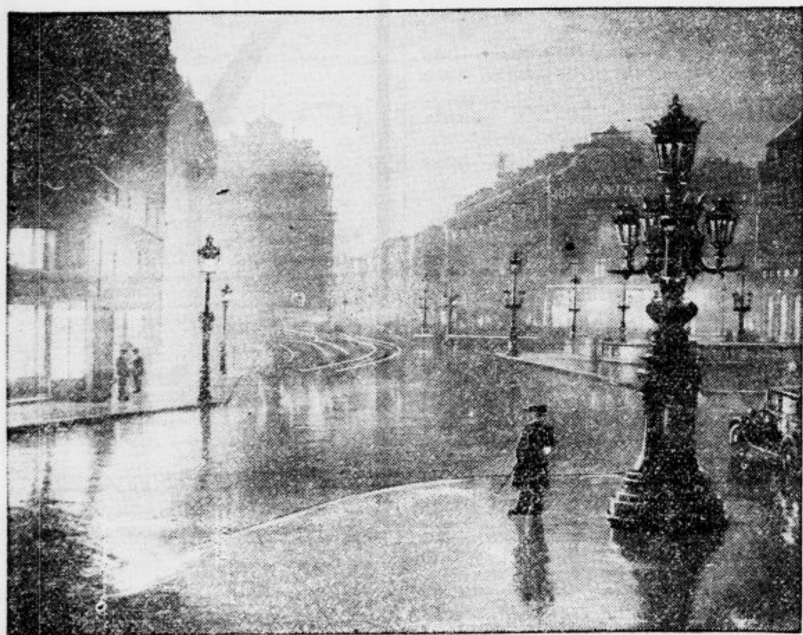
Posnetek pariškega trga pred Opero v poldnevni razsvetljavi