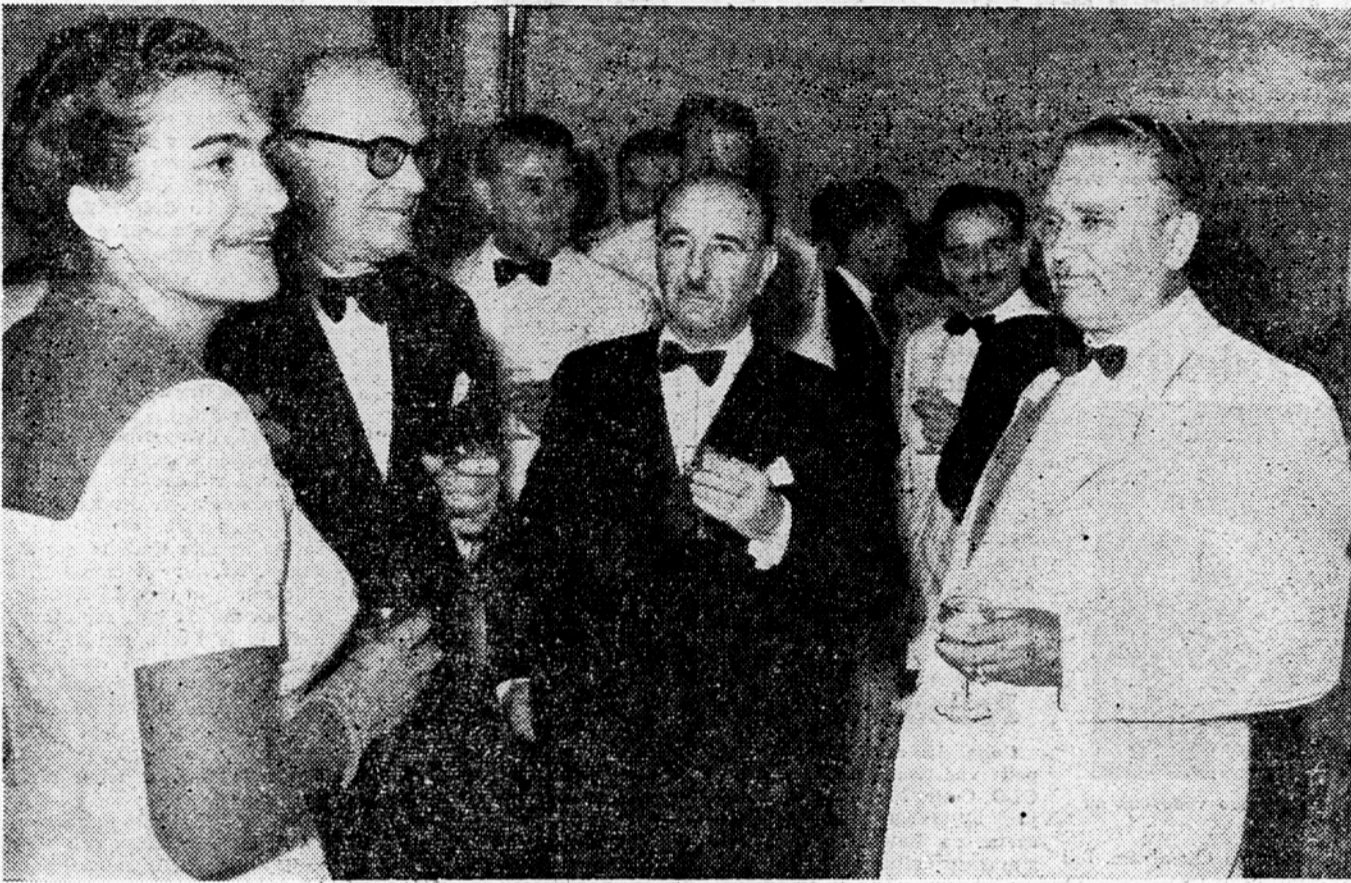
Predsednik republike Josip Broz Tito je po podpisu pogodbe o Balkanski zvezi v ponedeljek zvečer priredil v vili »Bled« svečan sprejem za delegacije treh balkanskih držav na blejski konferenci. Na sliki od leve proti desni: Jovanka Broz, grški zunanji minister Stefanopoulos, za njim podpredsednik zveznega izvršnega sveta Rankovič, turški zunanji minister Fuad Köprülü, predsednik republike Josip Broz Tito, za turškim in grškim zunanjim ministrom pa stojita podpredsednik zveznega izvršnega sveta Svetozar Vukmanovič in državni sekretar za zunanje zadeve Koča Popovič.

Vremenska napoved za sredo: Ponoči nekaj padavin, delno nevihtnega značaja. Čez dan postopno zboljšanje do menjšajoče se oblačnosti. Popoldne v alpskem svetu nagnenje k rahlim krajevnim padavinam. Temperatura podnevi 26 stopinj na Primorskem do 28 stopinj Celzija.