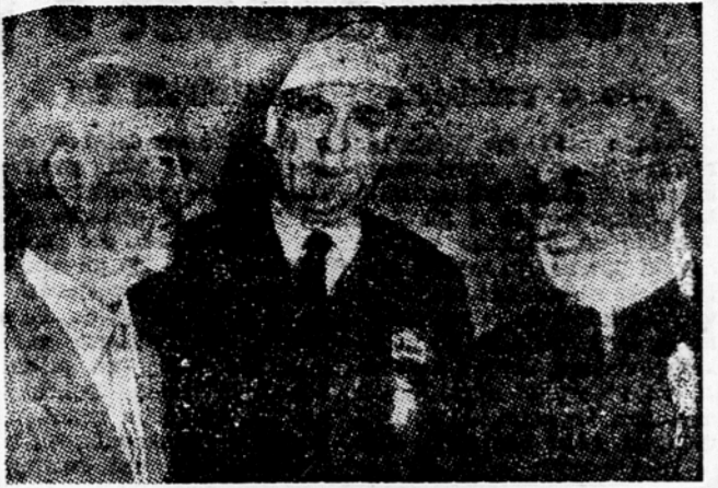
SEUL, 10. avg. (AFP). Na stadionu v Seulu se je zbralo danes okrog 10.000 Južnokorejcev, ki so zahtevali »združitev Koreje s silo«. Za to se je močno zavzemal Sing Man Ki na svojem potovanju po ZDA, ki ga je pred dvema dnevnoma zaključil. Med bivanjem v New Yorku je prišlo tudi do zanimivega srečanja med »norcem z Seula«, kakor nazivajo južnokorejskega predsednika, in enim največjih vatikanskih intrigantov, ameriškim kardinalom Spellmanom, ki sta si prijateljsko stisnila roke (na sliki).

Mendès-France je izjavil, da so ukrepi, ki jih bo v tem pogledu podvzela njegova vlada, liberalni in je dodal, da bo država intervenirala samo, da bi se izognila težavam, ki bi lahko nastale zaradi liberalizacije blagovne zamenjave. Ob zaključku je predsednik vlade poudaril, da izvedba gospodarsko-finančnega programa ni lahka naloga, vendar pa je po njegovi sodbi izvedljiva.