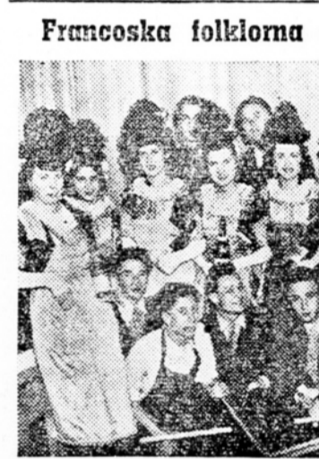
Francoska folklorna skupina v Ljubljani

V Idriji gradijo veliko trgovsko hišo Idrija je stara rudarsko mesto. Prav zaradi tega je stanovanjska stiska zelo velika, ker je mnogo poslopij, v katerih ne smejo iz varnostnih razlogov več stanovati. Lani in letos so morali izprazniti nad 100 stanovanj. Spričo pomanjkanja stanovanj je zelo pereče tudi vprašanje prostorov za trgovine. Prav te okoliščine so prisilile LOMO Idrija, da je pričel na Titovem trgu v Idriji, z gradnje ogromne trgovske hiše. Gradnja je domače gradbeno podjetje »Zidgrad«. Poslopje bo imelo 3 etaže in bo dajalo mestu še lepši in veličastnejši videz. Dosejel sta dve nadstropji že gotovi in je pričakovati, da bo do spomladi v glavnem že zgrajeno. Dodaj so za to investirali okoli 30 milijonov din, treba pa bo odsteli še čedne milijončke, preden bo zgradba gotova.