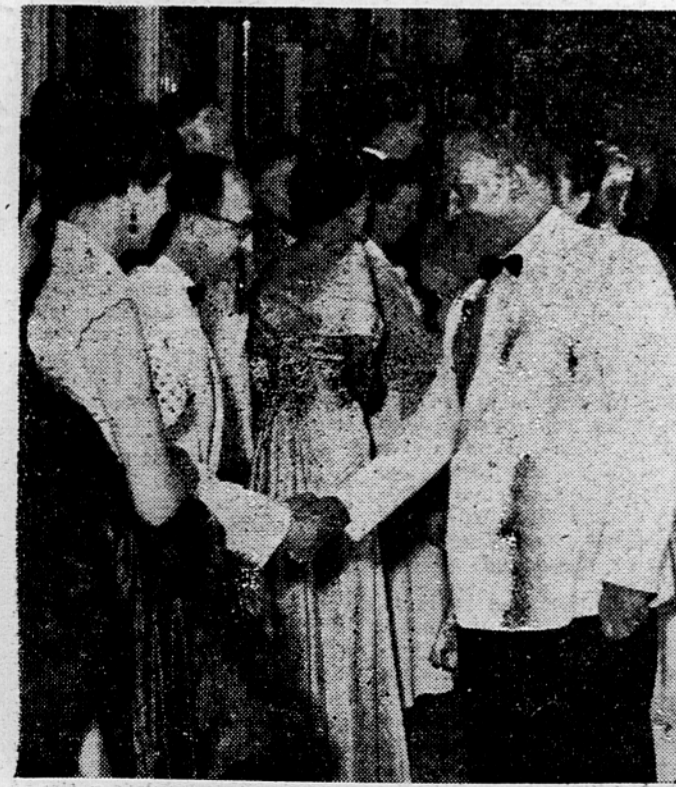
Predsednik republike Josip Broz Tito na svečanem sprejemu na čast delegacijam blejske konference pozdravlja goste.