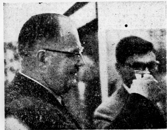
Zvezni kancler ing. Julius Raab pri zdravici v našem paviljonu

Ljubljana, 10. avg. Podpredsednik zveznega izvršnega sveta tov. Edvard Kardelj je sprejel danes delegacijo republiške obrtne zbornice in državnih obrtnih mojstrov ter se zadržal z njimi v skoraj dvehurnem razgovoru. Člani delegacije so ga obvestili o nekaterih težavah, ki zadevajo socialistični sektor obrti. Tovariš podpredsednik je med drugim opozoril, da že sedanja uredba daje v mnogih stvareh možnost ukrepanja ljudskim odborom, medtem ko bo novi zakon dokončno odprl možnosti za še hitrejši razmah socialističnega sektorja obrtništv.