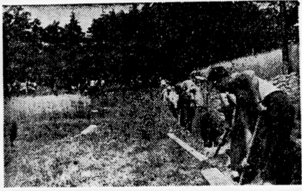
Prostovoljci iz Liboj kopljejo jarek za napeljavo vodovoda na Ostrožno

Cepraz je prostor slavnostnega zbrata stajerskih partizanov na Ostrožnem idealno izbran, vendar zahteva njegova ureditev še mnogo dela. Podjetja s plačano delovno silo bi teh velikih priprav ne zmogla v tako kratkem času, predvsem zaradi pomanjkanja delavcev. Saj je treba opraviti melioracijska dela na slavnostnem prostoru, urediti gozdne poti, napeljati vodovod, urediti glavno in vse ostale dohodne ceste, postaviti na stotine stojnic itd. Zato so na pomoč prihiteli prostovoljci. Člane sindikalnih podružnic mesta Celja in njegovega okraja je pozval k prostovoljnemu delu okrajni sindikalni svet. Poziv je naletel povsod na polno razumevanje. Ze 24. julija so prvi prostovoljci